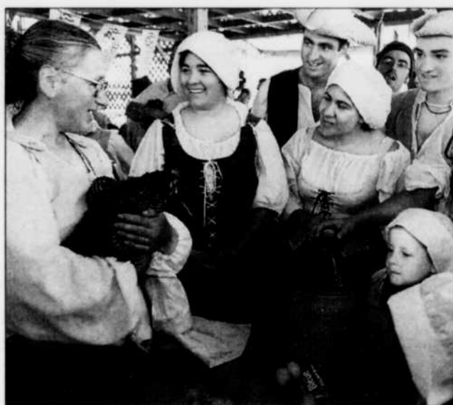
Les belles dames des Fêtes, version 1998.

d'époque à leur distinguée clientèle. Même à place Royale, en plein cœur de la fête, aucun restaurant n'a cru bon préparer quelques plats qui étaient pourtant si bien décrits dans Le Cuisinier français , publié en 1670 ou dans Le Cuisinier royal et bourgeois , publié en 1691, comme l'esturgeon à la Sainte-Menehould ou le potage de perdrix au chou.