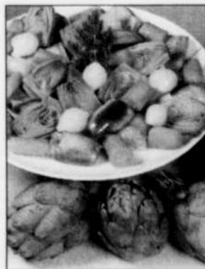
Prêts à déguster.

- Saupoudrer de chaque côté des darnes le quatre-épices et les graines de sésame. Saisir à feu vif de chaque côté. Réduire à feu moyen. Ajouter le zeste, le gingembre, la coriandre et l'ail. Verser le jus d'orange et laisser cuire le saumon jusqu'à la cuisson voulue.