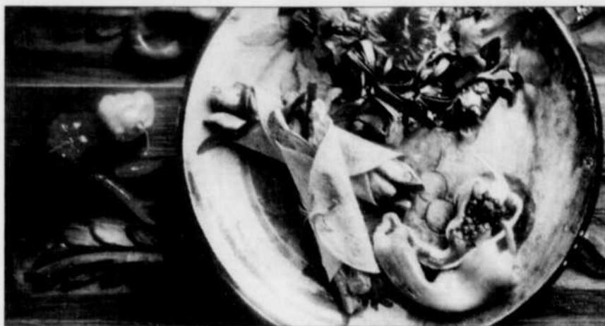
LES PRODUCTEURS DE DINDONS DU QUÉBEC

– Laisser refroidir le mélange complètement avant de le retirer de la plaque. Ajouter les canneberges sèches sucrées Craisins® (Ocean Spray). Verser dans un grand contenant hermétique.