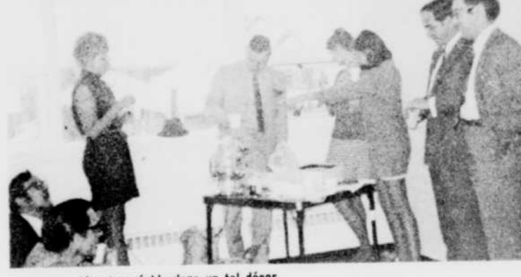
La pause-café est agréable dans un tel décor.