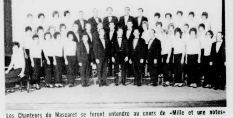
Les Chanteurs du Mascaret se feront entendre au cours de «Mille et une notes» du dimanche 29 mars à 10 heures.