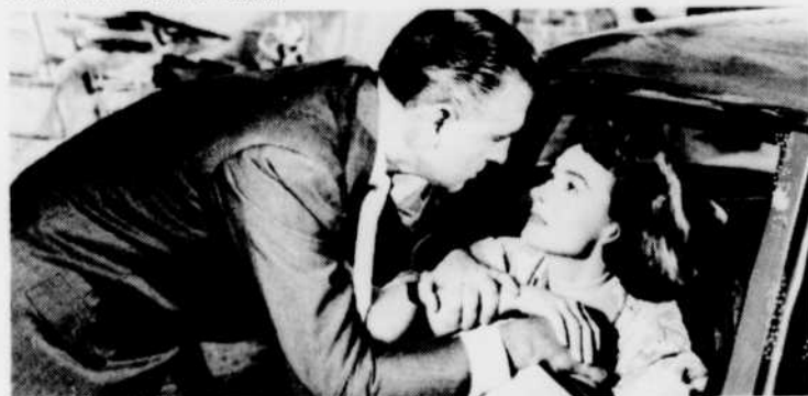
«Le crime était signé»: ce film policier vous sera présenté au «Cinéma du mardi» à 19 h 30.