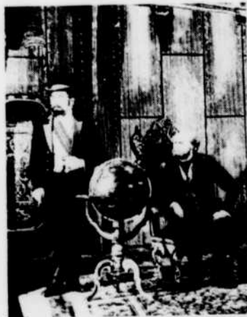
«Aventures fantastiques»: film présenté à «Images en tête», dimanche à 14 h 00.

Jeux d'été (Illici) Interlude (Sommarlek). Drame psychologique de Ingmar Bergman, avec Maj-Britt Nilsson, Birger Malmsten et Alf Kjellin. La danseuse étoile à l'Opéra de Stockholm reçoit un carnet écrit par celui qui fut son premier amour. Elle se rend dans l'île où elle vécut avec lui un été ensoleillé qui devait se terminer par la mort accidentelle du jeune homme, et revit par la pensée ces jours heureux. La plaie ouverte en elle, par cette fin tragique, ne s'est jamais guérie, malgré ses liaisons successives et son travail acharné. (Suédois 1950).