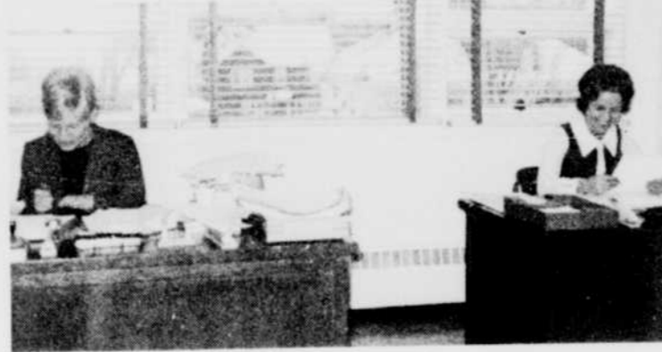
Le nouvel édifice loge des bureaux bien aérés et éclairés.