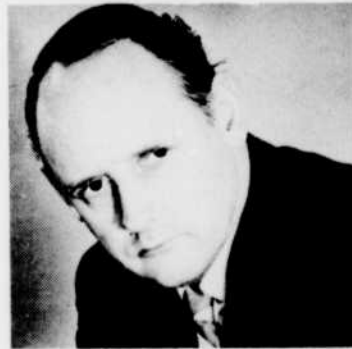
Récital de Bruce HUNGERFORD, pianiste, aux «Mercredis de la musique» à 20 h 33.