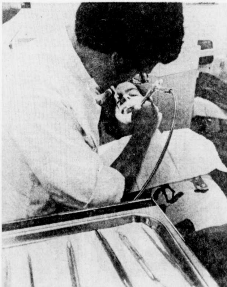
Le Soleil, Jacques Deschênes