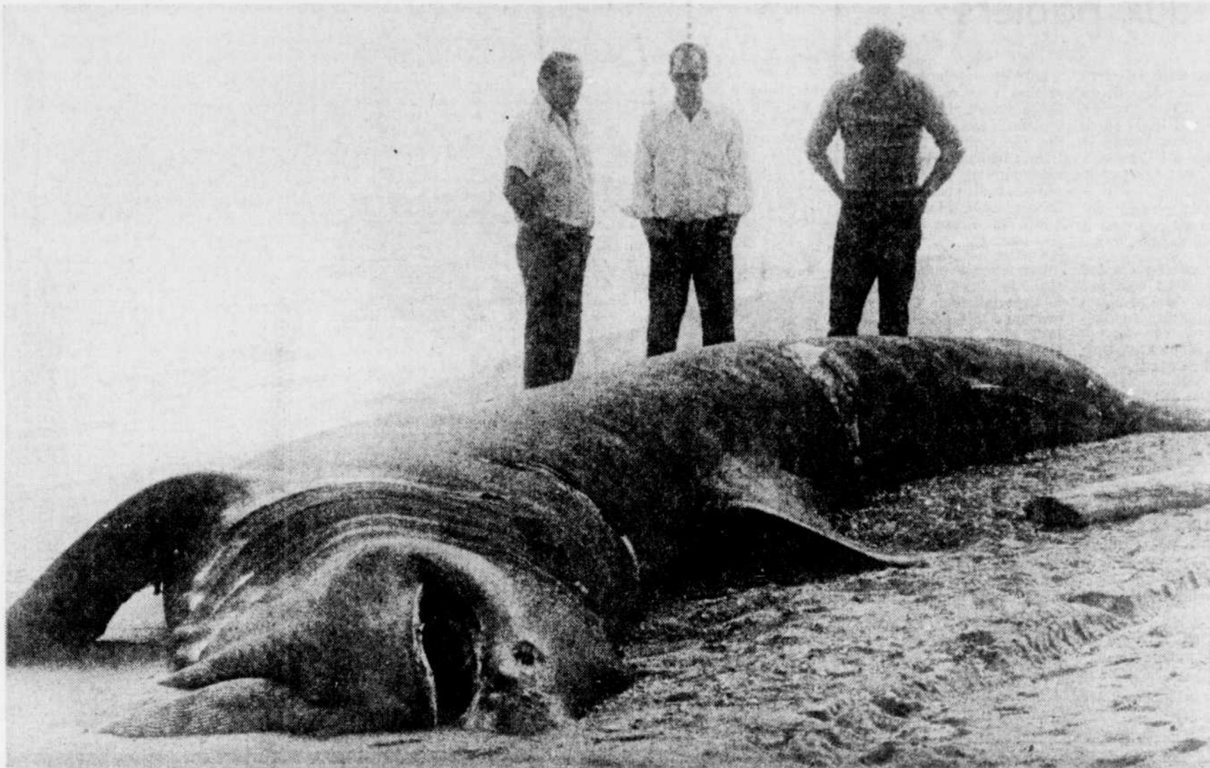
Le requin qui a été capturé près de Sept-Îles.