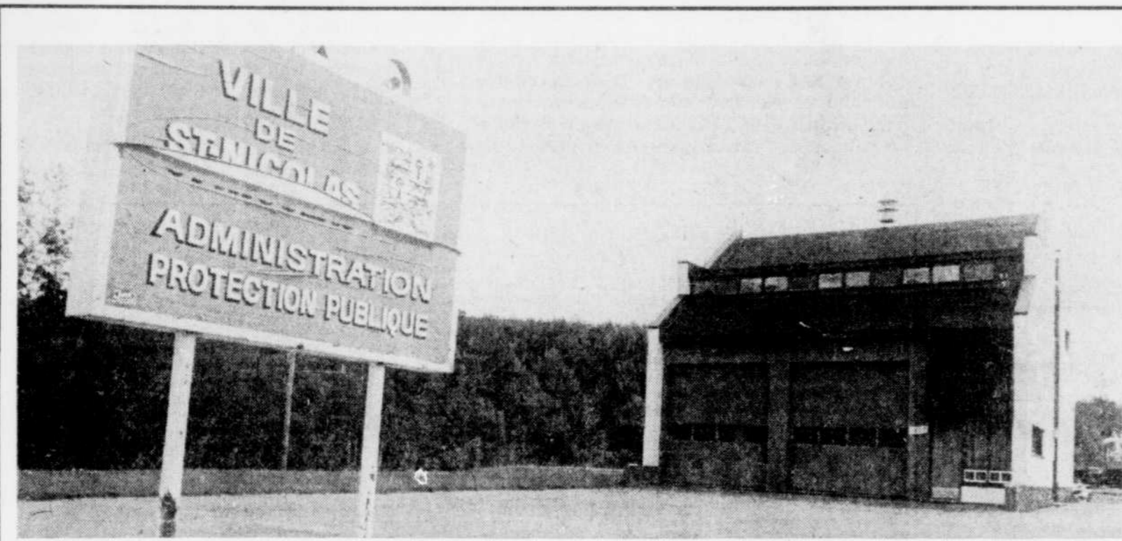
La ville de Saint-Nicolas n'a pas hésité à investir dans des locaux modernes pour la protection publique. Mais à quoi sert tout cela s'il n'y a personne