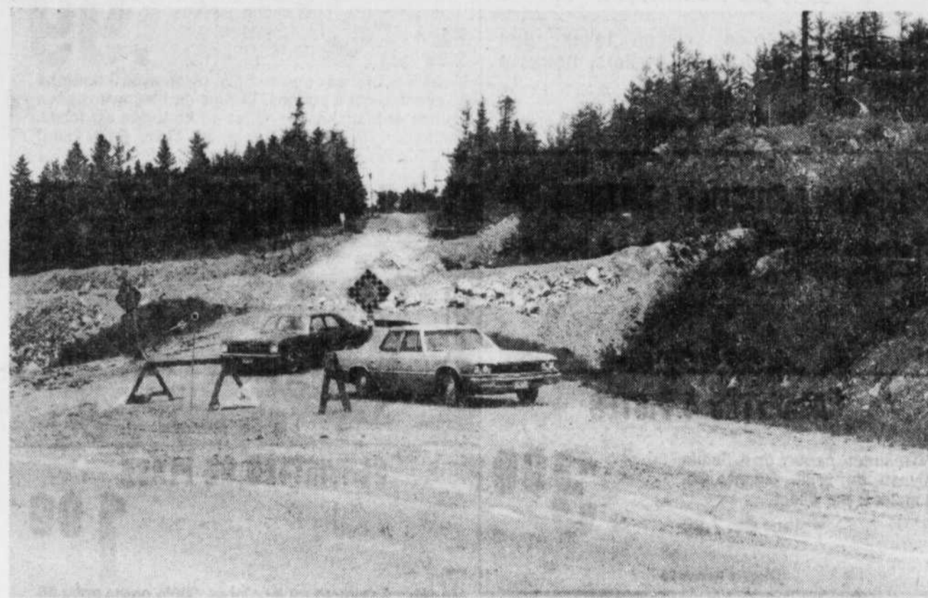
La route 112 A à Black Lake, qui devait être réouverte à la circulation à cette période-ci, sera fermée jusqu'à la fin

Cependant, des subventions très substantielles devront être obtenues puisque la municipalité ne compte qu'environ 1,000 usagers du service d'aqueduc et d'égouts. Selon le secrétaire-trésorier, M. Bernadin Haman, il serait très difficile d'effectuer les dits travaux si l'octroi gouvernemental n'est pas de l'ordre de $2,3 millions. C'est donc dire que le ministère des Affaires municipales devrait défrayer 88.4 pour 100 du coût des travaux pour satisfaire aux besoins des citoyens de la municipalité de St-Méthode.