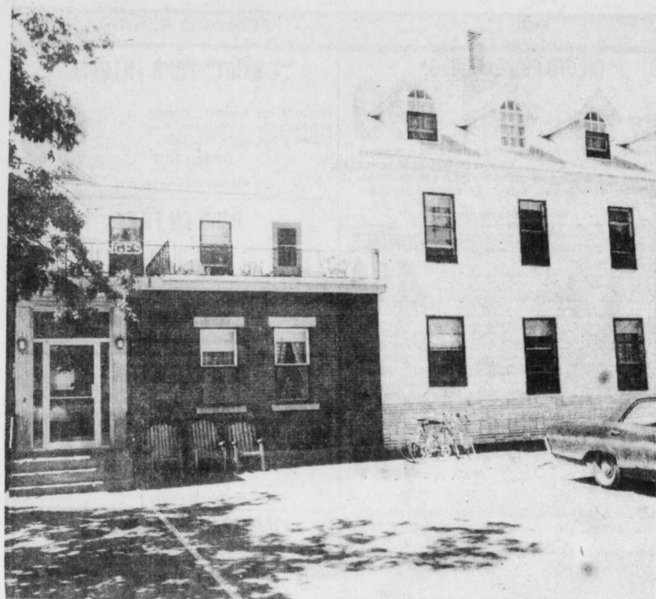
Le foyer des Sts-Ange, à Ham-nord, abrite actuellement 28 personnes âgées. Le propriétaire et la population demandent au ministère des Affaires sociales l'autorisation

La dette totale de la ville était donc de $16,792,741 et la dette totale per capita (basée sur l'ancienne évaluation) $680. Le pourcentage de la dette par rapport à l'évaluation imposable était de 18.28 pour cent.