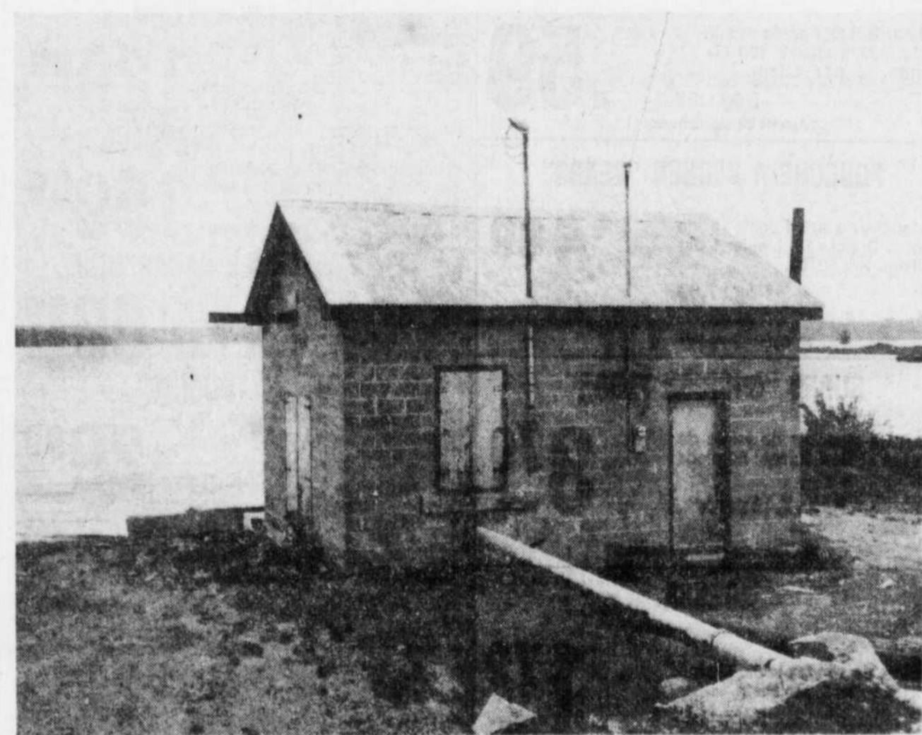
On saura, au cours des jours qui suivront, si la ville de Black Lake entamera des poursuites judiciaires contre un de ses citoyens qui se construit une résidence d'été sur les

confié le tout aux avocats-conseils de la ville qui étudient actuellement la possibilité d'une poursuite judiciaire.