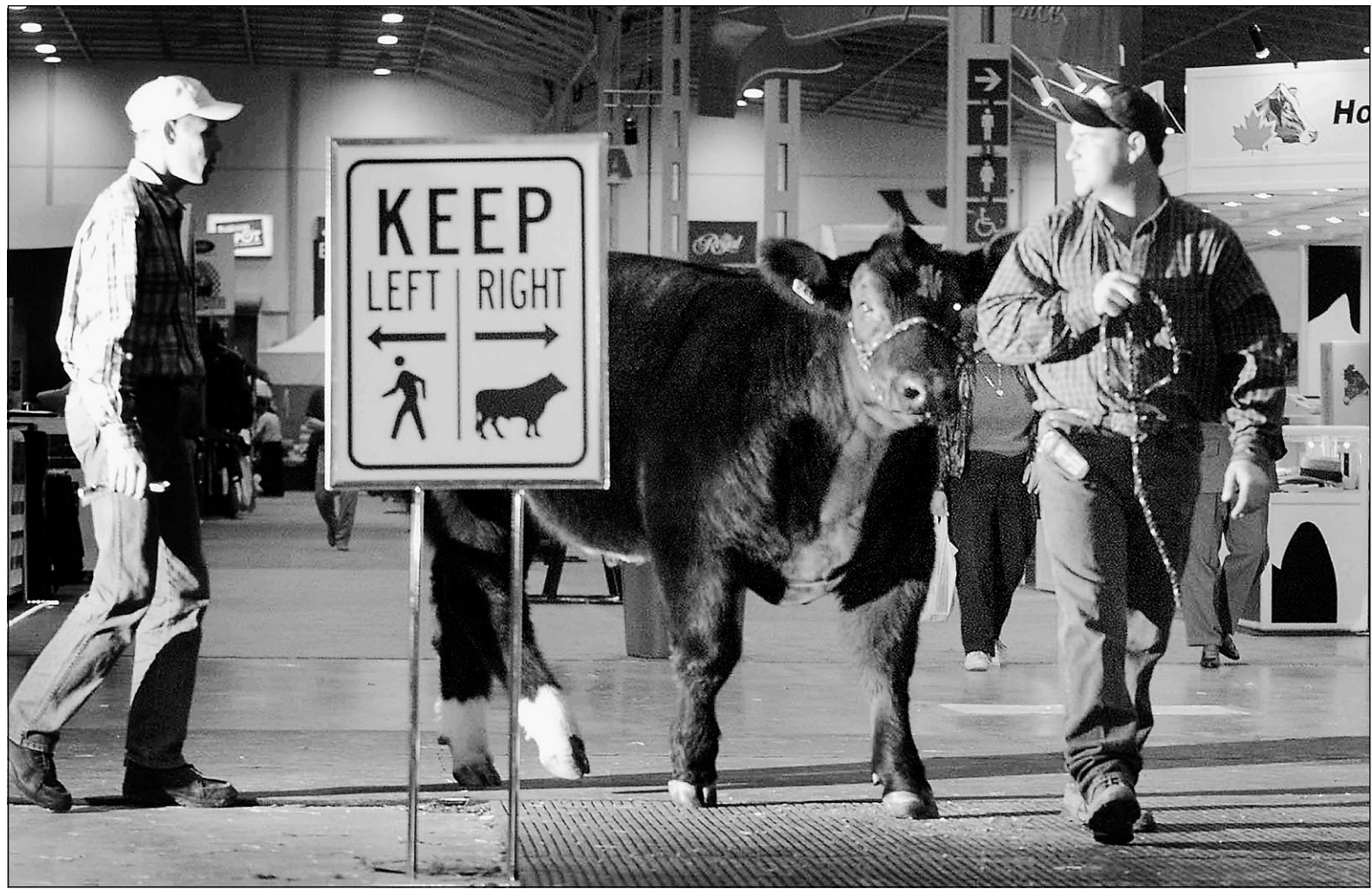
En 2000, Montréal a perdu au moins 21 nouveaux événements faute d'espace pour les recevoir. Actuellement, 2,75 millions de pieds carrés de surface d'exposition sont disponibles au Canada, dont 1,4 million de pieds carrés à Toronto seulement. On aperçoit ci-dessus quelques-uns des « participants » d'une foire hivernale qui se déroulait dans la Ville reine.

À l'extérieur du Québec, on a rapidement compris l'importan-