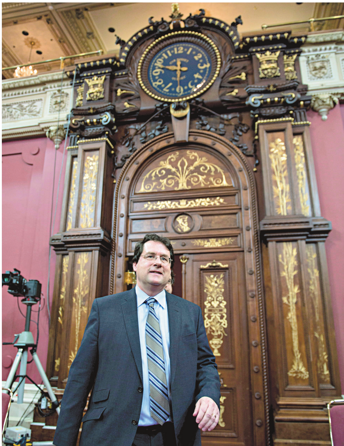
Le ministre Bernard Drainville à son arrivée jeudi à la commission.

Cette semaine, The National Post rapportait que la Commission des droits de la personne de la Nouvelle-Écosse avait avalisé un accommodement accordé à un homme de confession musulmane qui ne voulait pas entrer en contact avec des femmes. Dans une classe d'aïkido, un sport de combat, l'instructeur, à la demande du musulman, avait séparé le groupe en deux, les femmes d'un côté et les hommes de l'autre, pour éviter tout contact entre eux. L'homme avait aussi refusé de serrer la main des participantes à la fin de l'exercice, comme c'est l'usage. La plainte d'une jeune femme, qui s'était sentie humiliée et traitée comme « une citoyenne de deuxième ordre », a été rejetée. C'est ça, l'état du droit au Canada.