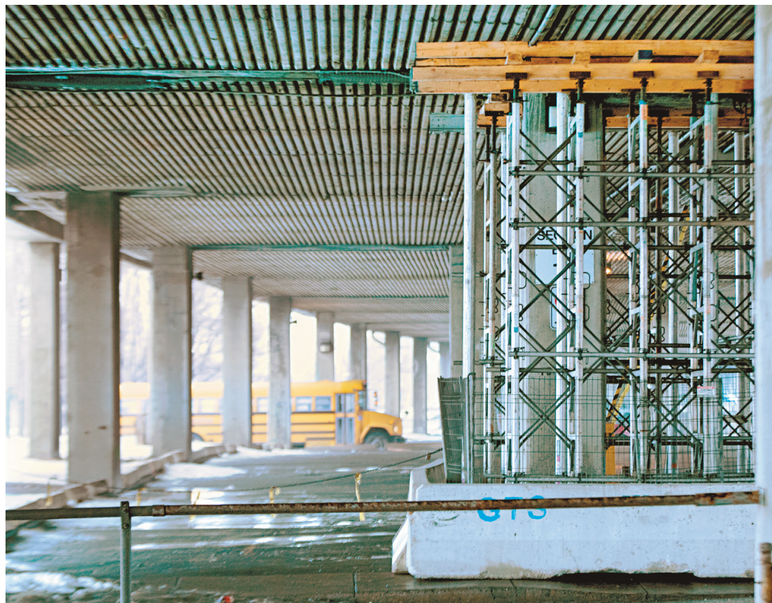
MICHAËL MONNIER LE DEVOIR

Un expert souhaite que de nouveaux bétons soient utilisés dans les infrastructures à construire.