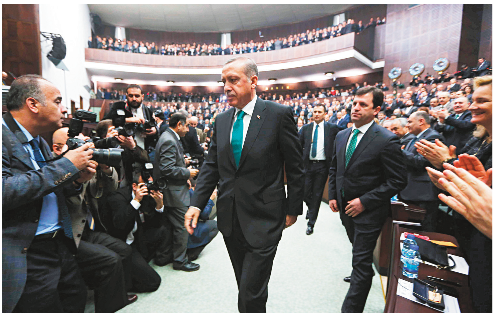
Recep Tayyip Erdogan à son arrivée au parlement la semaine dernière pour y prononcer un discours sur le contentieux avec les juges.

Rien de tout cela n'arrive encore à susciter un véritable sursaut d'indignation populaire, ce dont le gouvernement tire parti. Il sait qu'une partie de la population ne se soucie que de son portefeuille et de ses intérêts particuliers. Tant qu'il lui offre des baisses d'impôt, elle est contente et se fiche du reste. C'est d'ailleurs cette attitude qui, poussée à son extrême, mène à un phénomène comme la popularité quasi inébranlable de Rob Ford à Toronto.