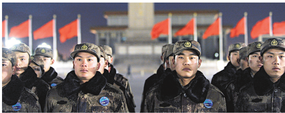
Le budget de l'armée chinoise ne cesse d'augmenter.

En Chine, selon une longue enquête publiée le mois dernier par l'agence Reuters, la plupart