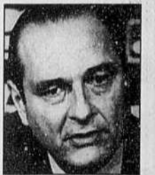
Les sondages donnent 23,5% des intentions de vote à Chirac, contre 20% pour ses deux adversaires.

Qui affrontera le candidat de droite Jacques Chirac au second tour des élections françaises? C'est la principale question que l'on se pose à Paris à la veille du premier tour des présidentielles qui aura lieu dimanche. Car, si le maire de Paris Jacques Chirac est donné gagnant, rien n'est joué entre le premier ministre Édouard Balladur et le socialiste Lionel Jospin.