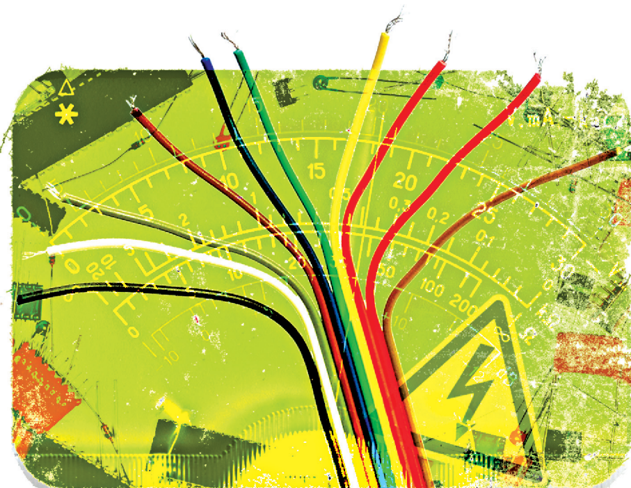
ILLUSTRATION DANIEL RIOPEL, LA PRESSE

L'électricité se porte bien au Québec. L'activité est en croissance dans ce secteur depuis plus de 10 ans, à l'exception d'une légère baisse lors de la crise économique de 2009. Et les prochaines années ne feront pas exception, puisque l'industrie de la construction aura besoin de 700 à 1000 nouveaux électriciens par an.