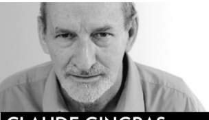
CLAUDE GINGRAS MUSIQUE

Bien qu'il n'entrepreneur qu'en septembre 2006 sa première saison comme nouveau titulaire de l'Orchestre Symphonique de Montréal et bien qu'il ne dirige que deux concerts cette saison, et seulement fin mars et début avril — étant présent comme simple auditeur à l'ouverture de la saison, le 21 septembre —, Kent Nagano y remplit déjà ses fonctions de directeur artistique.