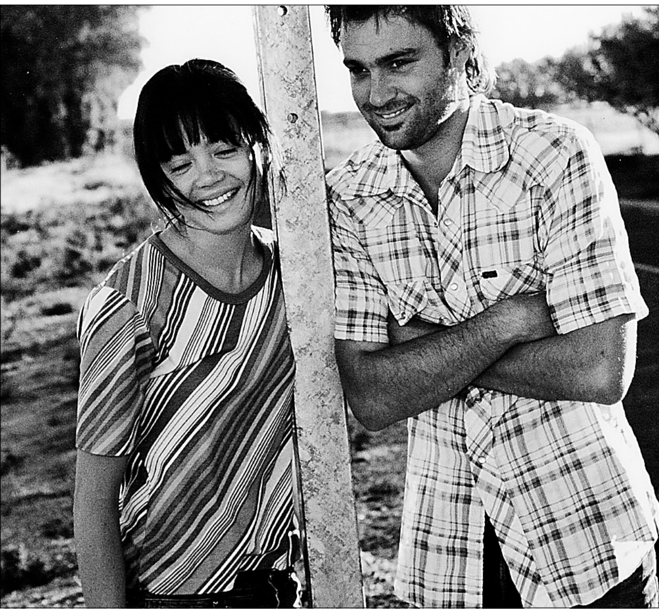
Dans Peaches , Steph est jouée par l'actrice aux traits eurasiens Emma Lung.