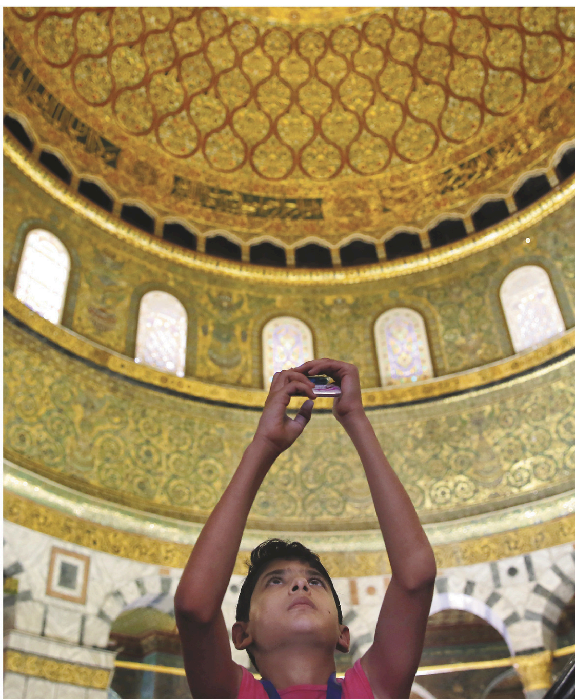
Un jeune garçon palestinien prend une photo du dôme du Rocher, une mosquée située sur l'esplanade des Mosquées à Jérusalem, troisième lieu saint de l'islam.