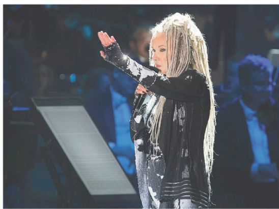
Diane Dufresne a interprété L'hymne à la beauté du monde lors de Montréal symphonique.

Tout est permis, en fait. Un arrangement qui allie Un jour, un jour (de Stéphane Venne, thème d'Expo 67) et Deux par deux rassemblés (l'imparable de Pierre Lapointe). Notez le lien façon Monique: un, un, deux, deux. Lapointe, dans un habit à bandelettes de couleurs, se dandine sur la flèche. Les multitudes et le symphonique ne l'intimident pas: il s'en nourrit, tête haute. Bonne chance pour suivre ça. Changement de ton: du slam symphonique. DJ Champion avec M-Mo.