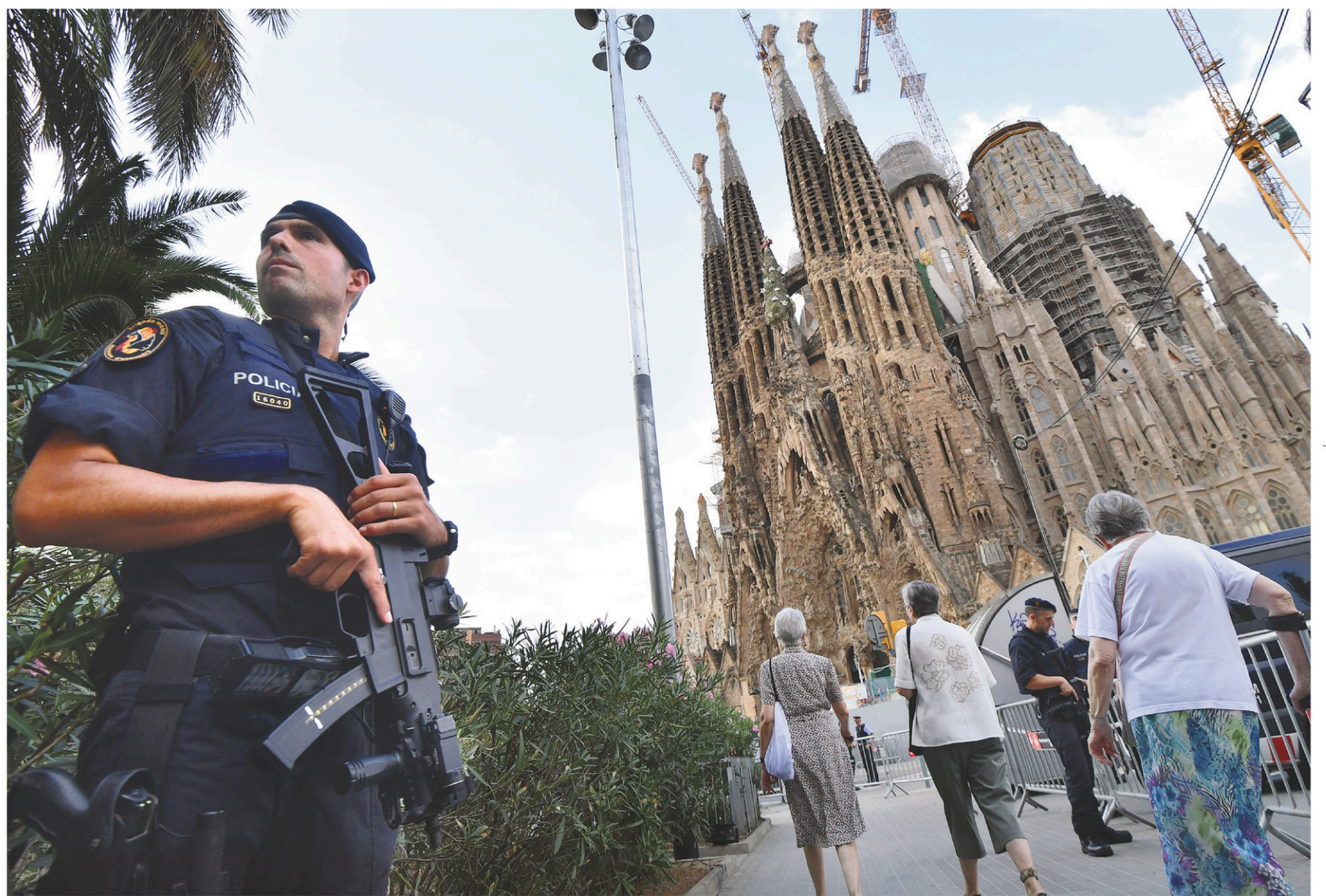
Près de 2000 personnes ont assisté à la « messe pour la paix et la concorde » organisée dans l'emblématique basilique de la Sagrada Família à Barcelone, dimanche, sous haute surveillance policière.