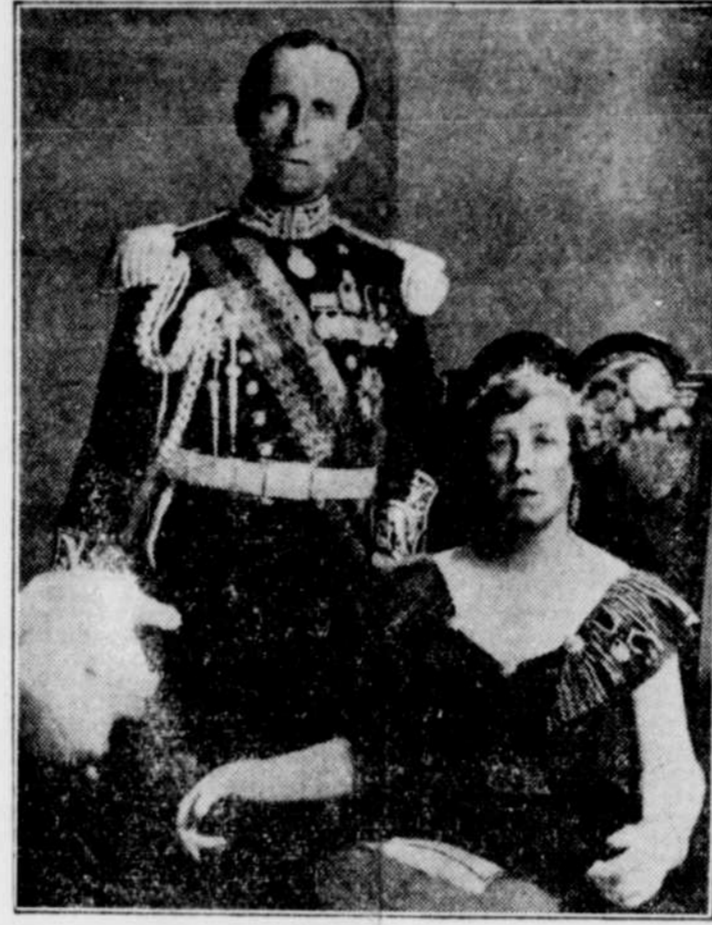
Lord et Lady TWEEDSMUIR qui visiteront Sherbrooke les 2 et 3 mars.

A leur arrivée à Sherbrooke, les visiteurs seront reçus par Son Honneur le maire Bradley et les citoyens qui se rendront à la gare pour les saluer.