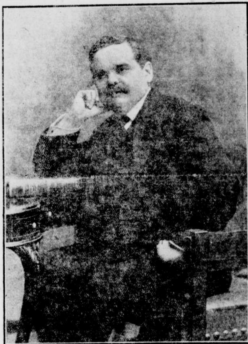
SIR LOMER GOUIN, premier ministre de la province, élu sans opposition député de Portneuf.

Rome, 16. (Spéciale.) — Le cabinet a promulgué, aujourd'hui, un ordre prohibant l'importation d'articles de luxe et de certains autres articles qui ne sont pas de première nécessité comme les pianos et les meubles.