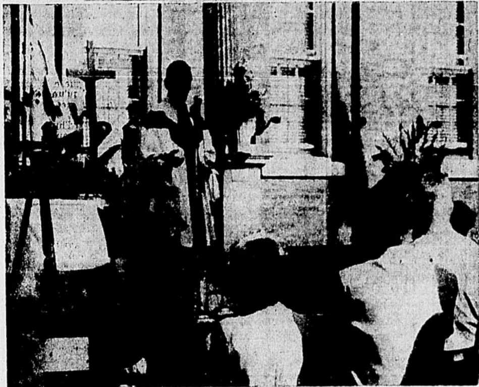
Mgr Arthur Douville célébrait une messe en plein air à l'intention des travailleurs de Saint-Hyacinthe, lundi matin sur la terrasse de la Cathédrale. Il prononça aussi le sermon de circonstance devant quelque 500 fidèles réunis à cette occasion.