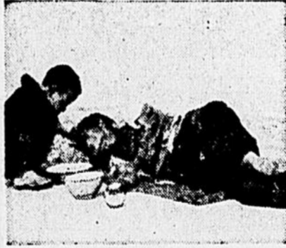
En Afrique et en Asie sévit une tuberculose massive, partout nous trouvons la lèpre que nous ne connaissons plus que de nom chez nous.