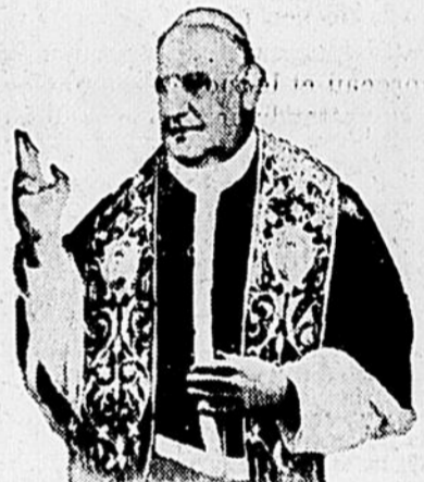
"Que tous s'emploient donc, selon leurs moyens à assurer un sort meilleur à leurs frères malheureux..." — Jean XXIII