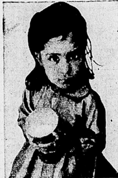
Un milliard et demi d'hommes meurent de la faim sur le globe, et beaucoup d'autres vivent à peine normalement.