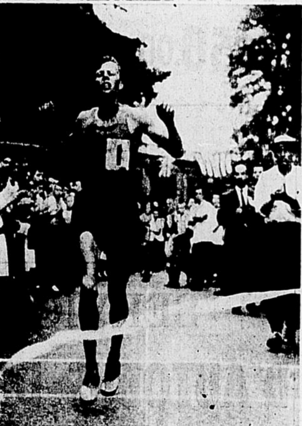
JOHNNY KELLEY, le vainqueur du marathon de Saint-Hyacinthe, l'an dernier, s'est de nouveau affirmé dans le domaine de la course à pied en remportant les honneurs du marathon des jeux Pan-américains, à Chicago. Le gagnant de Boston en 1957, sera l'une des principales figures du parcours Saint-Hyacinthe, le 11 octobre.