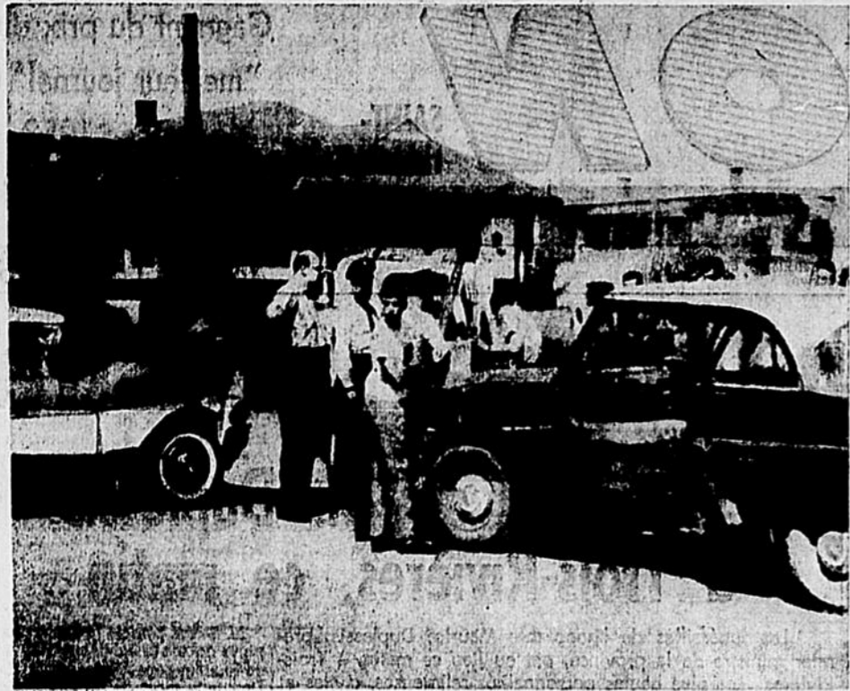
Une violente collision survenue à l'intersection des rues Bourassa et Saint-Joseph, a fait trois blessés, hier après-midi. L'un des conducteurs, M. Léon Brien, de Sainte-Madeleine, fut assez gravement blessé. On évalue les dommages matériels à $1,500 environ.