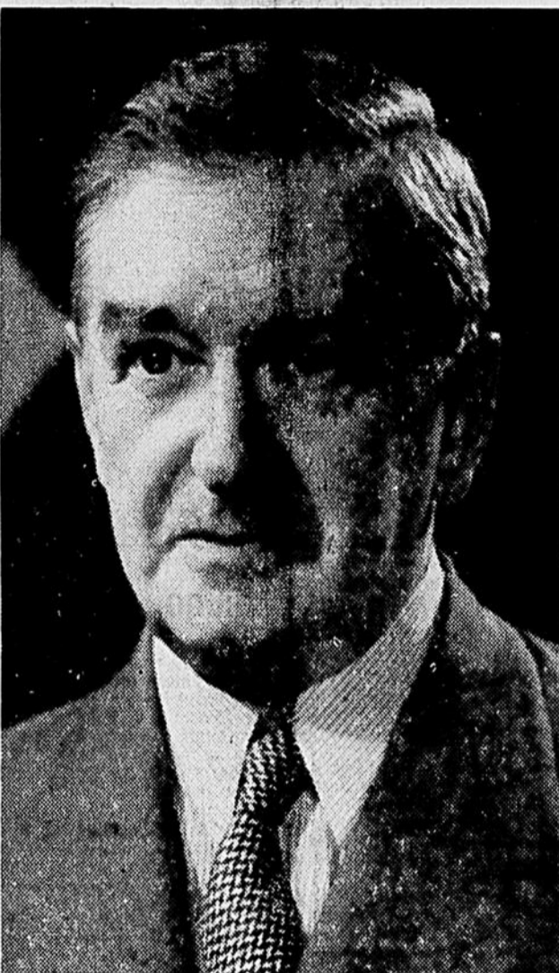
M. MAURICE DUPLESSIS