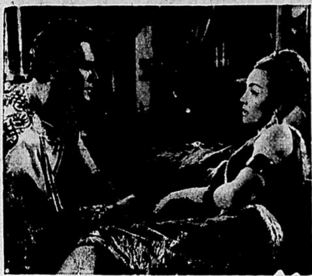
Étore Manni et Gianna-Maria Canale, dans une scène de la superproduction en Cinemascope et en couleurs "La Révolte des Gladiateurs" qui est gardée à l'affiche, pour une deuxième semaine, au cinéma "Le Paris". Au même programme: "La Danseuse de Cadix".

Participez à notre nouveau système de timbres. Avec chaque achat de $1.00 nous donnons un timbre gratuit et quand votre livret est rempli, nous vous remettons la somme de $5.00 en argent ou en valeurs.