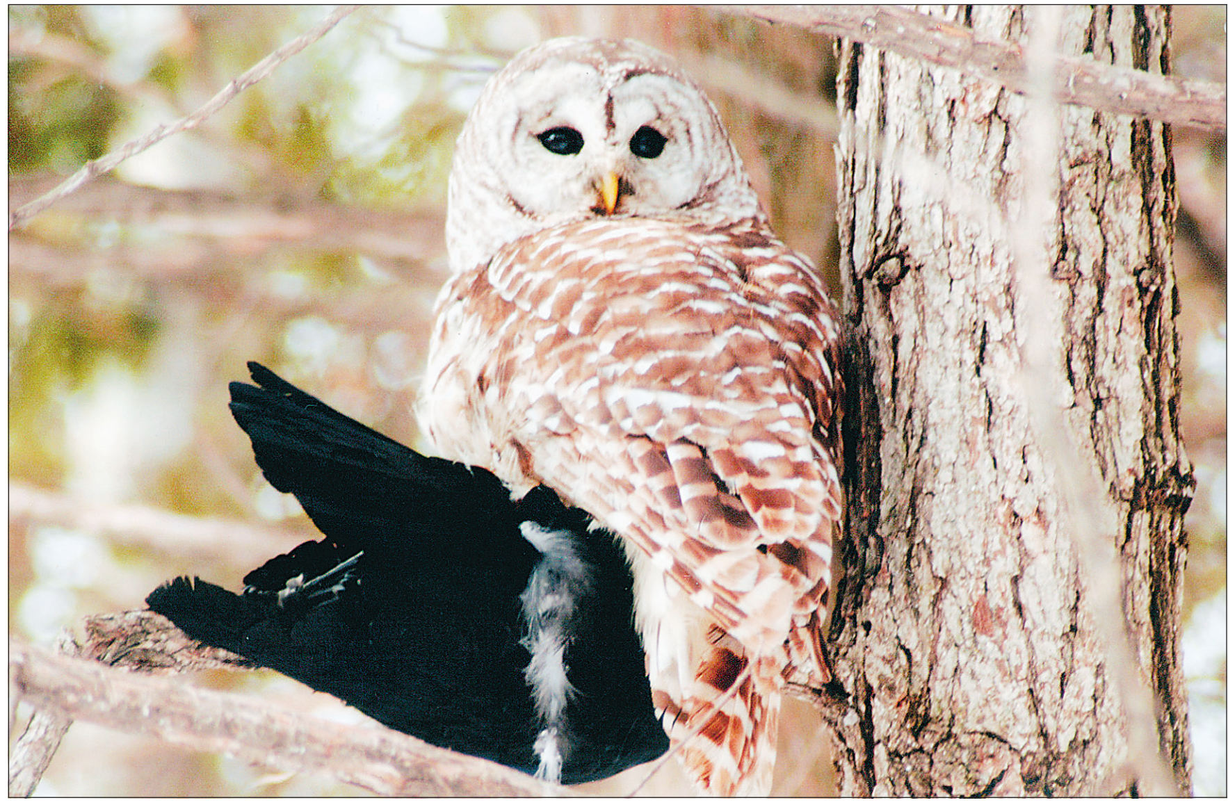
Si les relations entre les corneilles et les grands-ducs sont toujours houleuses, les scientifiques restent muets sur les cas de harcèlement de la chouette rayée par les gros oiseaux noirs. Par contre, ce qui est évident, c'est que la corneille fait partie du menu régulier de la chouette, comme en fait foi cette photo inusitée de Louise Goulet soumise au concours Le Biodôme-La Presse.

En réalité, une foule d'espèces s'adonnent au harcèlement, du petit roitelet jusqu'aux goélands en passant par les bruants, vachers, hirondelles, pics, parulines et bien d'autres. Cette semaine, j'ai vu plusieurs hirondelles noires (photo à la une du cahier PLUS) poursuivre un gros rapace en trissant sans relâche. Une audace qui est souvent le lot des