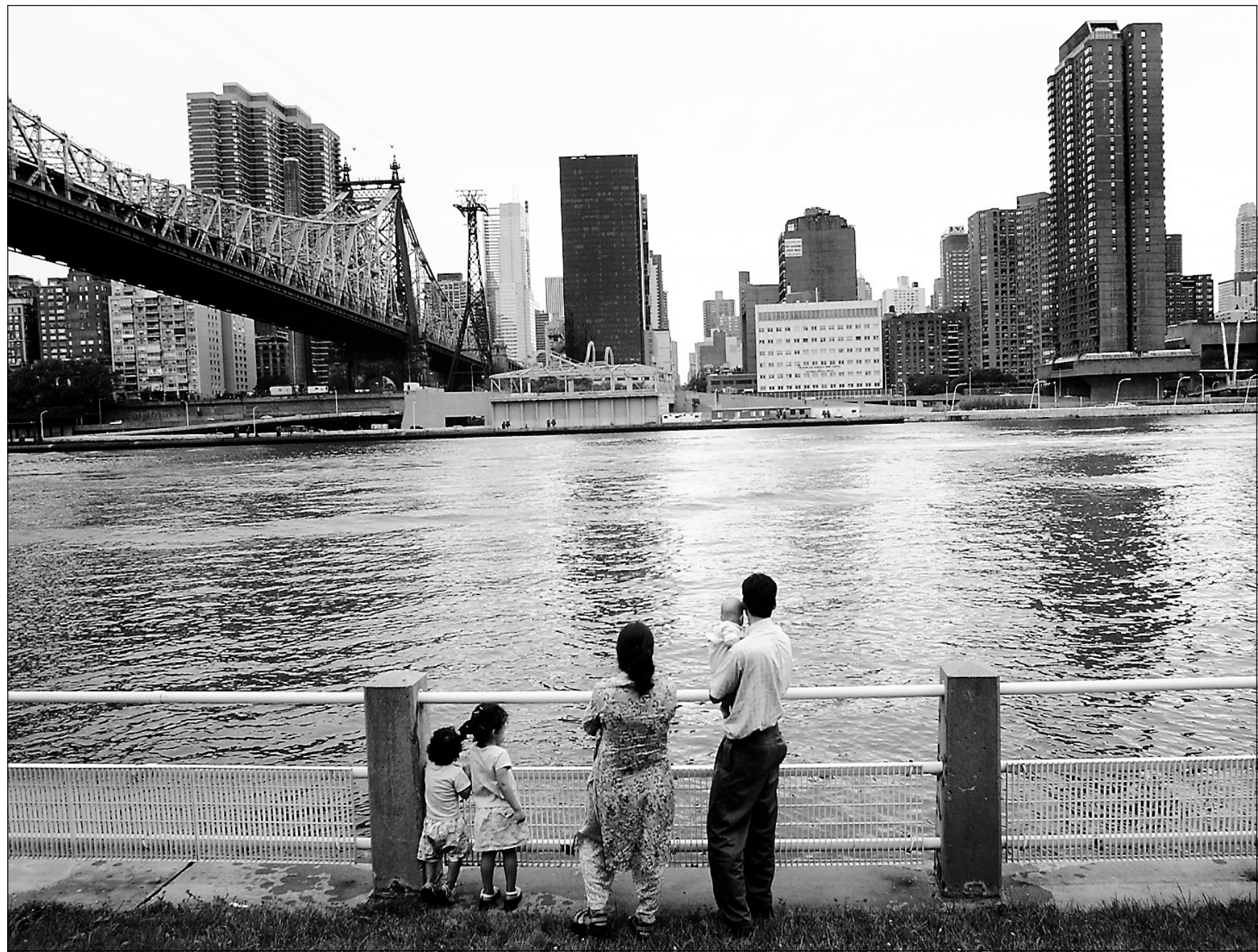
Le 22 juillet, la famille Syed a puisée dans ses économies afin de payer les 120 $US nécessaires pour se rendre à New York.