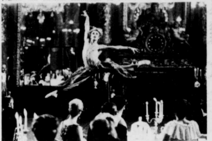
Une scène de "Les uns les autres" que présentera Radio-Québec en mini-série juste après les fêtes.

vements de danse es-toutes les nuances et du Gloria, du Sactus, pagnole fait ressortir sentiments du Credo, de l'Agnus Dei.