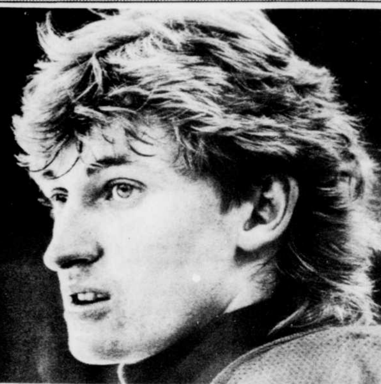
Wayne Gretzky accumule les trophées, mais il aimerait bien trouver une solution à l'énigme "Islanders".

Le trophée Lou Marsh célèbre la mémoire d'un ancien journaliste sportif du Toronto Star. Les lecteurs soumettent des noms d'athlètes et un comité de sélection de sept membres, incluant cinq journalistes, détermine le vainqueur.