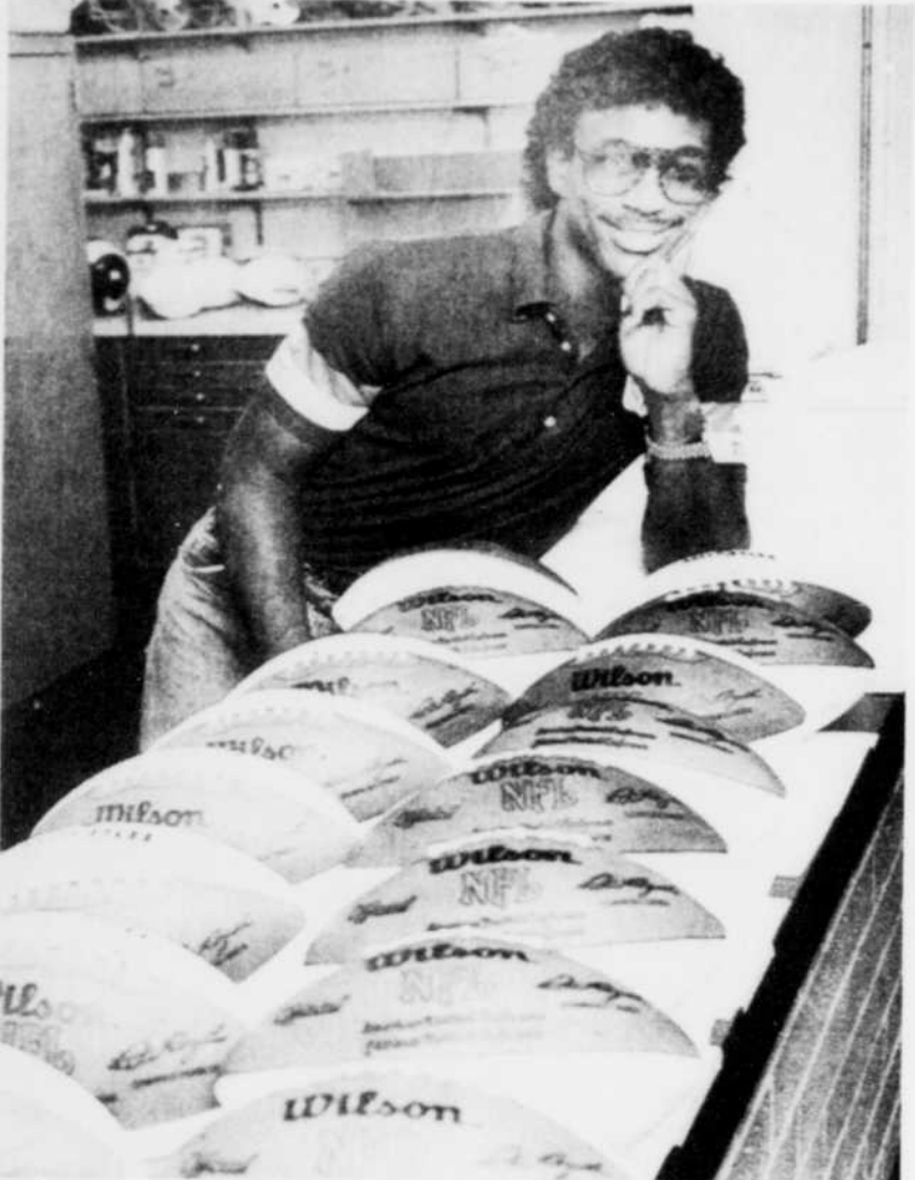
C'était la journée des bonnes nouvelles pour Eric Dickerson.

NEW YORK (AP) — Eric Dickerson, le porteur de ballon qui a inscrit toutes sortes de records et qui a permis aux Rams de Los Angeles de se qualifier pour les séries éliminatoires, a été choisi hier la recrue offensive par excellence dans la Ligue nationale de football.