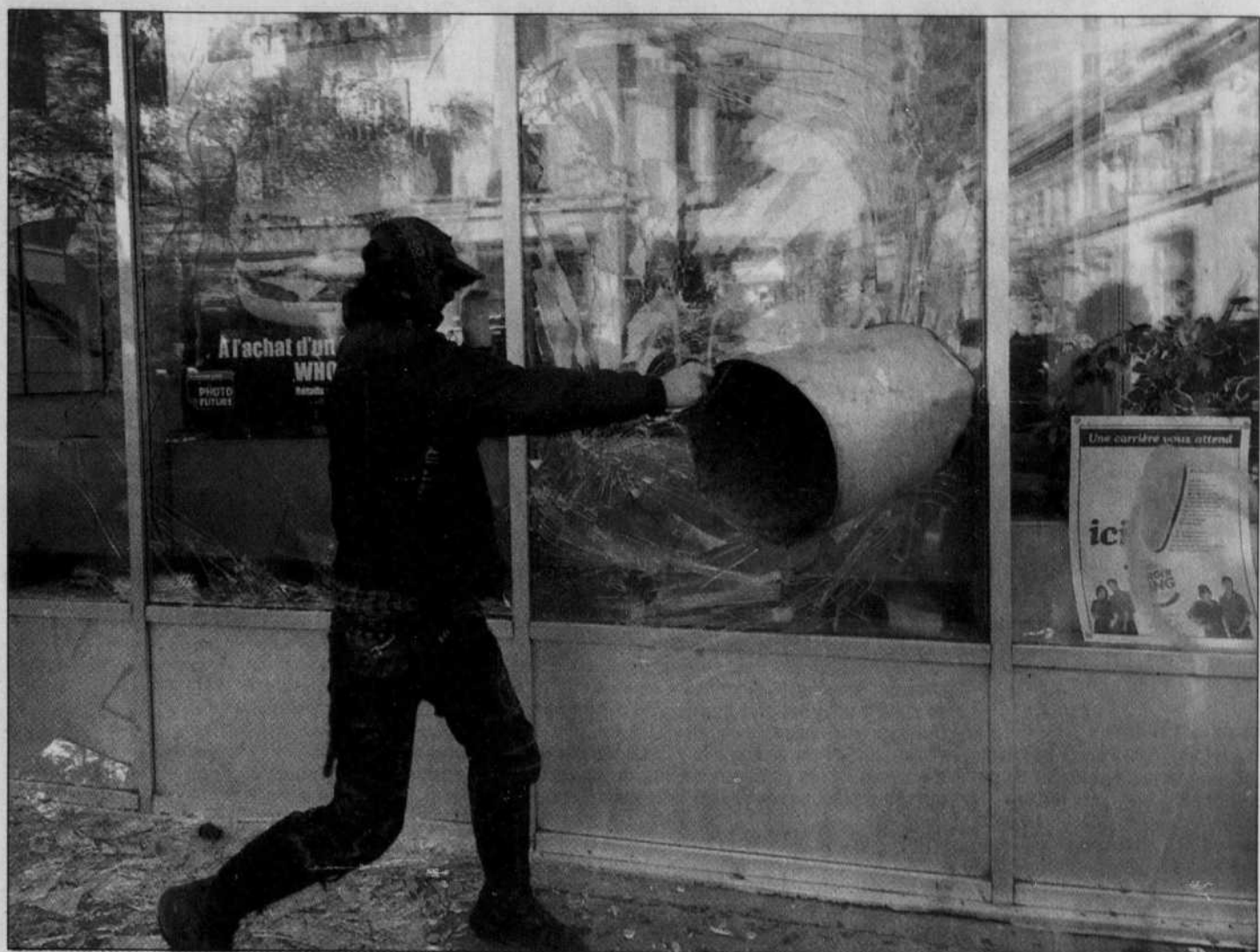
Défilé anti-mondialisation à grands coups de poubelle dans la vitrine d'un Burger King, rue Sainte-Catherine.