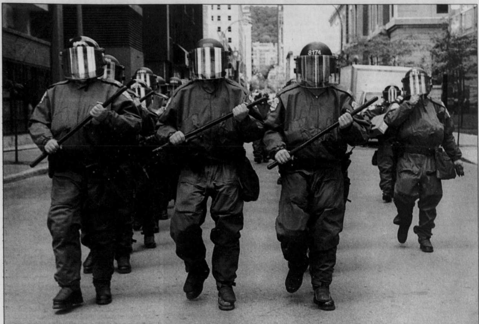
Une escouade policière déployée hier au centre-ville de Montréal.