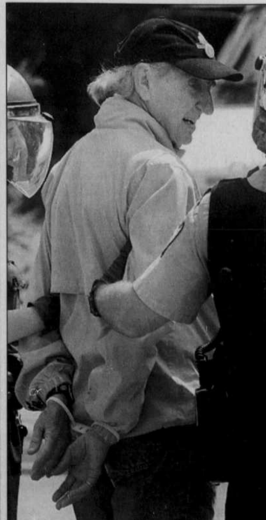
Ce manifestant d'un certain âge est accompagné par deux policières.

Près de 80 % de tous les véhicules neufs circulant sur les routes au Canada sont déjà équipés de dispositifs d'immobilisation antivol. Grâce à ces dispositifs, les voleurs ne peuvent démarrer le moteur et s'enfuir avec le véhicule.