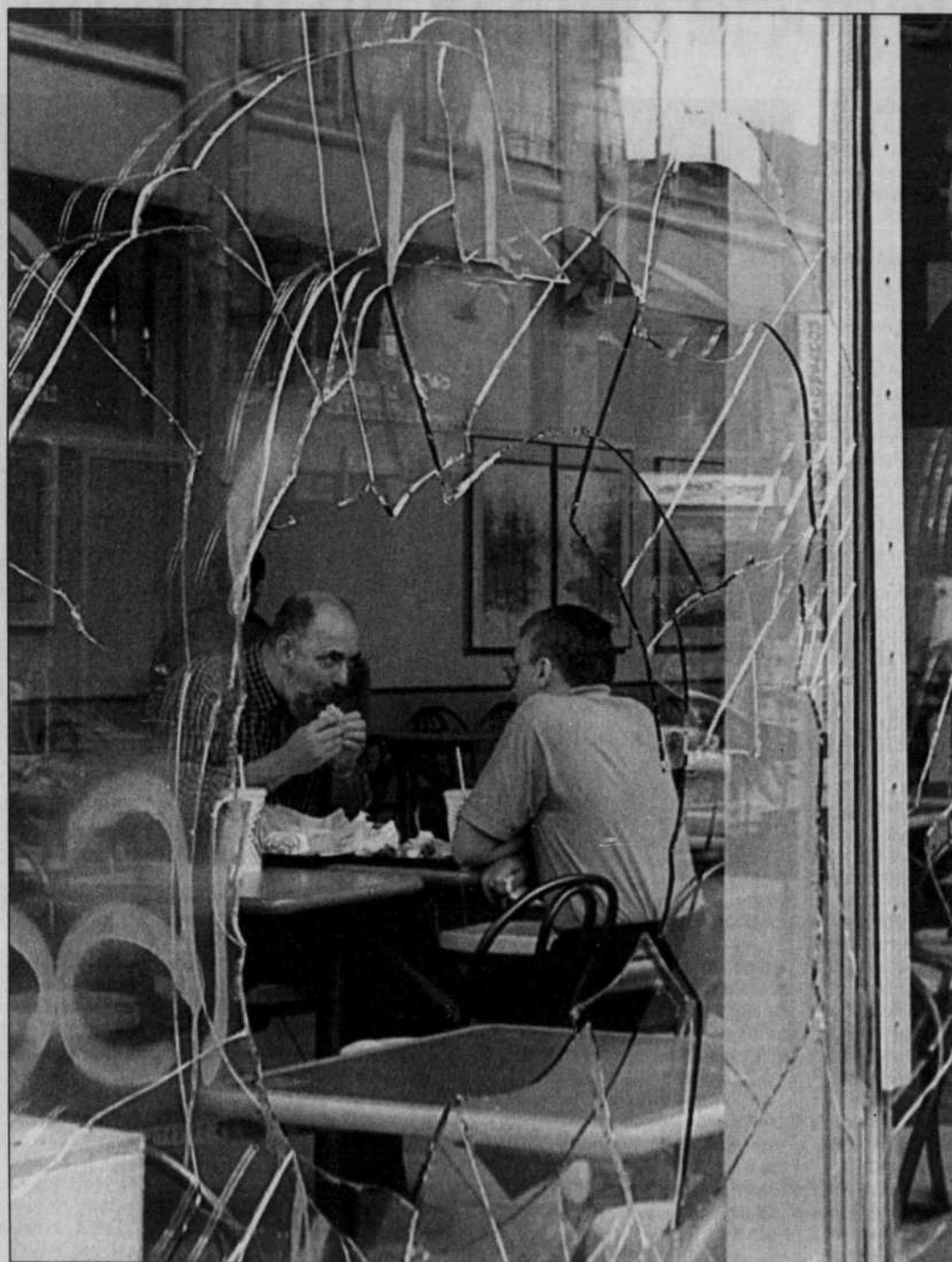
Le mal fait, Burger King, rue Sainte-Catherine, a continué à vendre ses hamburgers.

Le Devoir est publié du lundi au samedi par Le Devoir Inc. dont le siège social est situé au 2050, rue De Bleury, 9 e étage, Montréal, Québec, H3A 3M9. Il est imprimé par Imprimerie Québec St-Jean, 800, boulevard Industriel, Saint-Jean-sur-Richelieu, division de Imprimeries Québec Inc., 612, rue Saint-Jacques Ouest, Montréal. L'Agence Presse Canadienne est autorisée à employer et à diffuser les informations publiées dans Le Devoir . Le Devoir est distribué par Messageries Dynamiques, division du Groupe Québec Inc., 900, boulevard Saint-Martin Ouest, Laval. Envoi de publication — Enregistrement n° 088. Dépôt légal: Bibliothèque nationale du Québec.