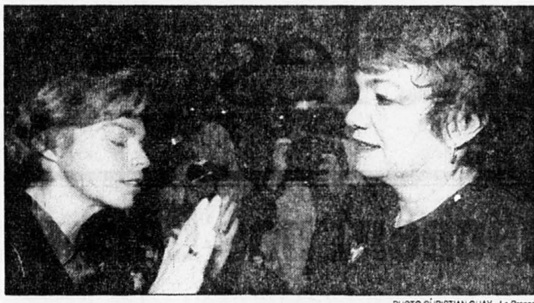
La ministre du Patrimoine canadien, Sheila Copps (à droite), et la ministre de la Culture et des Communications, Louise Beaudoin.

Pour madame Beaudoin, l'entente Bacon-Valenti des années 80 qui allait favoriser le doublage au Québec des films américains a eu un effet pervers qui se fait de plus en