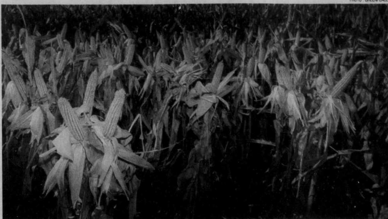
Au Canada, plus du tiers des plants de maïs cultivés sont génétiquement modifiés.

Une récente étude du gouvernement britannique démontre que l'utilisation de semences génétiquement modifiées (GM) engendre une sérieuse dégradation de la biodiversité. Un peu partout au Canada, des scientifiques, agriculteurs et groupes écologiques reprochent au gouvernement fédéral d'approuver leur utilisation, alors qu'aucune étude sérieuse n'a été menée sur les conséquences d'une telle pratique pour l'environnement.