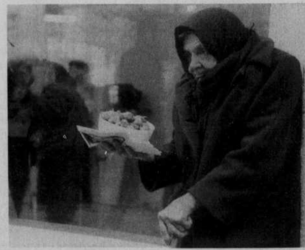
Les Géorgiens accusaient le président démissionnaire Chevardnadze d'être responsable de la corruption et la pauvreté qui minent l'ancienne république soviétique.

Toute la région est plongée dans une crise aiguë, accentuée par les conflits territoriaux entre l'Arménie et l'Azerbaïdjan ainsi qu'à l'intérieur même de la Géorgie. Les États-Unis et la Russie, ennemis traditionnels de la défunte guerre froide, exploitent ces conflits et usent de leur influence. Parmi les enjeux, la présence militaire dans la région et le contrôle d'un oléoduc qui devrait relier Bakou, la capitale azérie, au terminal turc de Ceyhan sur la mer méditerranéenne, en passant par la Géorgie.