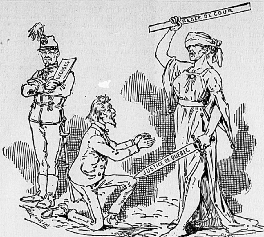
SHEPPARD REÇOIT DES COUPS DE RÈGLE DE COUR.

Si j'avance, tirez-moi. Si je recule, vengez-moi. Si je meurs, suivez-moi.