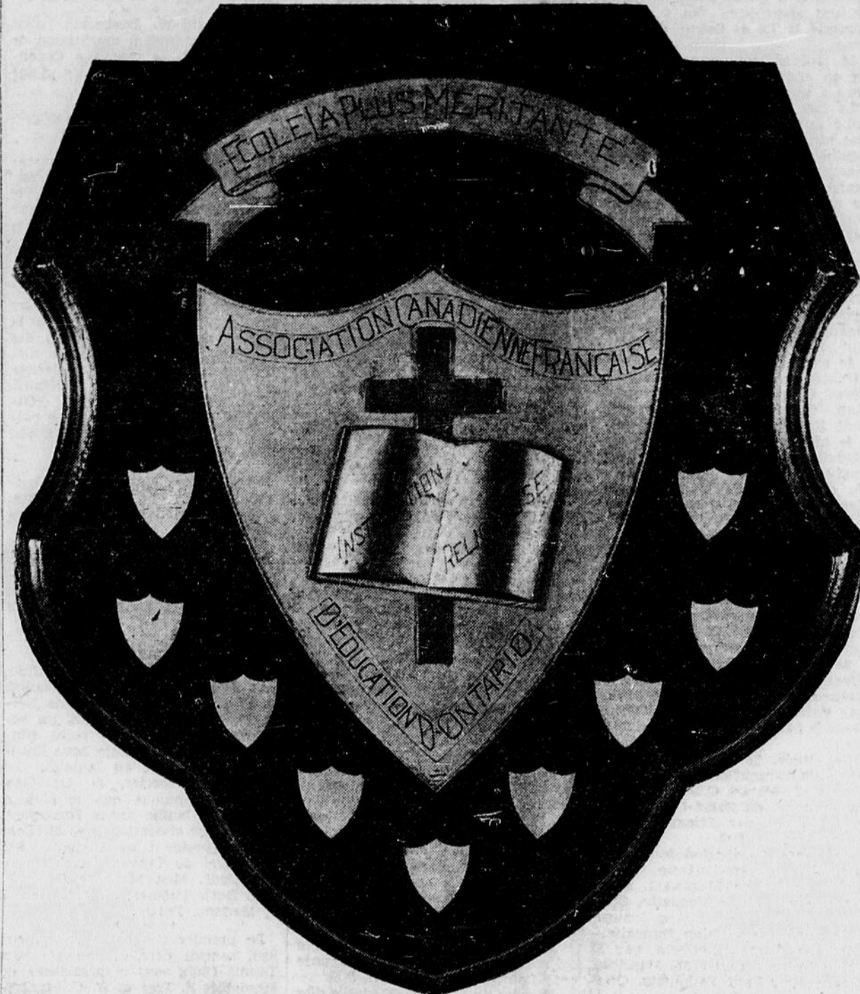
Le trophée d'excellence accordé par l'Association Canadienne-Française d'Éducation de la Province d'Ontario, à l'école la plus méritante en instruction religieuse a été gagné cette année par l'école St-Charles (garçons). Il avait été gagné par la même école, l'an dernier.