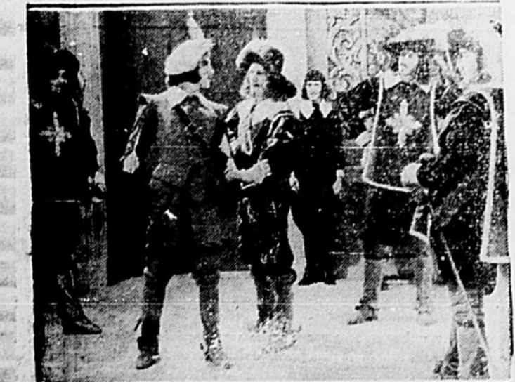
L'adaptation cinématographique de l'oeuvre immortelle d'Alexandre Dumas prend l'affiche samedi au Corona et les deux films s'intitulent "Les Trois Mousquetaires" et "Milady". Sur la photo ci-dessus on reconnaît d'Artagnan dans une scène de ce film.