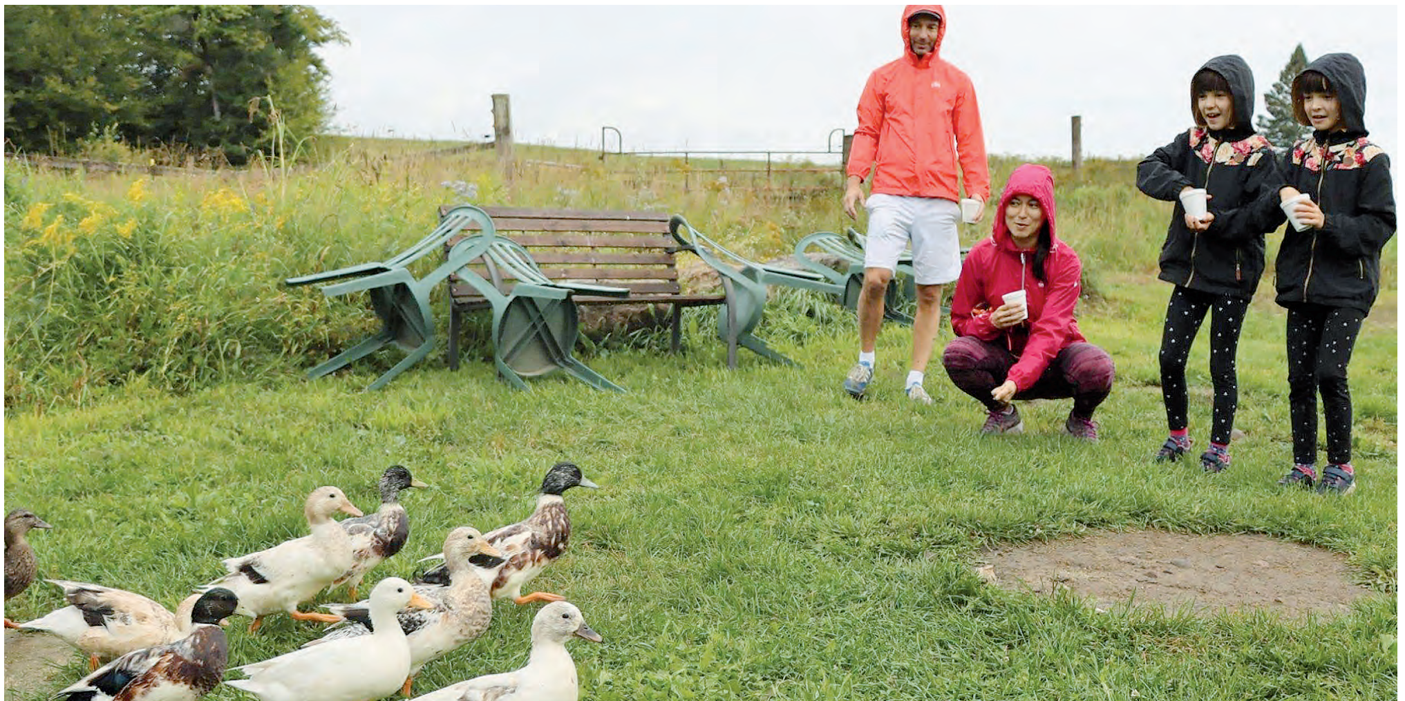
Des visiteurs de tout horizon visitent la ferme Du coq à l'âne.