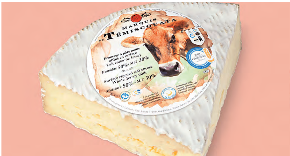
La Fromagerie Marie Kadé de Boisbriand concocte de nombreux fromages dont celui-ci, le Marquis de Témiscouata.