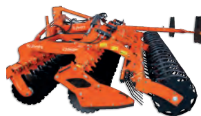
Herses à disques / Série CD

Conçus pour mélanger la terre et les résidus de récolte, les produits Kubota feront de la préparation du champ pour l'ensemencement une partie de plaisir.