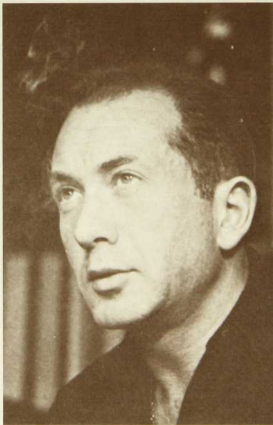
Alexis Weissenberg aux Musiciens par eux-mêmes, p. 2

L'Opéra du Metropolitan: Lucia di Lammermoor de Donizetti p. 12