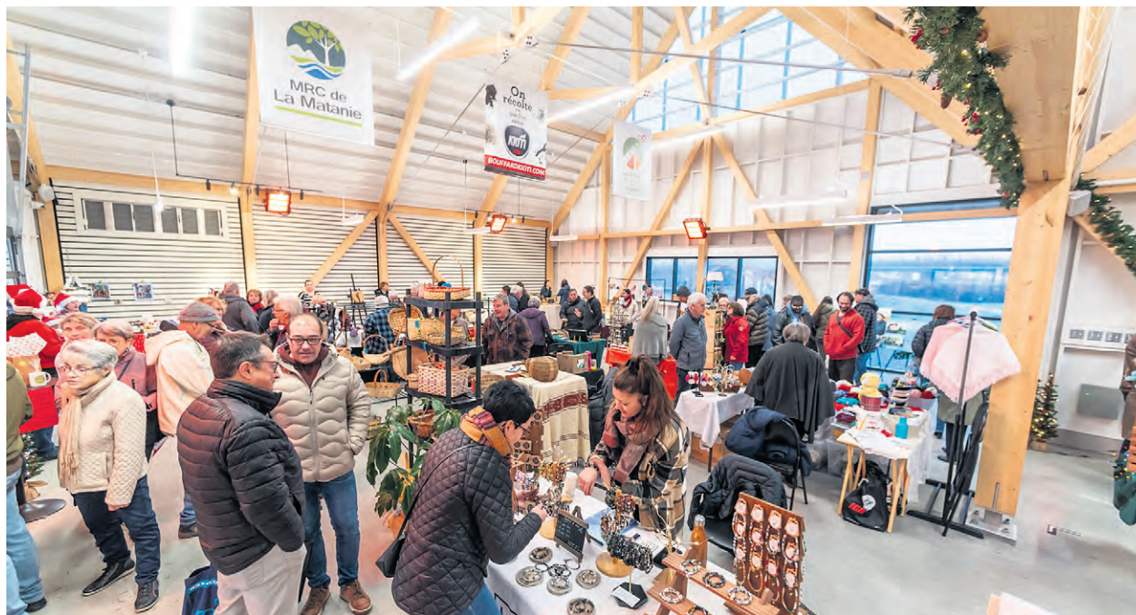
Le Marché public de La Matanie se distingue par la qualité de son concept structural.

Quant au prix pour le concept structural, on tenait à souligner l'excellence en ingénierie et en design architectural. « Ce projet se distingue par une structure simple mais ingénieuse, pensée pour maximiser à la fois la fonctionnalité et l'élégance. Loin d'être un simple support, la structure visible devient une signature architecturale, équilibrant robustesse et légèreté. Chaque détail témoigne d'une ré-