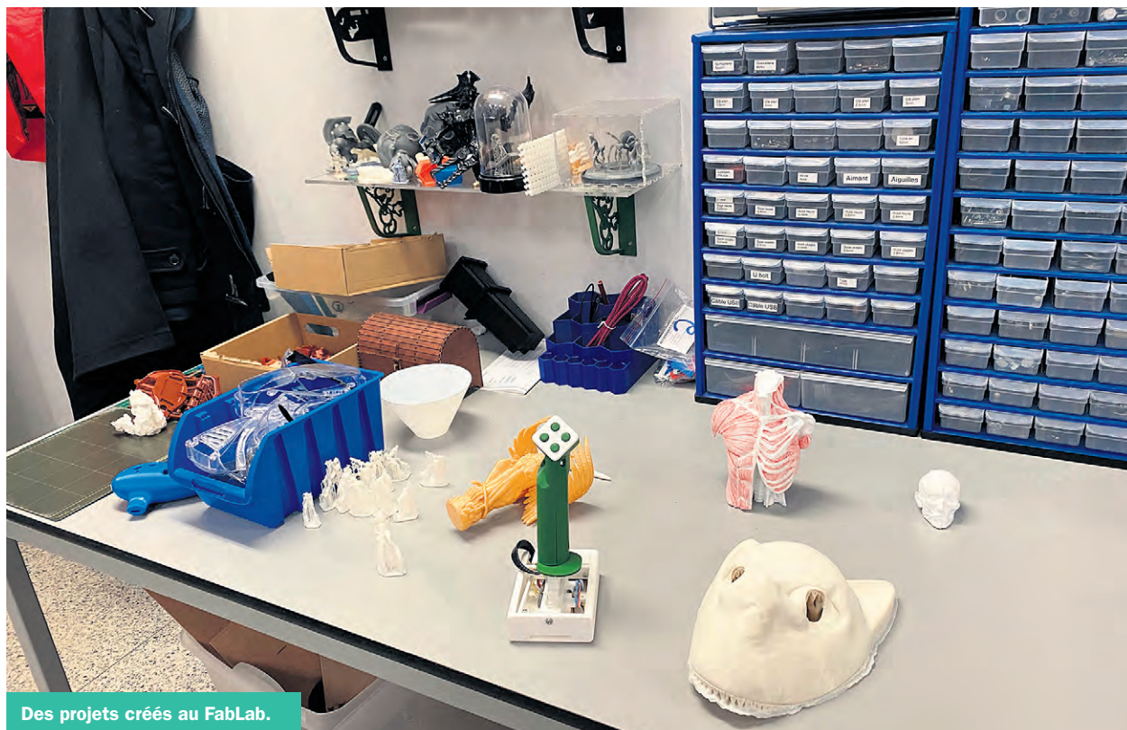
Des projets créés au FabLab.