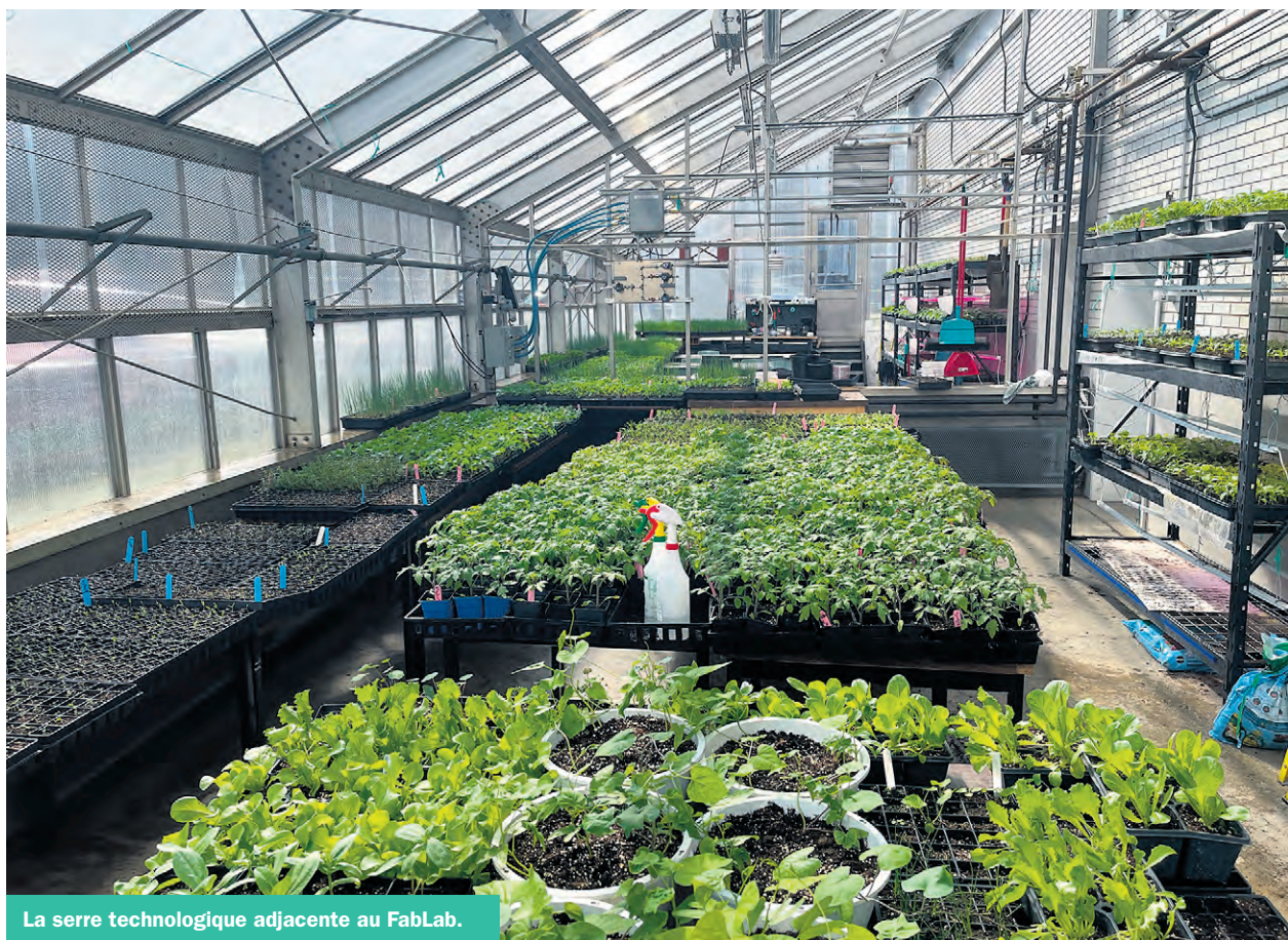
La serre technologique adjacente au FabLab.