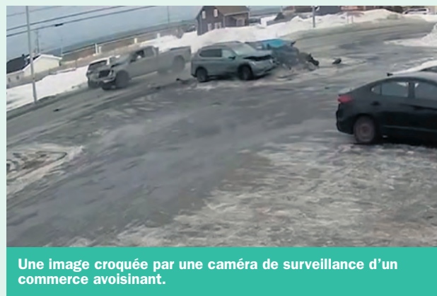
Une image croquée par une caméra de surveillance d'un commerce avoisinant.

C'est à ce moment qu'un véhicule de type Ford F-150, a embouti les deux voitures en avant de lui avant de prendre la fuite. Dans la foulée des événements, une des voitures embouties s'est retrouvée en sens inverse