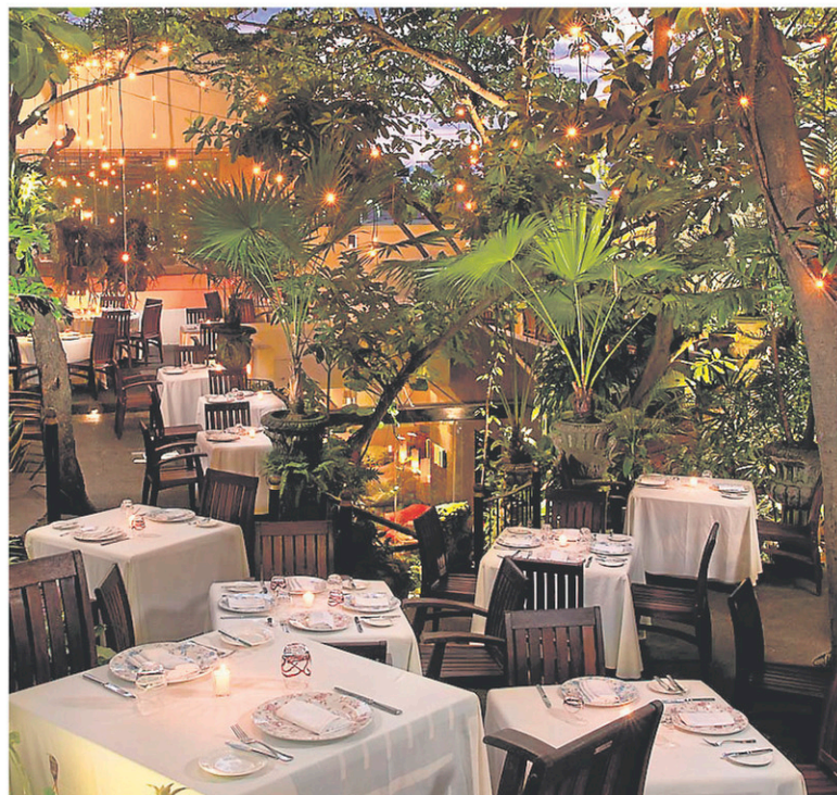
Le Café des artistes

252, calle Mina gabysrestaurant.com.mx (en anglais)