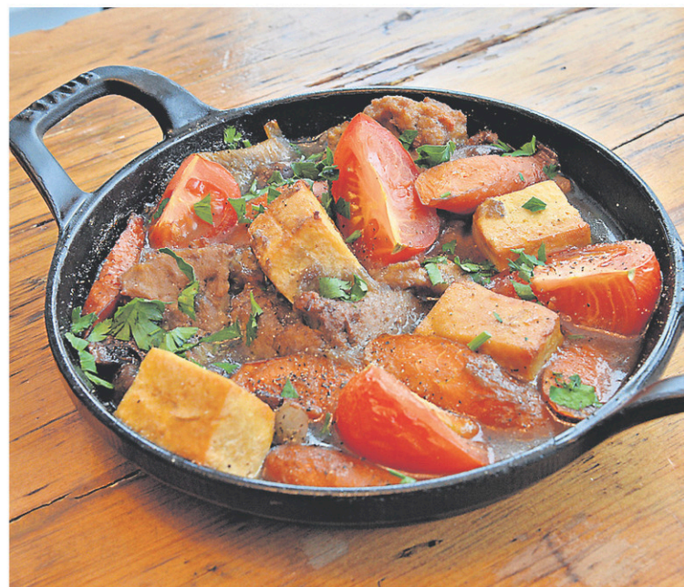
Un « faux bœuf bourguignon ».