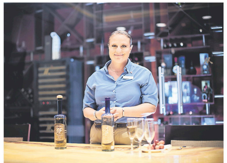
Dégustation de téquila

175, Amapas www.hotelvillamercedes.com/en-gb