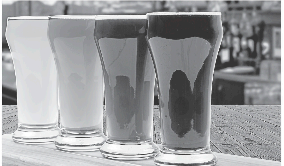
Pendant la fermentation, la levure va libérer différents arômes tels que des esters et des phénols. C'est en partie ces arômes qui vont donner le caractère à la bière. Bien entendu, il faut tenir compte des arômes provenant des autres matières premières également.

Vous avez déjà sûrement dû entendre que la lager est très souvent blonde et que l'ale est plus forte que la lager. C'est vrai, mais c'est aussi