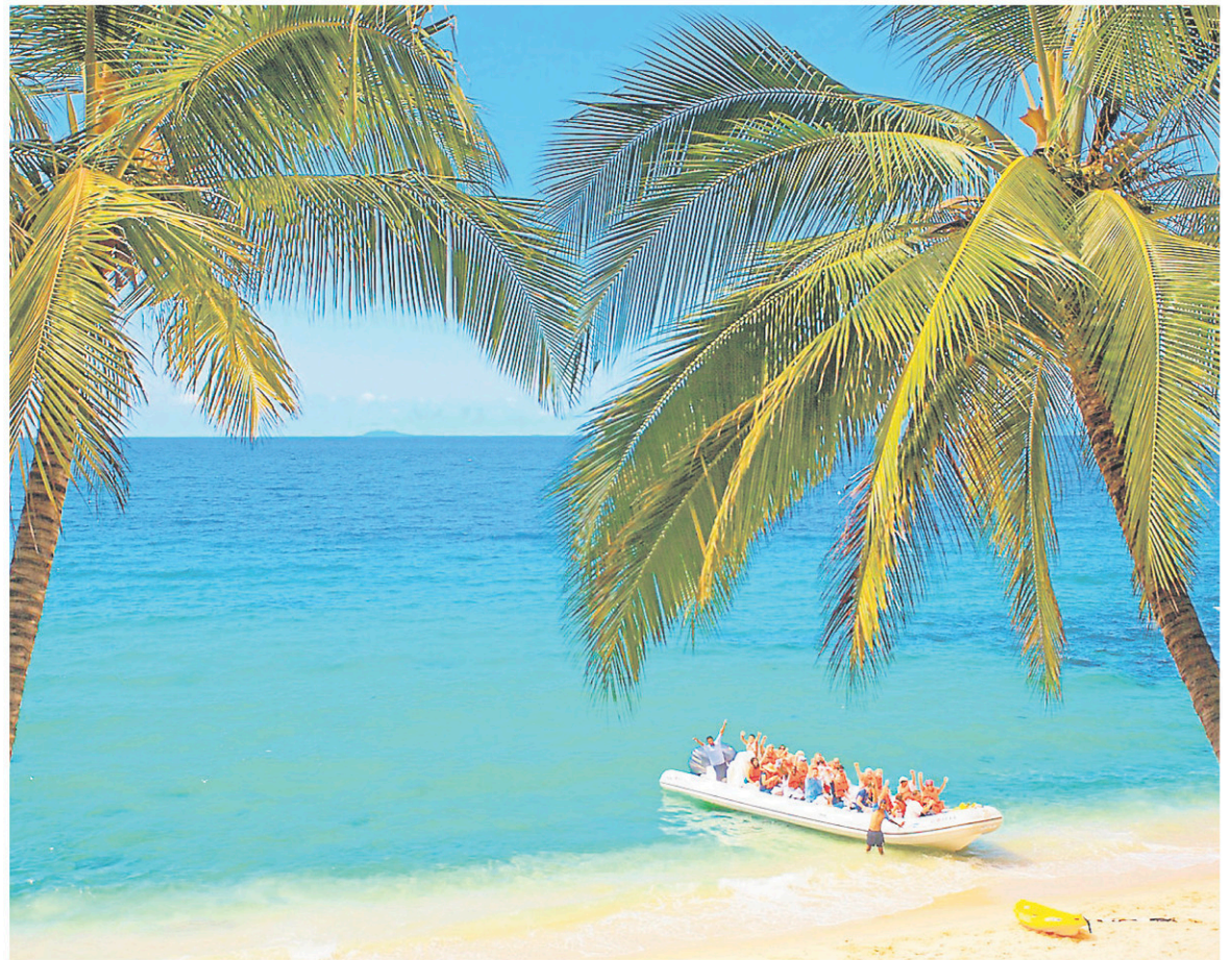
Envie d'action : optez pour un safari marin. — PHOTO SAMUEL LAROCHELLE, COLLABORATION SPÉCIALE