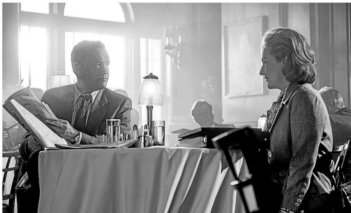
Le Post évoque la crise des Pentagon Papers selon le point de vue de Ben Bradlee et de Katharine Graham (Tom Hanks et Meryl Streep), respectivement rédacteur en chef et propriétaire du Washington Post.

La Maison de la culture de Waterloo présente les Soirées d'improvisation du 18 janvier au 8 mars à 19 h.