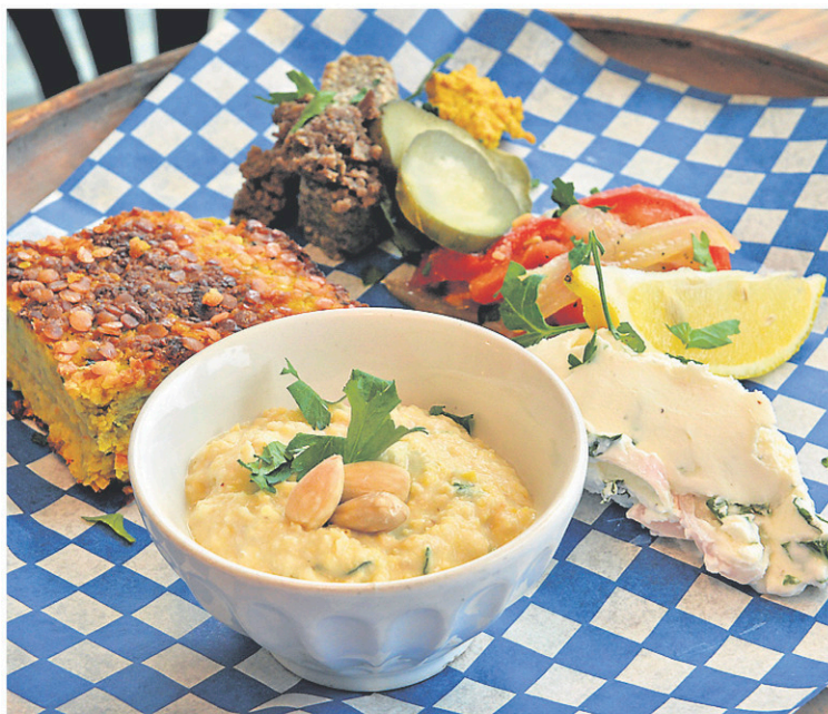
Un plateau végétarien: cretons de champignons, terrine de lentilles et légumes, houmous de pois chiches et fromage frais.

Ceux qui connaissent Le pied bleu, dans le quartier Saint-Sauveur à Québec, savent que l'endroit est spécialisé en charcuteries et est notamment réputé pour son boudin. Il peut donc paraître surprenant que le copropriétaire de l'endroit nous entretienne de « fausse » viande!