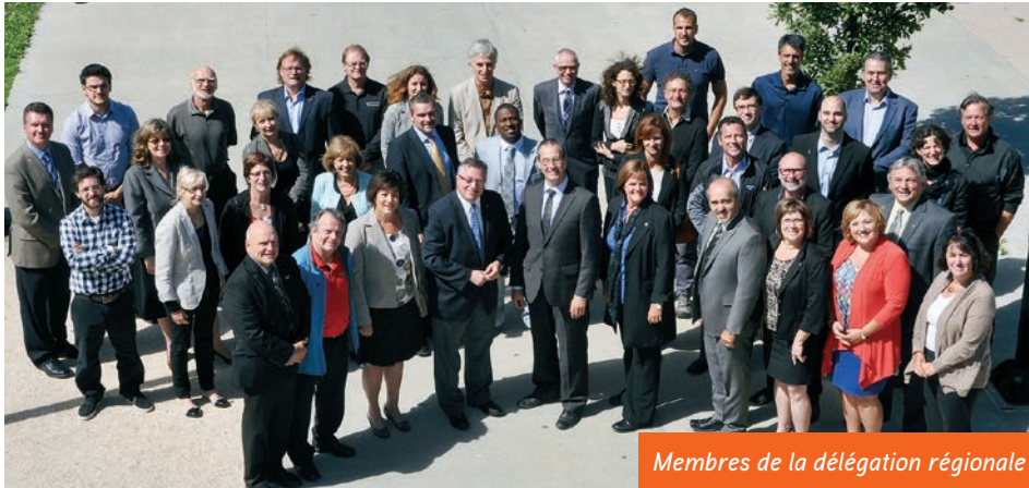
Membres de la délégation régionale

Le présent rapport met en lumière les faits saillants de nos différents axes de travail, des programmes et projets menés tout au long de la dernière année. L'équipe coordonne l'ensemble des activités et s'assure du respect des orientations ainsi que d'une gestion efficiente des ressources. L'appui apprécié des administrateurs, des membres et des partenaires mène à des résultats positifs et dynamiques.