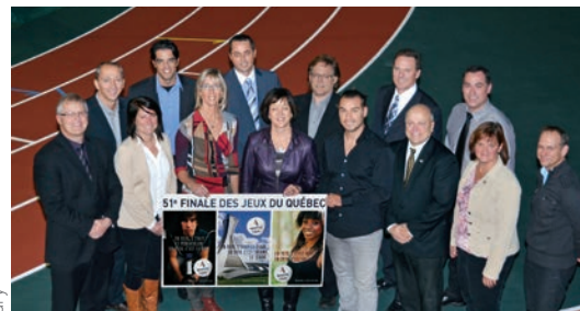
Comité de pilotage de la 51 e finale des Jeux du Québec