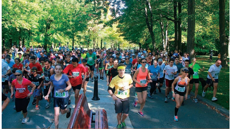
Seconde édition de l'événement Course à pied organisée par le Club aquatique du Sud-Ouest

L'utilisation des médias sociaux demeure un défi incontournable et d'importantes avancées ont été réalisées afin de rendre l'information plus disponible. Une page Facebook collective a d'ailleurs été créée www.facebook.com/declicloisir et nous avons réalisé une promotion régionale dans cinq stations de métro en septembre 2013.