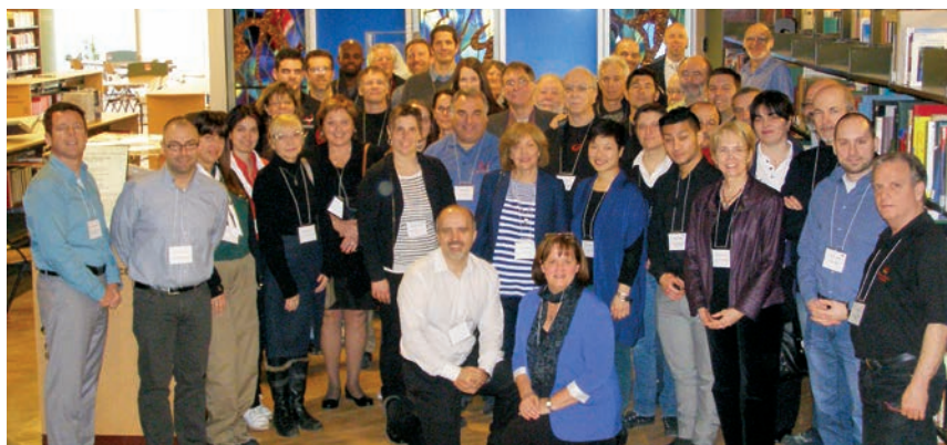
Participants à la journée de réflexion du 22 mars