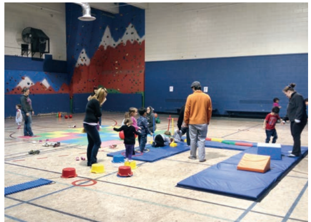
Les Petits Ateliers, Centre de Loisirs Monseigneur Pigeon

Après deux années d'engagement, d'expérimentation et de mobilisation, les 5 arrondissements et leurs nombreux partenaires s'investissent, plus que jamais, dans une offre d'activités diversifiée et adaptée. À ce stade du projet régional dont la fin est prévue en décembre 2014, toutes les organisations impliquées préparent des actions conjointes en vue d'assurer et de contribuer à la pérennité des initiatives porteuses et mobilisatrices dans les communautés locales. La rentrée automnale 2014 sera le théâtre d'un événement rassembleur qui se déroulera dans chaque arrondissement. Ces événements permettront de lancer la programmation des activités dédiées aux 16-35 ans, d'associer de nouvelles organisations à ce mouvement pour les jeunes adultes et familles. Ce sera un moment privilégié pour le citoyen voulant s'initier à différentes activités dans un contexte récréatif et festif tout en faisant connaissance avec les différentes ressources du milieu.