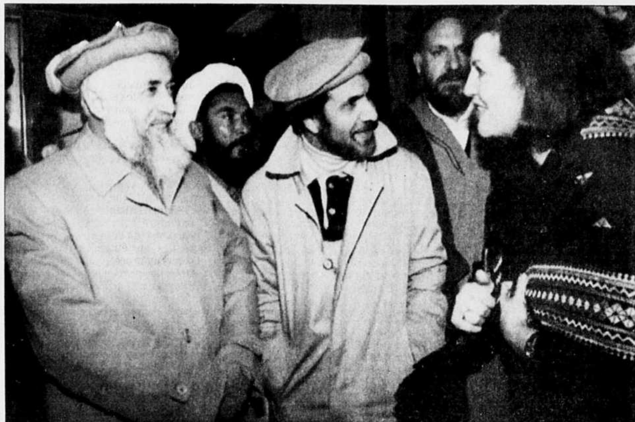
La mère d'un soldat soviétique tué en Afghanistan a accueilli hier à Moscou des représentants de la résistance afghane.

Enfin, le Parlement israélien a voté par 26 voix contre 12 une résolution demandant au gouvernement de n'engager aucune négociation sur l'avenir des hauteurs du Golan, capturées en 1967 sur la Syrie et annexées le 13 décembre 1981. La résolution demande également la construction de nouvelles implantations juives sur le Golan, pour accueillir 18 000 personnes.