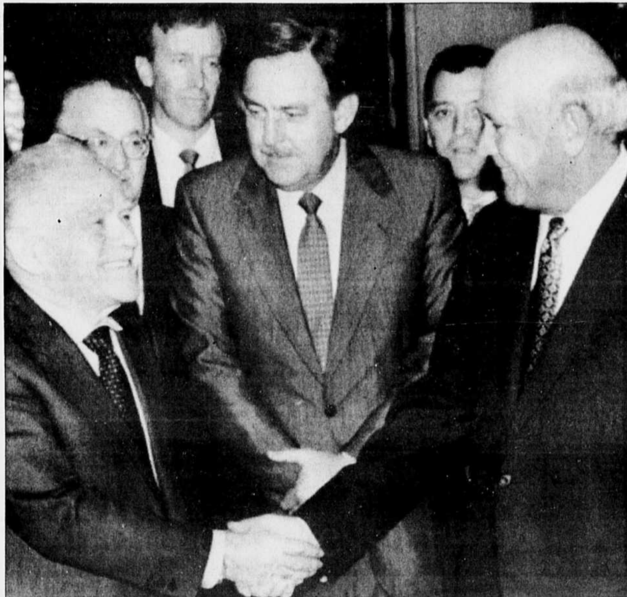
Le premier ministre israélien, M. Yitzhak Shamir, a reçu hier à Jérusalem le président sud-africain, M. Frederik de Klerk. Le ministre sud-africain des Affaires étrangères, M. Pik Botha, au centre, assistait à la rencontre.

M. Lévy et Botha ont signé un protocole d'accord de coopération économique, industrielle, culturelle et touristique, a annoncé un porte-parole du ministère israélien des Affaires étrangères. Les relations commerciales civiles se sont élevées l'an dernier à 317 millions de $, selon le