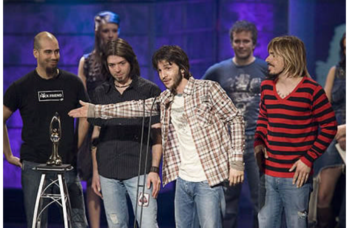
Le groupe Malajube , lauréat 2006 du Félix de la révélation de l'année, a reçu une bourse du CALQ pour la création des chansons du disque Trompe l'œil , sorti en février dernier.