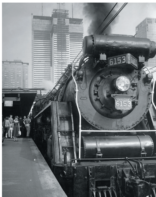
FONDS D'ARCHIVES PLACE VILLE-MARIE (NON DATÉ) L'emplacement de la Place Ville-Marie était à l'origine une ligne de chemin de fer du Canadien National, creusée à même un flanc du mont Royal.