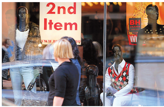
L'affichage en anglais est dénoncé à Montréal depuis plusieurs années.

Pour appuyer ses dires, il a présenté, en compagnie de la présidente du Mouvement Monté-