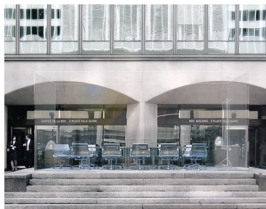
FONDS D'ARCHIVES PLACE VILLE-MARIE

Zeckendorf est appelé par le Canadien National (CN) à relever un défi de taille: ériger l'édifice à même l'énorme fossé laissé par le tunnel ferroviaire creusé sous le mont Royal. L'ambitieux chantier ferroviaire lancé par le Canadien Nord (nationalisé plus tard CN) devait être «re-