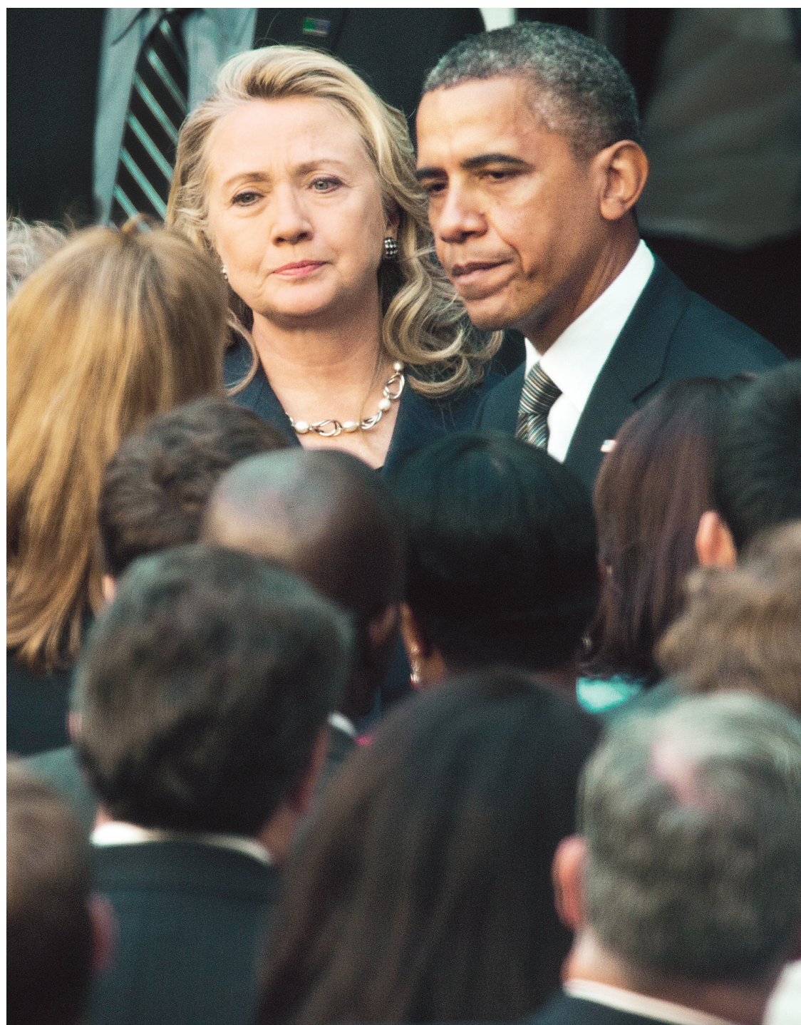
«Les États-Unis s'opposent à toute tentative de dénigrer les croyances religieuses, mais nous nous opposons sans équivoque à cette violence insensée qui a coûté la vie à nos fonctionnaires», a déclaré mercredi à Washington Barack Obama, qui était accompagné par la secrétaire d'État, Hillary Clinton.

L'opération aurait été planifiée pour le 11 septembre, selon les services secrets américains