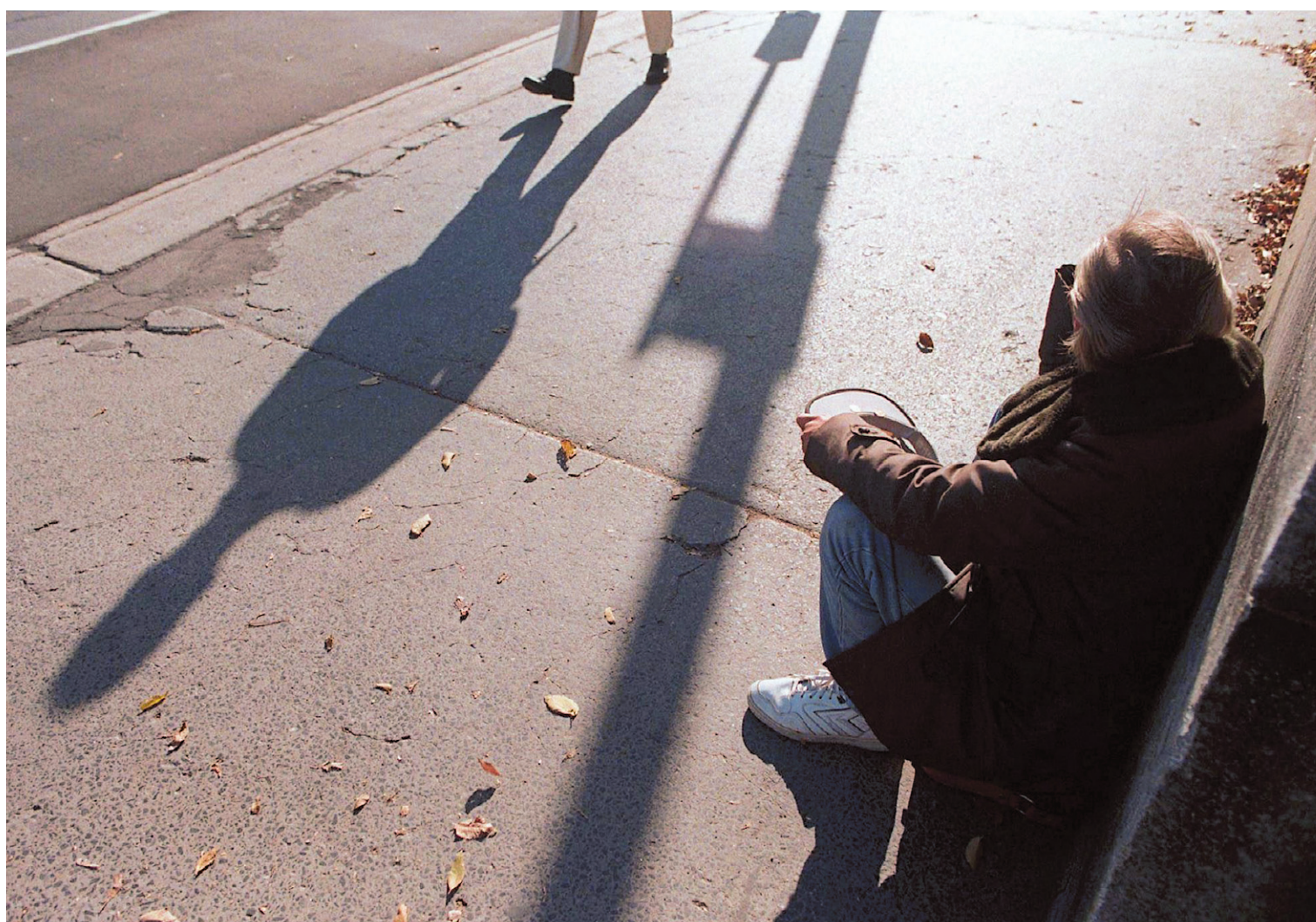
TOM HANSON LA PRESSE CANADIENNE

Les maisons de chambres peuvent être une étape décisive pour mettre fin à l'itinérance.