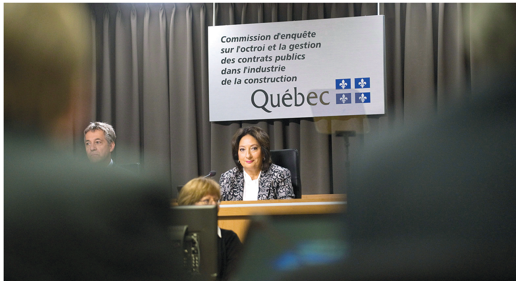
La juge France Charbonneau et le commissaire Renaud Lachance reprennent leurs travaux lundi.