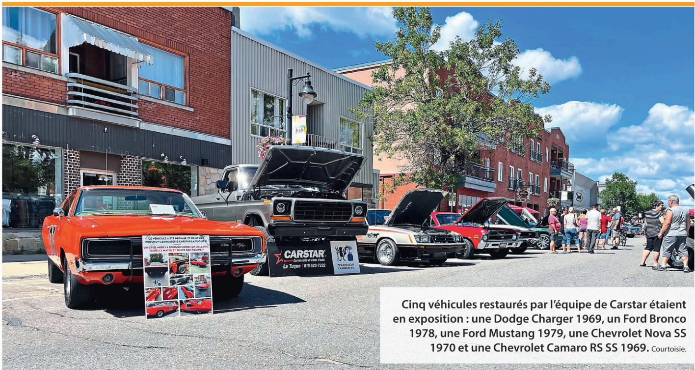
Cinq véhicules restaurés par l'équipe de Carstar étaient en exposition : une Dodge Charger 1969, un Ford Bronco 1978, une Ford Mustang 1979, une Chevrolet Nova SS 1970 et une Chevrolet Camaro RS SS 1969.