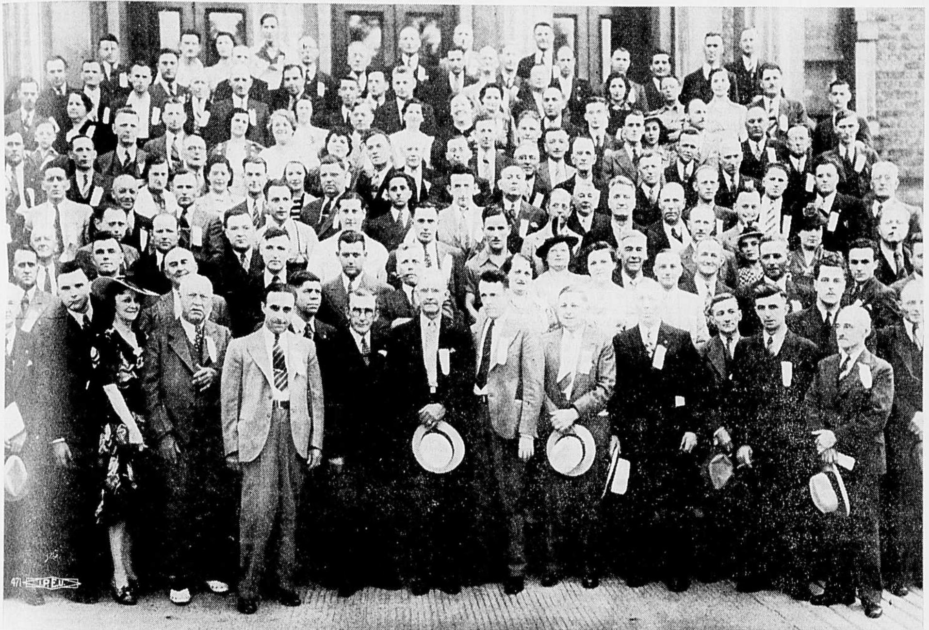
GROUPE DE DELEGUES A LA CONVENTION DE LA FEDERATION PROVINCIALE DU TRAVAIL DU QUEBEC, TENUE A SHERBROOKE.

La conférence de Sherbrooke prend attitude sur la question politique. — Elle recommande toutefois "d'aider nos amis et de combattre nos ennemis". Elle proteste contre les ordonnances de l'Office des salaires raisonnables et réclame des amendements à la loi des conventions collectives de travail. La bonne entente dans les rangs est préconisée.