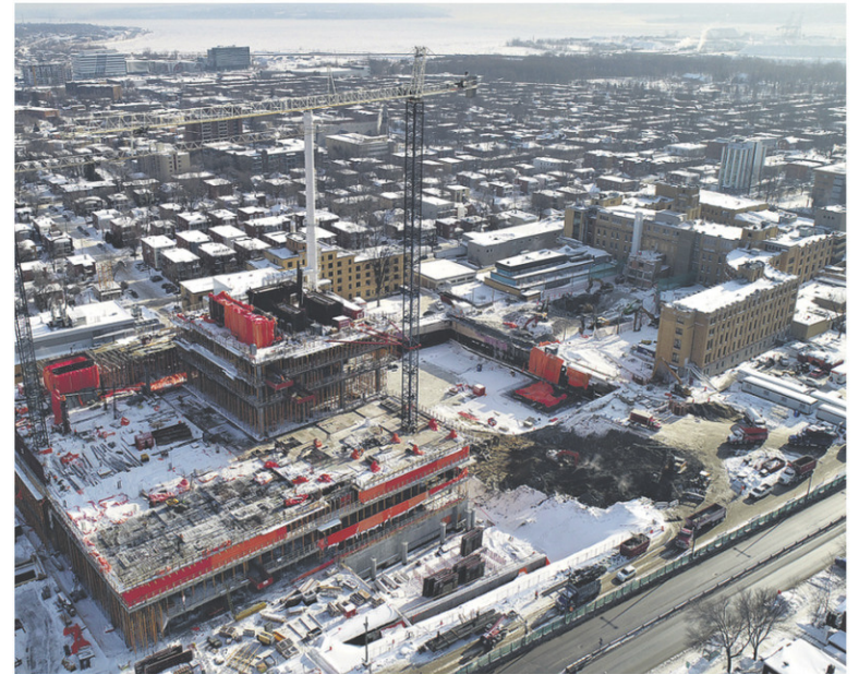
CHANTIER DE L'HÔPITAL DE L'ENFANT-JÉSUS

De son côté, le chantier de l'Hôpital de l'Enfant-Jésus de Québec – un projet de 1,9 milliard réalisé en consortium avec SNC-Lavalin et Bouthillette Parizeau – a brillé par sa méga complexité logistique. « L'hôpital devait poursuivre ses