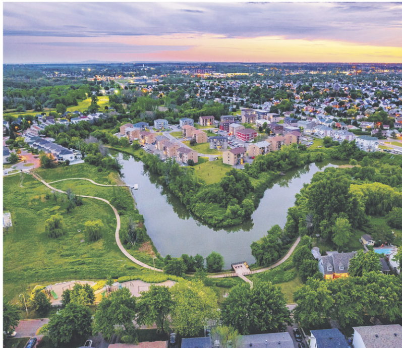
LE SENTIER NATURE DE LA RIVIÈRE-DE-LA-TORTUE DE CANDIAC (2,1 KM)