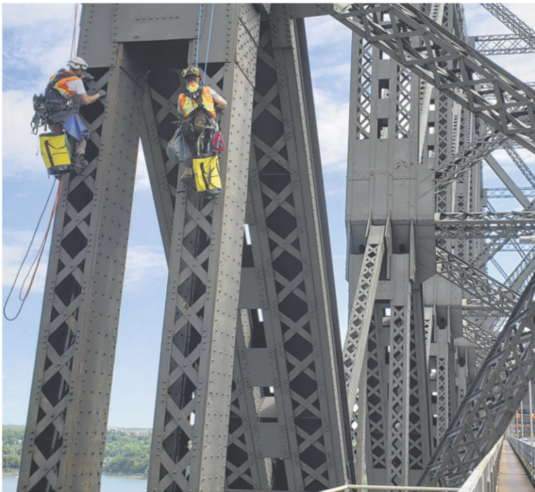
INSPECTION DU PONT DE QUÉBEC