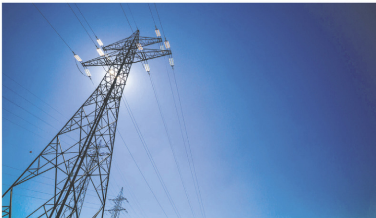
WSP: EN AFRIQUE, LE PROJET DE RUSUMO FALLS, CONSTRUCTION DE 380 KM DE LIGNE DE TRANSMISSION D'ÉLECTRICITÉ ET DE 4 SOUS-STATIONS RELIANT 3 PAYS