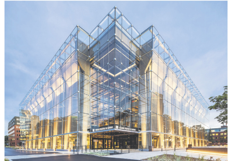
GRAND THÉÂTRE DE QUÉBEC

est une première au Québec. « En plus de répondre aux besoins de la collectivité, le projet-pilote représente une véritable avancée technologique. » On y a intégré des panneaux solaires, des bornes de recharge et un système de stockage d'énergie sur batterie en plus d'un régulateur de charge doté de fonctionnalités d'optimisation et de prévision météorologique. Le résultat ?