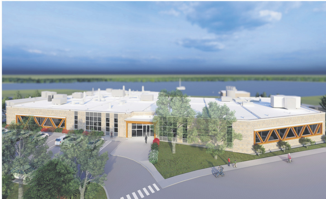
MODÉLISATION DE L'USINE DE TRAITEMENT D'EAU DE DRUMMONDVILLE – PHOTO: TLA ARCHITECTES