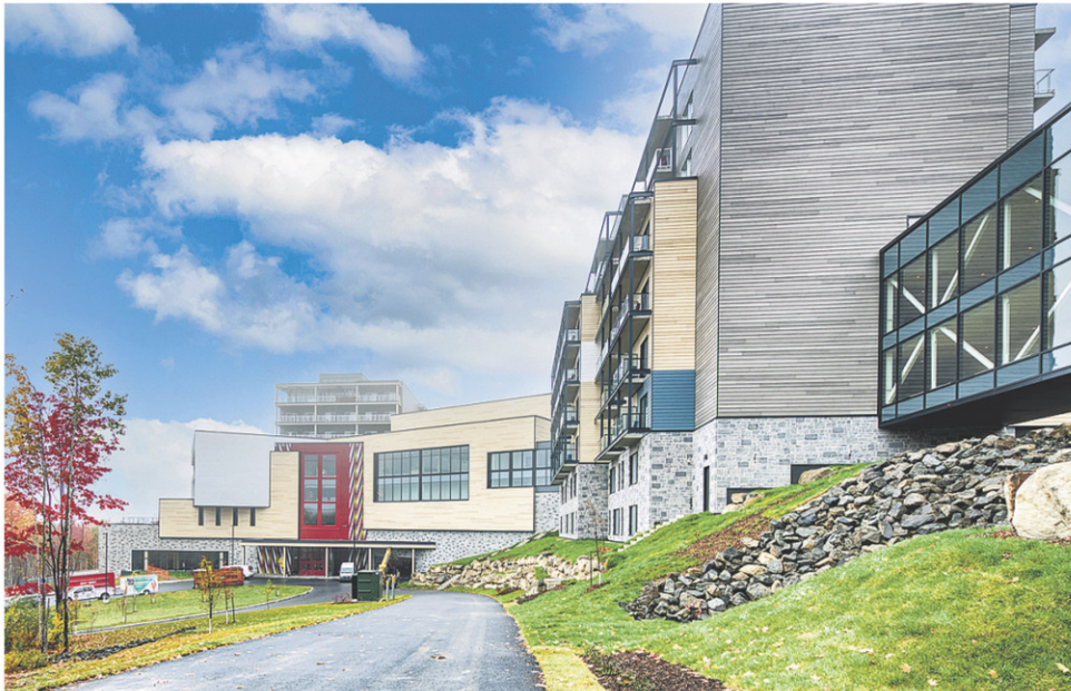
CIMA+ A ÉTÉ IMPLIQUÉE DANS LA CONSTRUCTION DU RESORT CLUB MED DE CHARLEVOIX