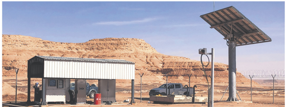
FNX-INNOV: EN ALGÉRIE, UN GRAND PROJET DE TÉLÉCOMMUNICATION VISANT LA SÉCURITÉ D'UN DES PLUS IMPORTANTS PIPELINES DU PAYS