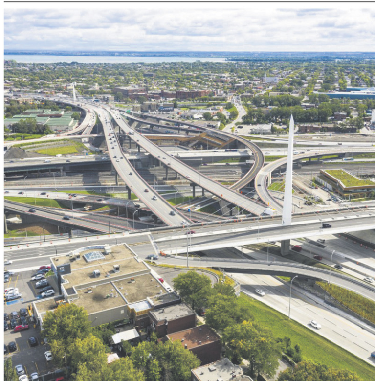
ÉCHANGEUR TURCOT À MONTRÉAL

de l'Échangeur Turcot dont 3 ponts signatures, 145 km de voies routières et 21 km de voies ferrées est un bon exemple. « L'utilisation de drones pour réaliser les inspections de chantier s'est avérée payante à tous les points de vue, en économisant temps et argent, sans compter qu'elle a permis de travailler en minimisant les fermetures de circulation. La mémoire s'efface,