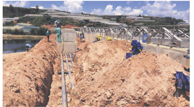
EXP: À DI AN AU VIETNAM, CONCEPTION ET SURVEILLANCE D'UNE NOUVELLE USINE DE TRAITEMENT DES EAUX USÉES ET D'UN IMPORTANT RÉSEAU D'ÉGOUT PRIMAIRE