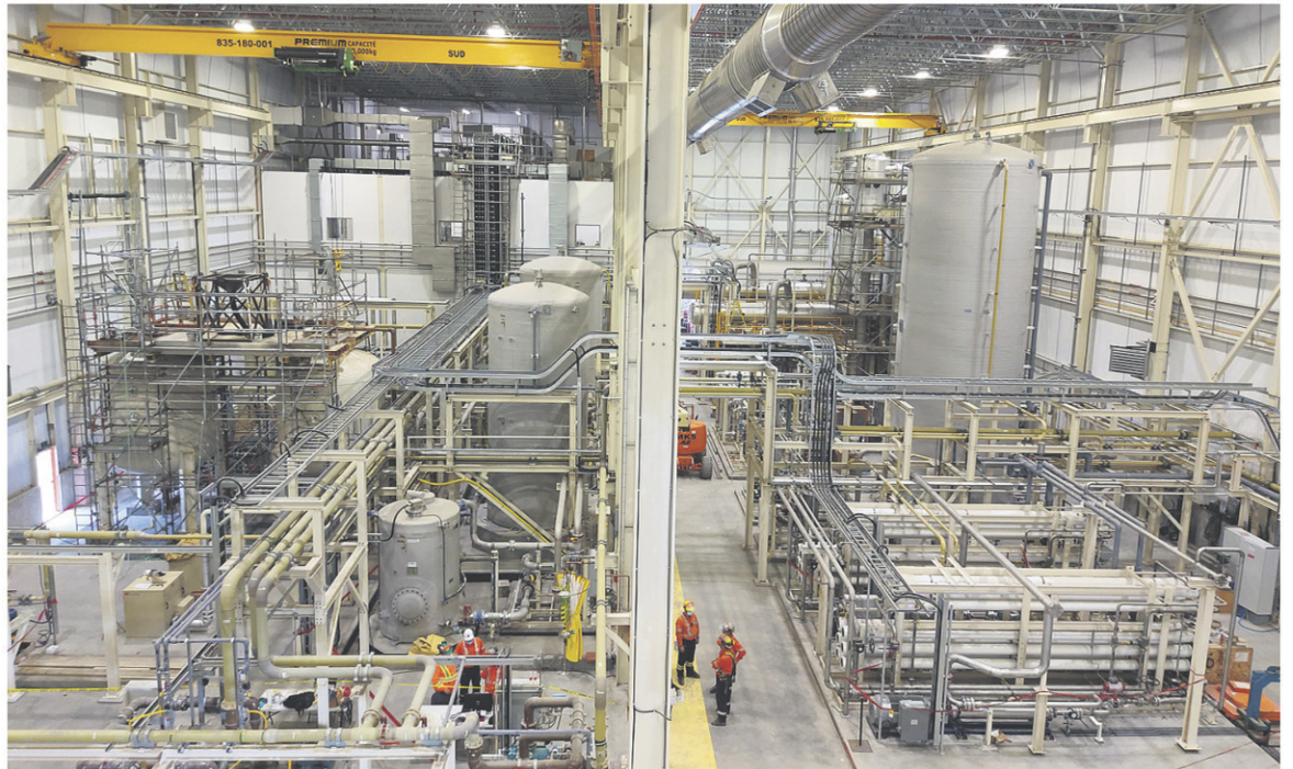
USINE DE TRAITEMENT DES EAUX DE LA MINE NIOBEC, AU SAGUENAY-LAC-SAINT-JEAN