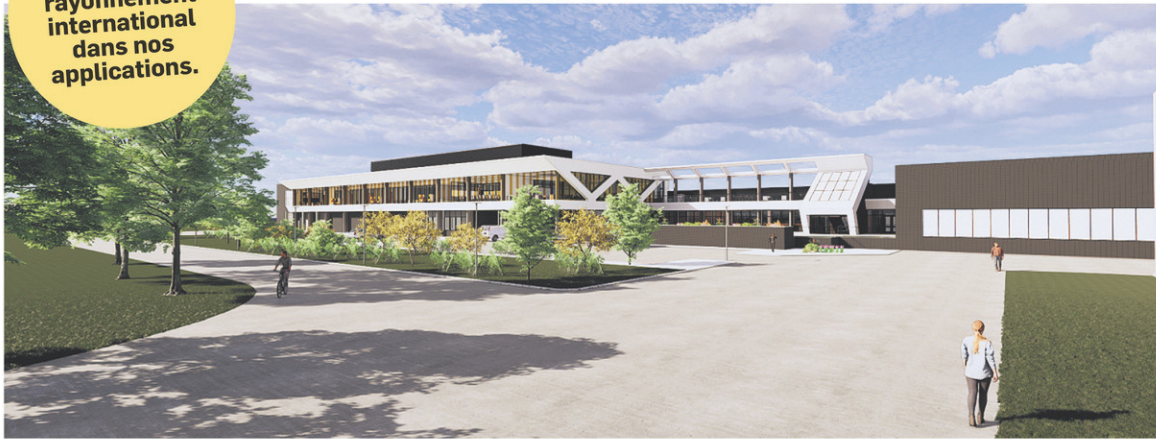
STANTEC : EN SASKATCHEWAN, RÉFECTION ET MODERNISATION DE L'USINE DE BUFFALO POUND

D'autres exemples du rayonnement international dans nos applications.