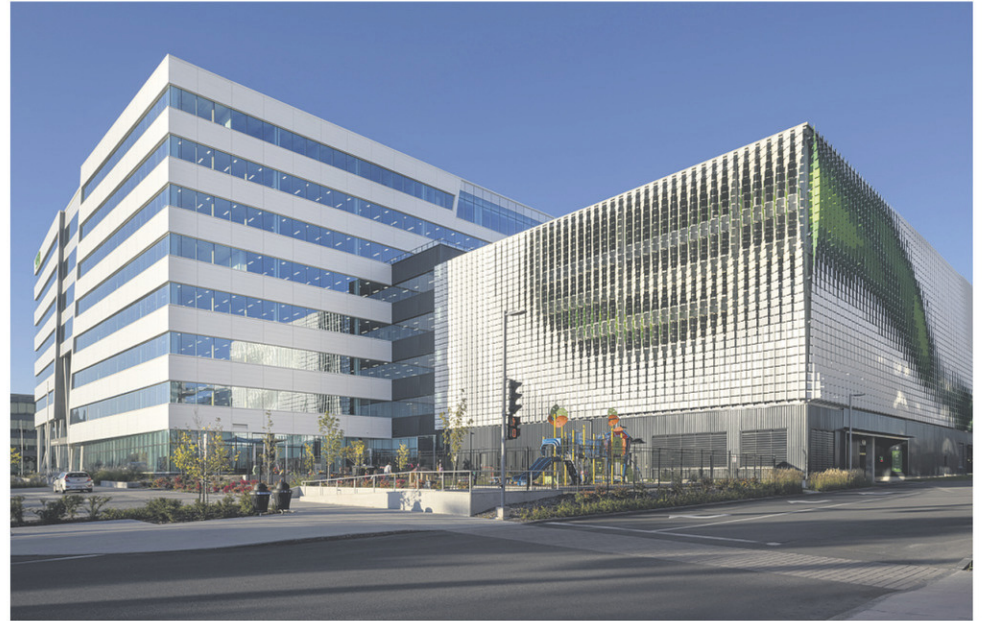
CIMA+ FAIT PARTIE DU CONSORTIUM DE LA CONSTRUCTION DU NOUVEAU SIÈGE SOCIAL DE LA CNESST, DANS L'ÉCOQUARTIER D'ESTIMAUVILLE, À QUÉBEC