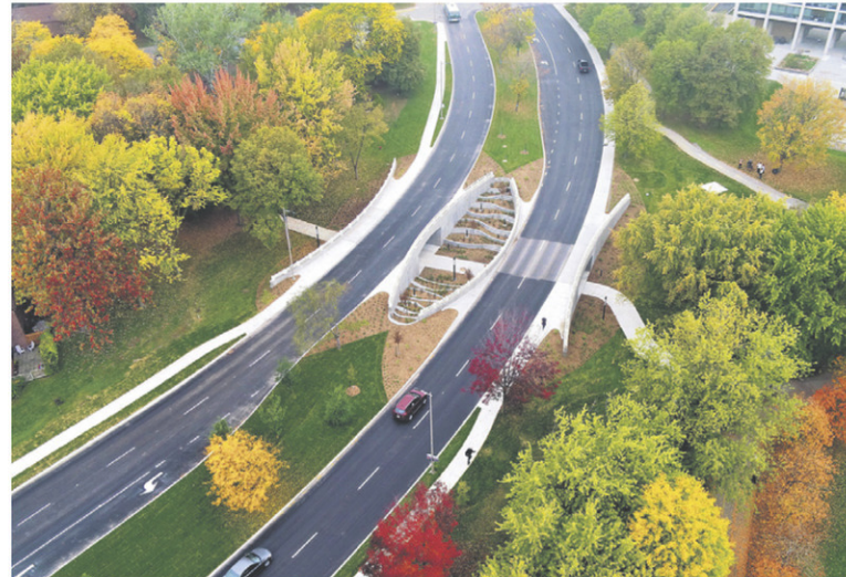
LES PONTS DARWIN, À MONTRÉAL