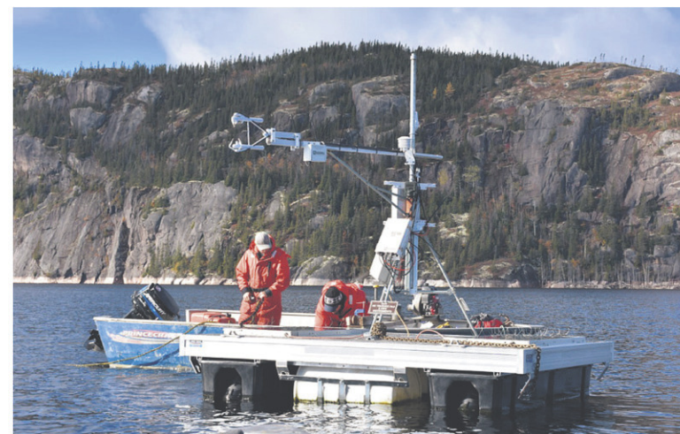
INSTALLATION MESURANT L'ÉVAPORATION SUR LE RÉSERVOIR DE LA ROMAINE 2

La faculté collabore actuellement avec Hydro-Québec pour quantifier l'empreinte eau de son hydroélec-