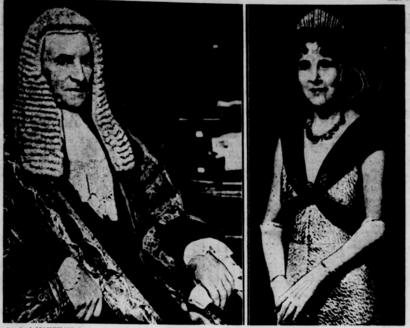
À gauche, lord MAUGHAM, lord chancelier de Grande-Bretagne, accompagné de son épouse lady MAUGHAM. Puis tous de et regagner la Grande-Bretagne au plus tôt à cause de la situation internationale.