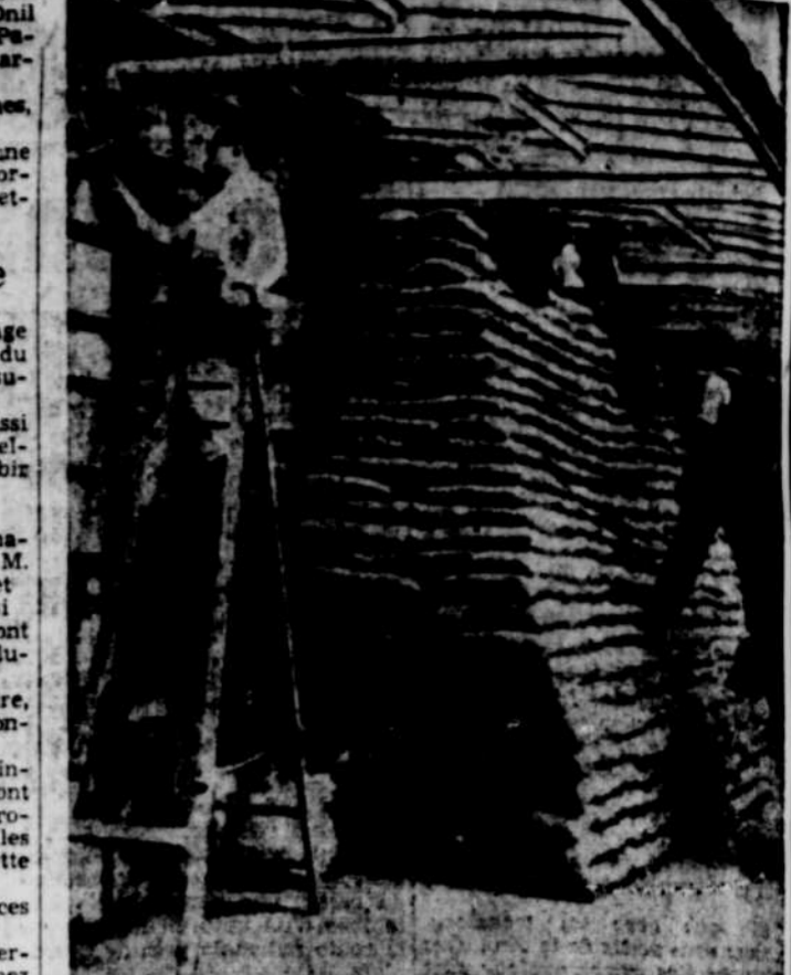
Les ouvriers entourent ici d'une épaisse muraille de sacs de blé la Mansion House, à Londres, vendredi matin, à la suite d'un discours du premier ministre Chamberlain, pour proclamer l'imminence du danger de guerre. Une photo câblée de Londres.