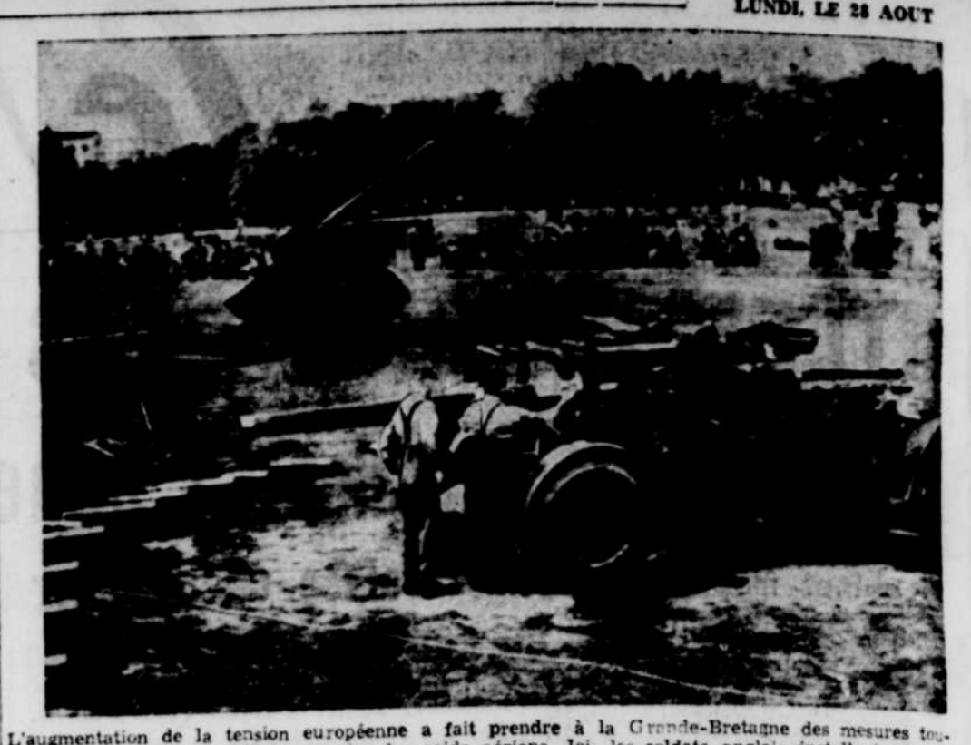
L'augmentation de la tension européenne a fait prendre à la Grande-Bretagne des mesures spéciales de défense, contre les raids aériens. Ici, les soldats anglais installent un canon anti-aérien à Hyde Park. Un autre canon vient d'être installé. A noter, les obus répartis en demi-cercle autour des canons.