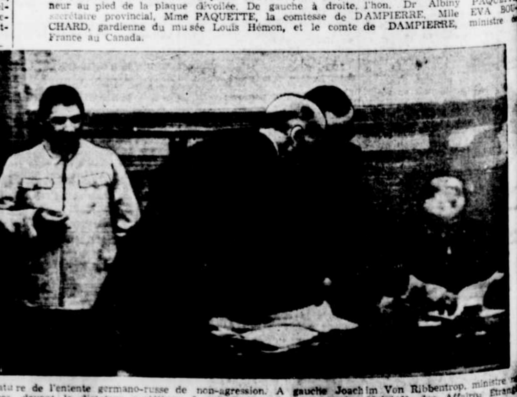
Volici la cérémonie de la signature de non-agression. A gauche Joachim Von Ribbentrop, ministre des Affaires Etrangères, devant le dictateur soviétique Joseph Staline. Le commissaire Molotov, des Affaires Etrangères, signe lui aussi. Cette photo a été télégraphiée à Londres puis en Amérique.

Des Allemands... (Suite de l'article) Les autorités se préparent à envoyer des Seaforth... (Suite de l'article) La note d'Hitler... (Suite de l'article) Les troupes... (Suite de l'article) La position de... (Suite de l'article) Les autorités... (Suite de l'article) VISITE L'OU CANAD... Prix réduits... Exemples de... Validité: 45 jours... Il y aura... Pour billets d'arriv, locat... Pac