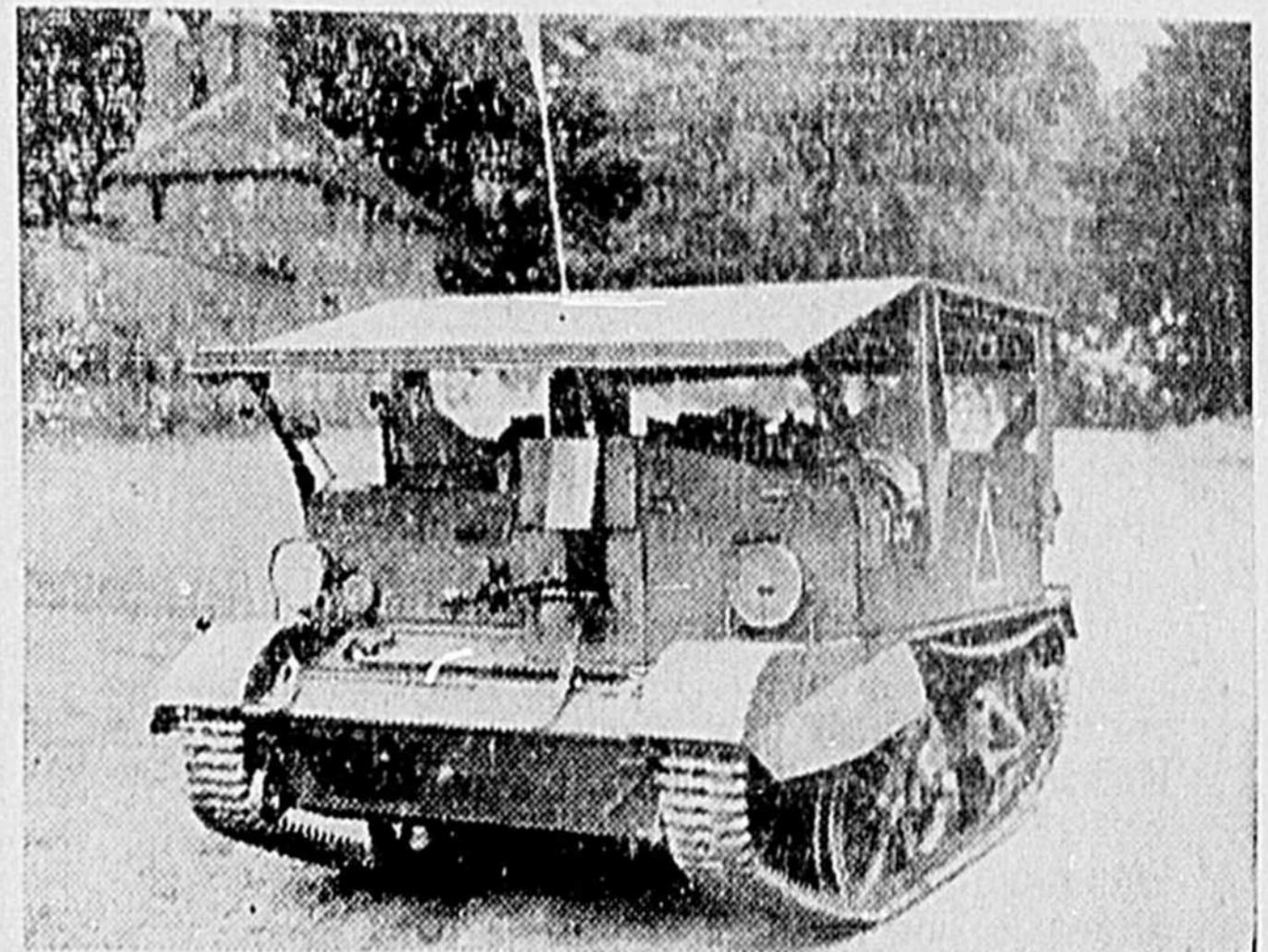
Petit tank-éclairer anglais photographié au cours de manoeuvres. C'est un tank léger mais très rapide

Le tout s'est terminé au chant Lacordaire.