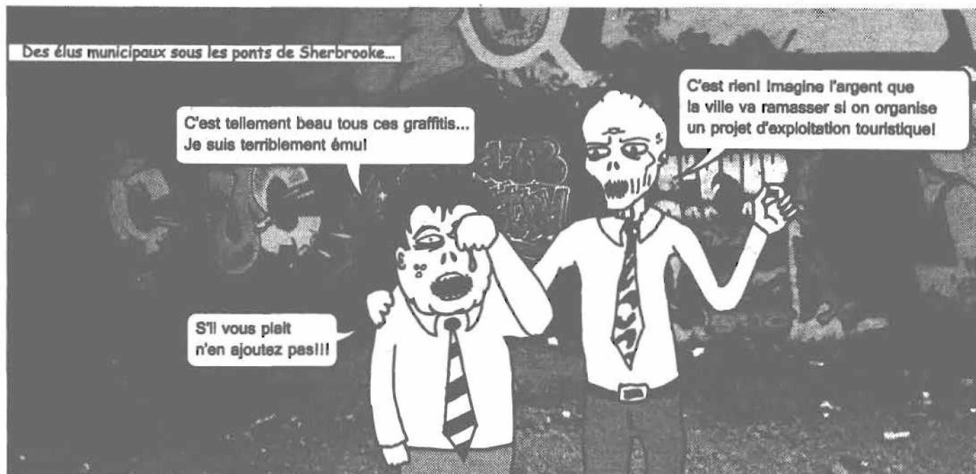
Illustration par Etienne Ménard