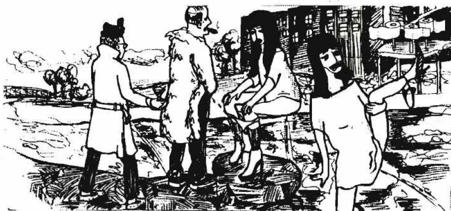
Illustration par Philippe Internoscia