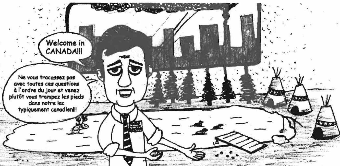
Illustration par Etienne Ménard

Pour plus d'information : (819) 346-0101