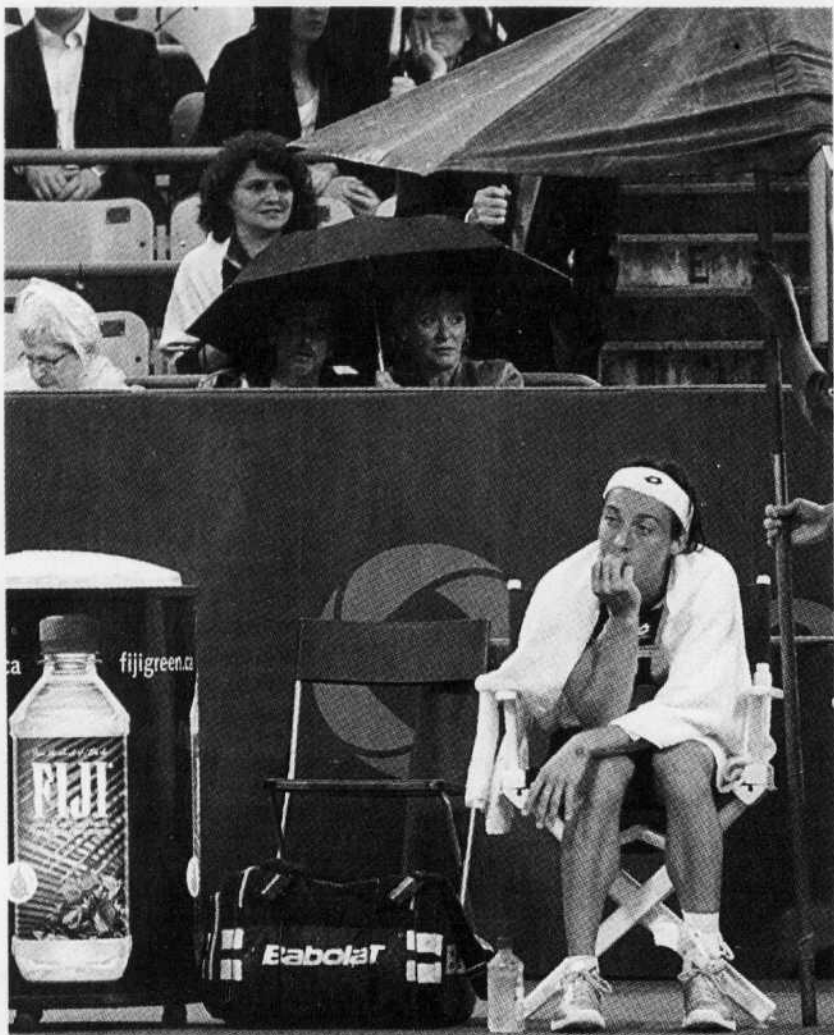
L'Italienne Francesca Schiavone regardant tomber la pluie, hier soir, sur le court central du stade Uniprix du parc Jarry. Elle a finalement perdu son match contre la jeune Autrichienne de 17 ans Tamira Paszek.

Lors de la deuxième manche, qu'elle a perdue aux mains de son adversaire, Bartoli a même dû retraiter au vestiaire pour qu'un médecin lui prescrive des médicaments. «Mes bras et mes jambes tremblaient. Je me sentais vraiment étourdie. Le médecin m'a donné des comprimés, ce qui m'a beaucoup aidé au troisième set, mais il m'a fallu un peu de temps pour me sentir mieux», a dit Bartoli.