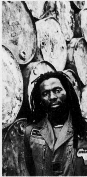
FRANCOFOLIES DE MONTRÉAL L'artiste exilé au Mali revient gonflé à bloc après avoir donné en Côte d'Ivoire deux concerts de réconciliation inspirés du One Love Peace Concert qu'avait organisé Bob Marley, il y a 30 ans.

... et des talents montréalais à l'extérieur