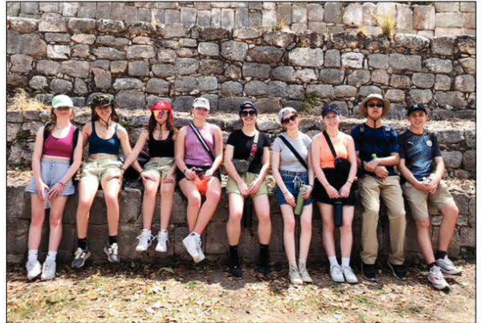
Une dizaine d'élèves du Collège Jésus-Marie de Sillery ont eu récemment la chance de participer à un voyage humanitaire, culturel et linguistique au Mexique.