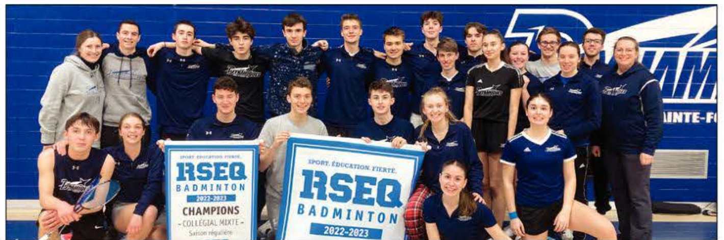
L'équipe de Badminton D1, déjà grande championne de la saison régulière, a remporté le titre de championne de la Conférence Nord-Est.