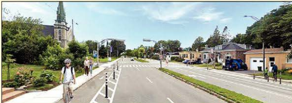
L'un des nouveaux liens cyclables, celui de 1,6 km entre les avenues des Gouverneurs et Marguerite-Bourgeoys sur le boulevard Laurier.