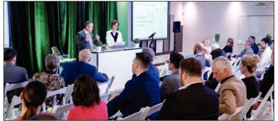
Les membres de la Caisse ont reçu d'excellentes nouvelles lors de l'assemblée générale annuelle de celle-ci.

En plus de la ristourne aux membres et de l'alimentation du Fonds d'aide au développement du milieu (FADM), la Caisse a distribué, en 2022, 208 077 $ à la collectivité, soit