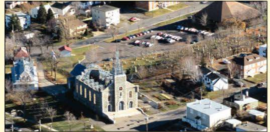
Le site patrimonial de la Visitation à Sainte-Foy a donné naissance à la paroisse Notre-Dame-de-Foy. Ce site comprend les vestiges de l'église Notre-Dame-de-Foy, le cimetière, et le presbytère, dont la partie la plus ancienne date de 1699.