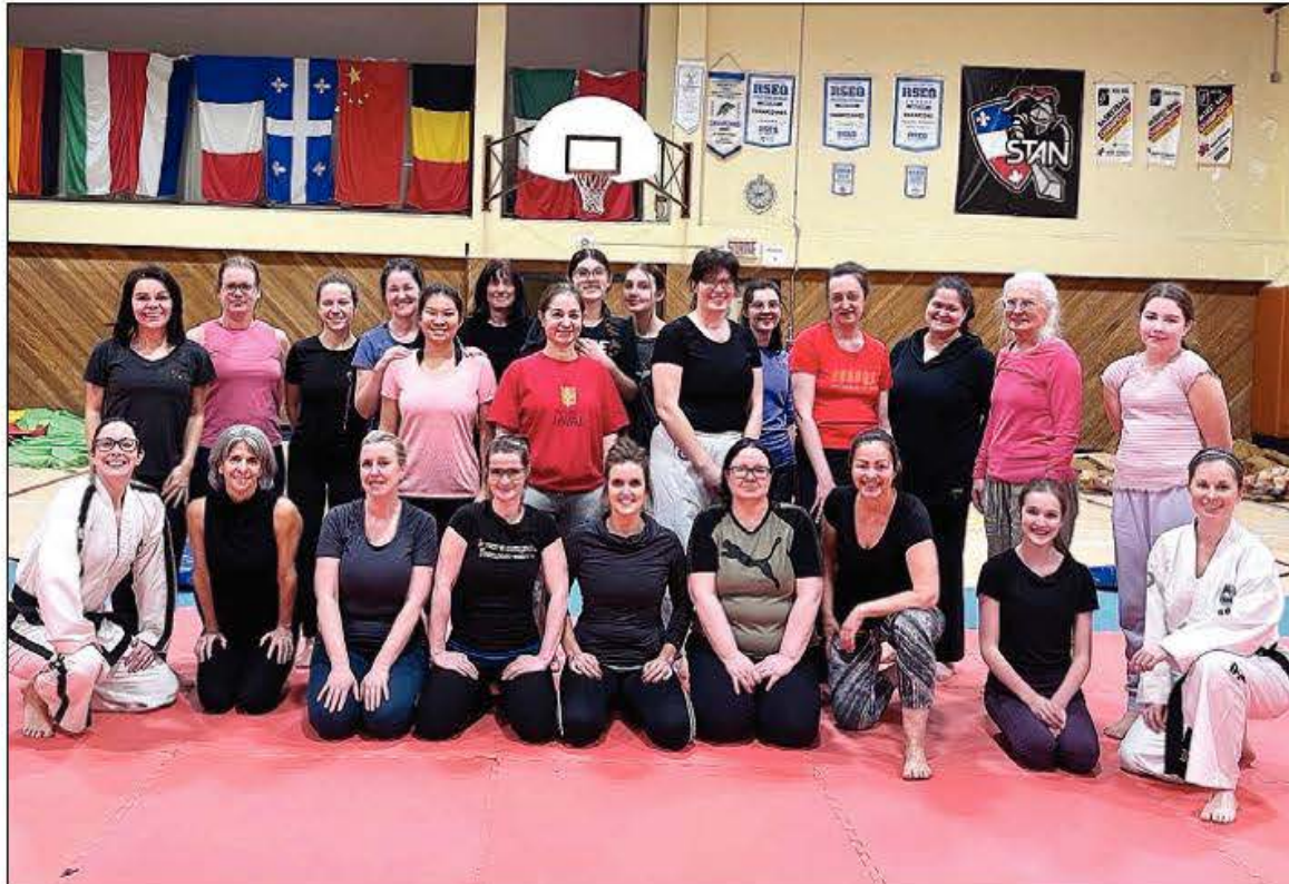
Un groupe de 25 participantes ont pris part à l'atelier.