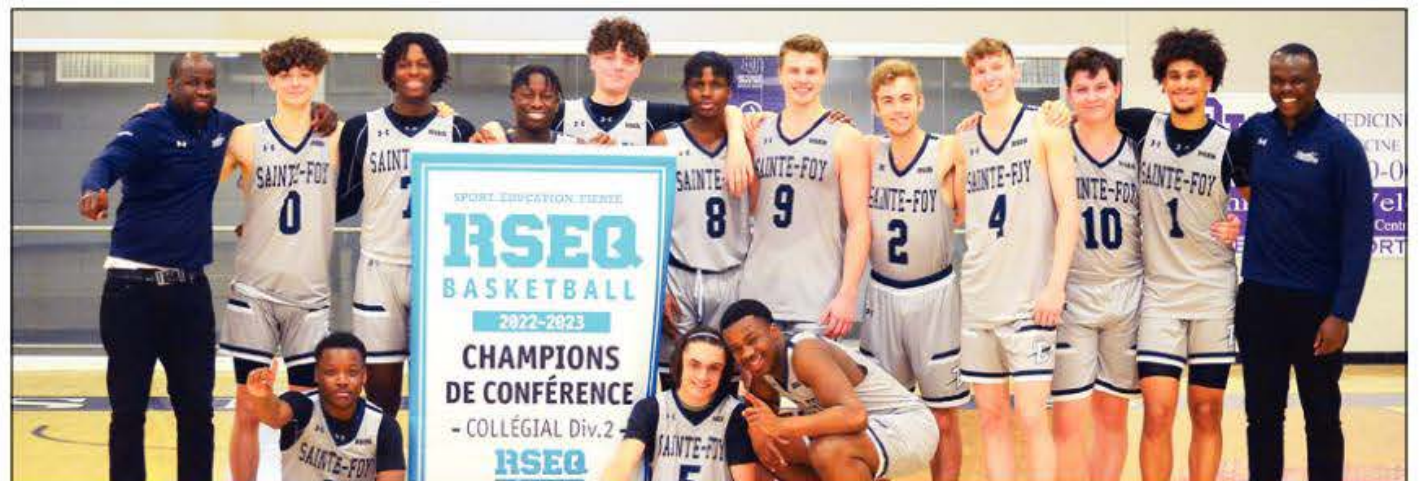
L'équipe masculine de Basketball D2 se classe au 1 er rang de sa conférence pour entamer les Championnats provinciaux, qui se tiendront à Alma.