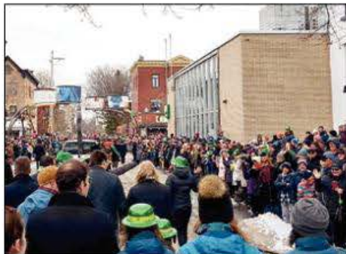
Les participants ont envahi le parcours du défilé assurant ainsi le succès de cet événement toujours très apprécié.