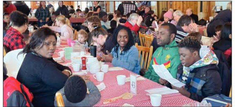
Des participants venant de 14 pays différents ont pu déguster un bon repas traditionnel québécois.