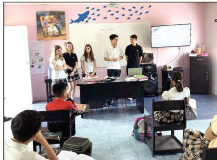
Les objectifs du voyage humanitaire sont de faire vivre une expérience enrichissante aux élèves.