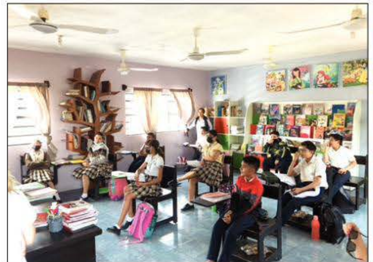
L'expérience leur a permis de découvrir la culture locale et de mieux comprendre la façon de vivre des habitants du Mexique.

ACHAT DE PUBLICITÉ : ventes@journal-local.ca