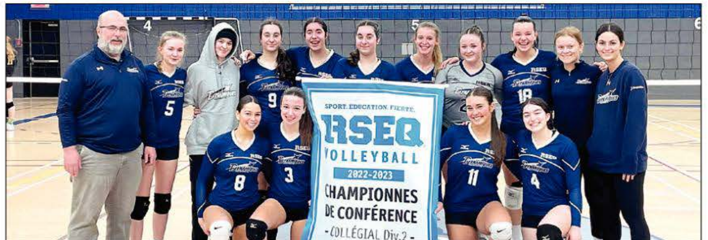
L'équipe en Volleyball féminin D2 se dirige donc fièrement vers les provinciaux, qui auront lieu à Baie-Comeau.