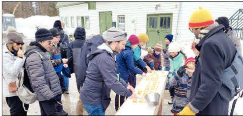
Dehors, la tire chaude est versée sur la neige et est fort convoitée par nos visiteurs.