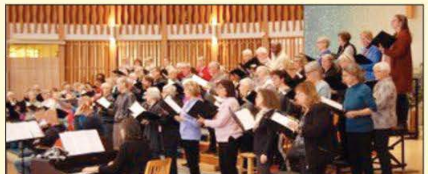
Le 30 avril prochain, le Chœur du Vallon interprétera six des plus beaux Gloria de la musique sacrée: Vivaldi, Haydn, Mozart (2), Schubert, Puccini.

Le concert se tiendra à l'église Sainte-Ursule, 3290, rue Armand Hamelin à 14 h. Pour toute information, visitez leur site Web : www.chœurduvallon.com . ■