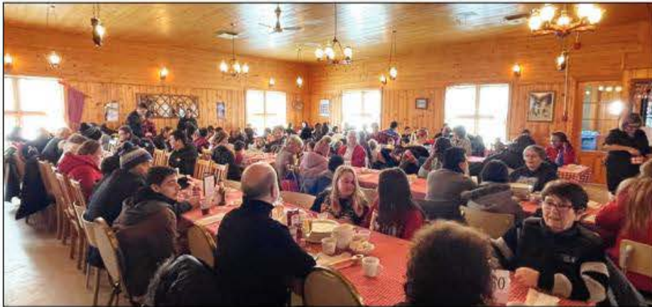
Les participants à la sortie cabane à sucre.