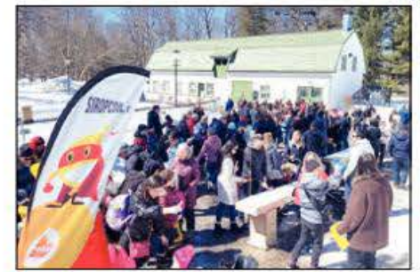
La mascotte SiropCool a accueilli de nombreux participants au dernier jour de l'événement.

À ces partenaires de premier plan s'ajoutent la contribution indéfectible de plusieurs autres collaborateurs ou partenaires financiers tels que les Producteurs et productrices acéricoles de Québec-Rive-Nord, M. Joël Lightbound député fédéral de Louis-Hébert,