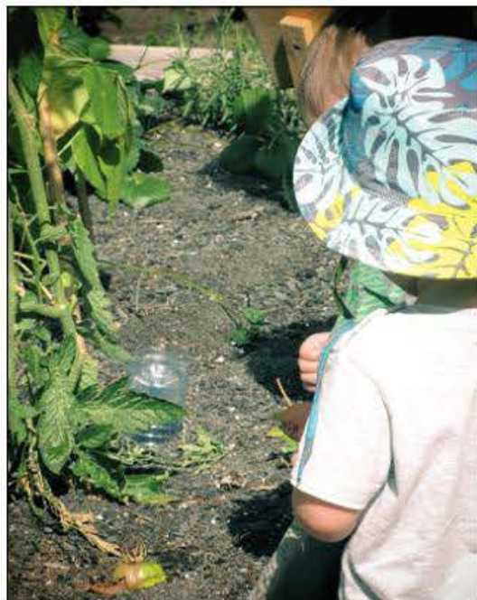
Les thématiques et activités seront centrées autour du jardin collectif dans le parc auquel les enfants auront accès quotidiennement.

Ce service offrira une programmation et un environnement adapté aux enfants de cette tranche d'âge. De plus, les thématiques et activités seront centrées autour du jardin collectif dans le parc auquel les enfants auront accès quotidiennement. Ils pourront donc semer, arroser, entretenir et voir évoluer le jardin. Pour plus d'informations et/ou pour s'inscrire, à la journée ou à la semaine, visitez le site Web de l'organisme: www.ressourceespacefamilles.com . ■