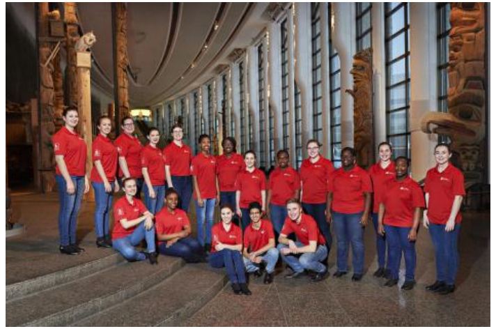
L'Ensemble vocal sénior De La Salle