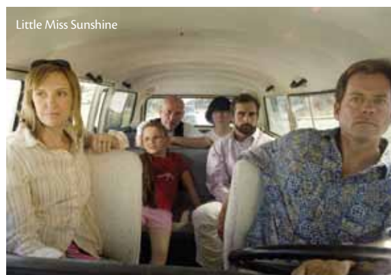
Little Miss Sunshine

Pour connaître la programmation complète, adhérez à la page Facebook du programme Hors les murs .