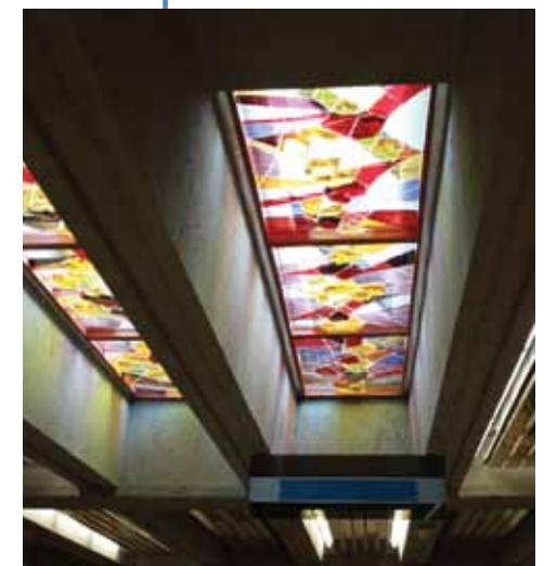
Envol d'oiseaux de Lyse Charland Favretti

Cette œuvre a été créée en 1983, à l'occasion de la construction de la bibliothèque Le Prévost, dans le cadre de la Politique d'intégration des arts à l'architecture et à l'environnement des sites gouvernementaux et publics du gouvernement du Québec.