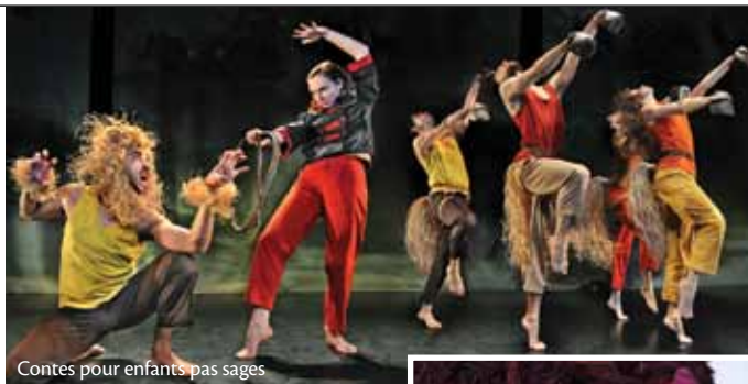
Contes pour enfants pas sages

Des laissez-passer sont requis pour assister aux événements présentés à l'auditorium Le Prévost. Ils sont disponibles 14 jours avant l'événement.