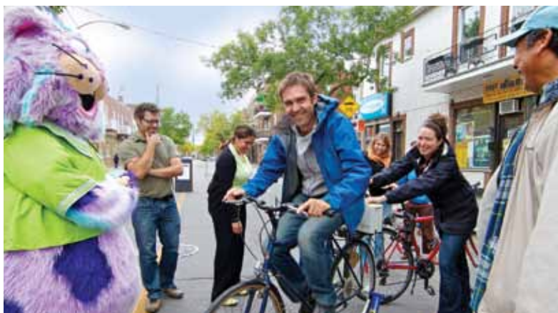
Le 21 septembre dernier, rue De Castelnau, des citoyens participent à la journée En ville sans ma voiture! organisée par l'arrondissement et les trois éco-quartiers.

Le programme Quartiers 21 vise à soutenir l'implantation, à l'échelle locale, de projets favorisant le développement de quartiers durables.