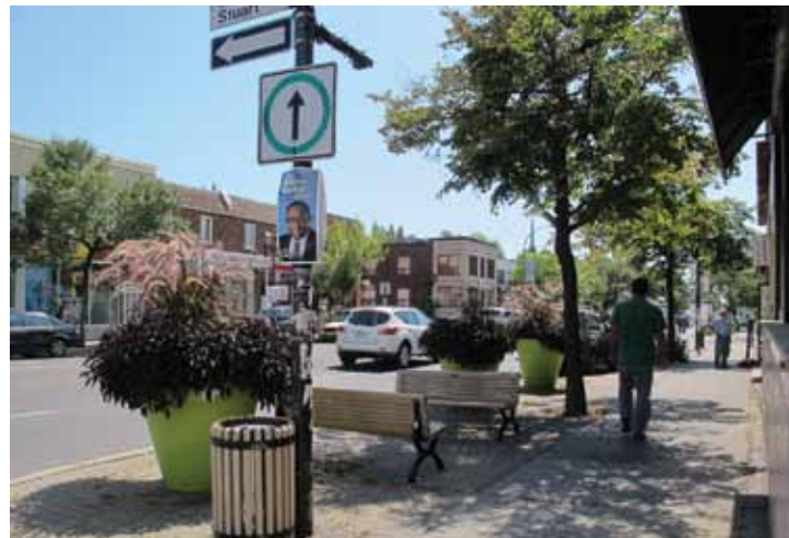
Une saillie de trottoir de la rue Jean-Talon nouvellement aménagée.

Depuis un an, l'organisme Vrac environnement coordonne le projet Quartiers 21 Parc-Extension : la rencontre en transport actif! Tel que son nom le suggère, ce projet vise l'amélioration et la bonification de l'offre en transport actif, soit la marche et le vélo, autour de l'artère commerciale Jean-Talon Ouest et de la zone intermodale de transport de la gare Jean-Talon. Plus concrètement, par la concertation avec les citoyens, les commerçants, les organismes et l'arrondissement, le projet permettra la révision d'aménagements urbains afin de répondre aux besoins liés au transport actif.