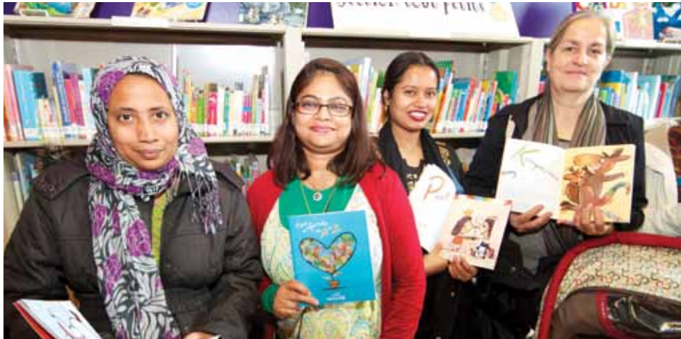
Des participantes heureuses de découvrir l'abécédaire.

Le 25 octobre dernier a eu lieu le lancement de l'abécédaire Nos enfants de A à Z , un ouvrage unique créé par l'illustrateur Philippe Béha et 26 résidants du quartier de Parc-Extension.