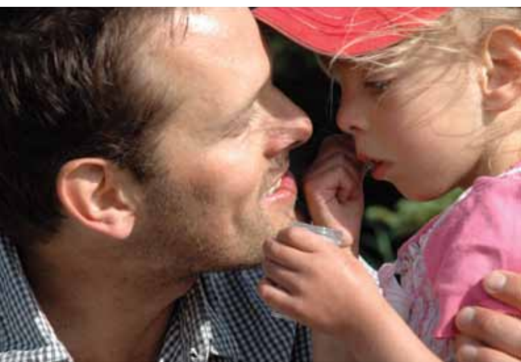
Alphée des étoiles

Carrefour Populaire Saint-Michel 2651, boulevard Crémazie Est 514 722-1211