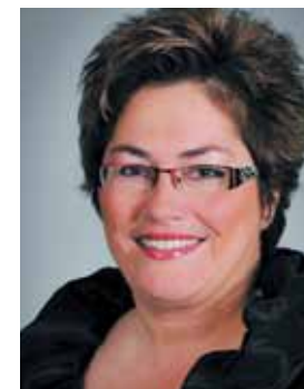
Le maire d'arrondissement

Mes meilleurs vœux pour un joyeux Noël et une bonne année 2013 !