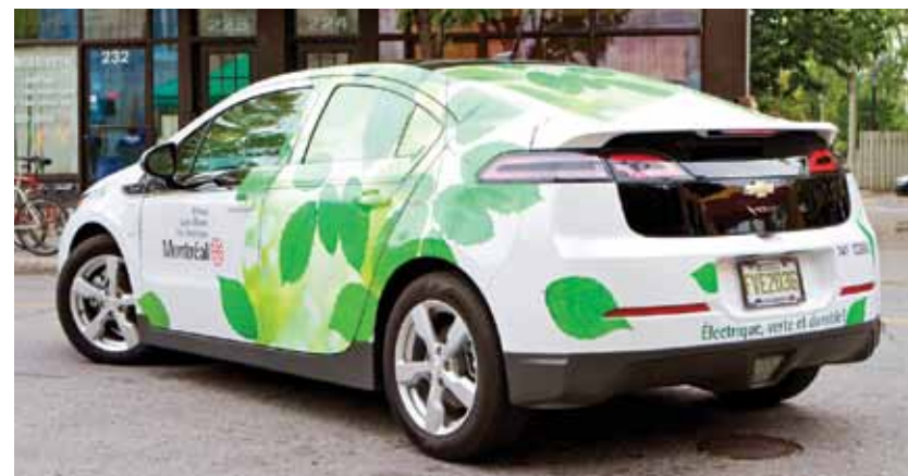
La Volt : électrique, verte et durable!

Cette nouvelle acquisition augmente ainsi la performance environnementale du parc de véhicules de l'arrondissement puisqu'elle contribue à améliorer la qualité de l'air et à réduire les émissions de gaz à effet de serre.