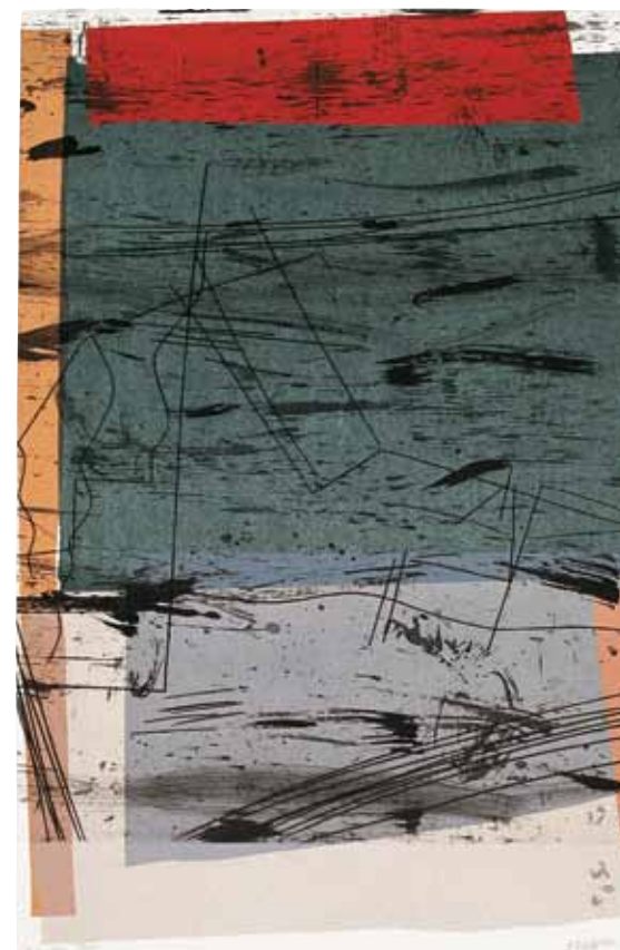
Barcelona Bay de Francine Simonin

Mercredi : de 13 h à 20 h Jeudi et vendredi : de 13 h à 18 h Samedi et dimanche : de 13 h à 17 h Lundi et mardi : fermé