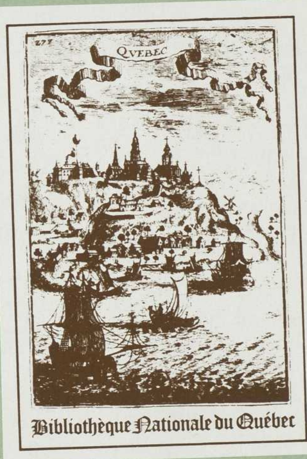
Bibliothèque Nationale du Québec