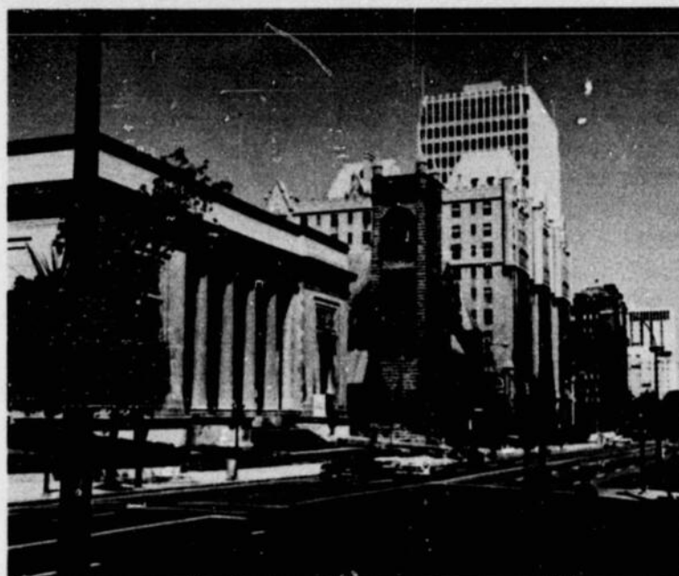
Montreal Museum of Fine Arts, Sherbrooke Street West Musée des Beaux-Arts de Montréal, rue Sherbrooke ouest

à l'Ile-Jésus, traverse la rivière des Mille-Iles jusqu'à Rosemere, puis se rend à Ste-Adèle. C'est une voie divisée avec quatre postes de péage, 67 ponts et croisements pontés.