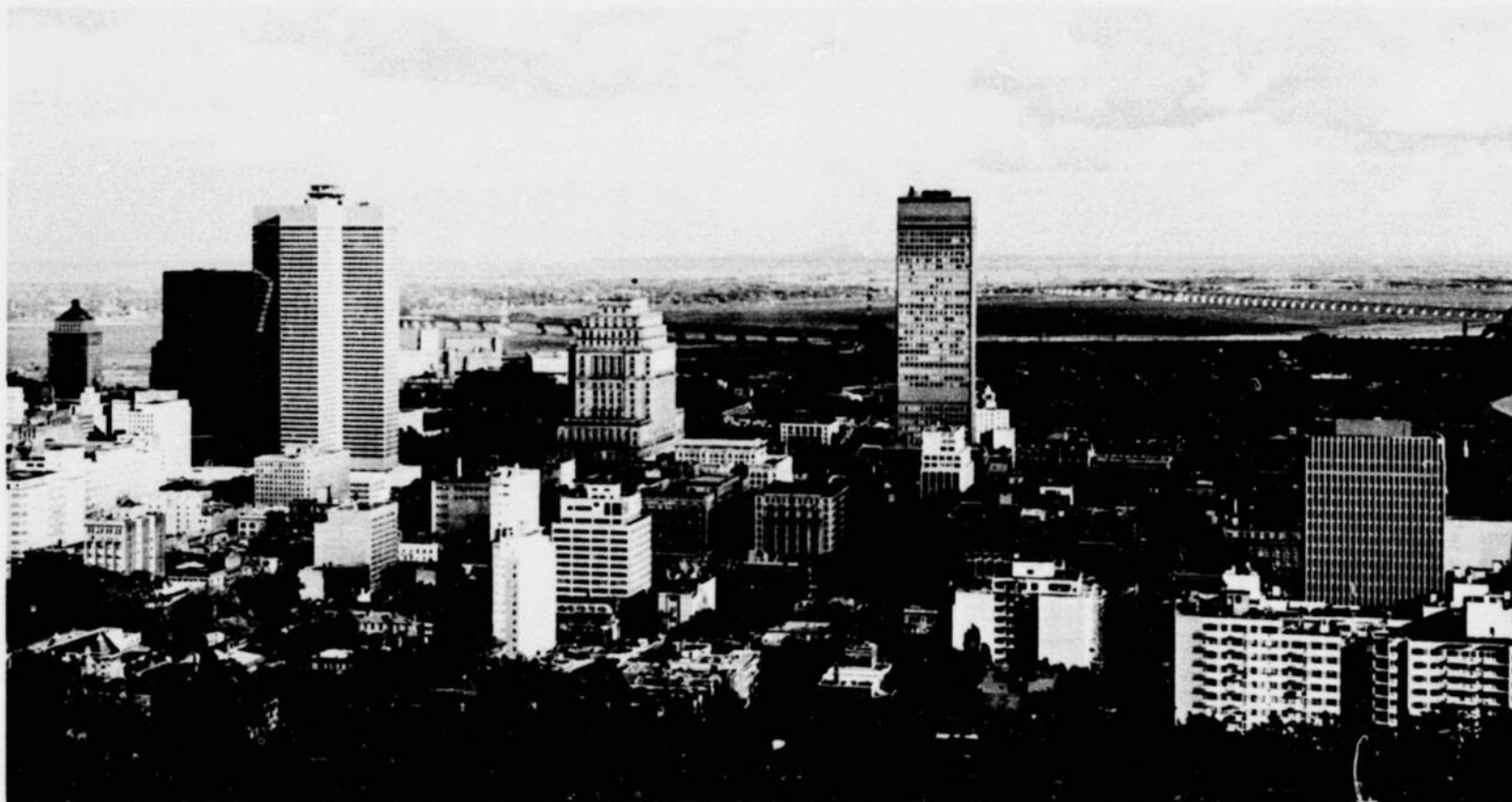
General view of Montreal from Mt. Royal