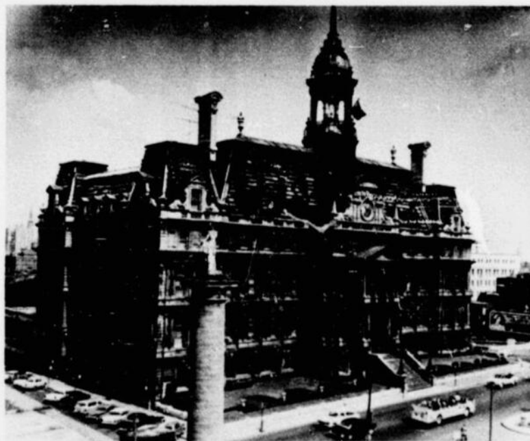
Montreal City Hall, Notre Dame Street West Hôtel de Ville de Montréal, rue Notre Dame ouest

Montreal's name comes from Mont-Royal or Mont-Réal, the title given this height by Jacques Cartier, who discovered Hochelaga in 1535, the year he explored the St. Lawrence River probably as far as the rapids, now called Lachine. Mont-Royal mountain, 769 feet high, stands nobly in the middle of an island, which is the largest of the group of islands formed by the confluence of the Ottawa and St. Lawrence Rivers. This island is 30 miles long and 7 to 10 miles wide, with an area of 194 square miles. The present City covers over 43,734 acres, having, by annexation, especially in 1883, grown from the 5,000 acres of 1860. It occupies one-quarter of the island and is 68 square miles in area.