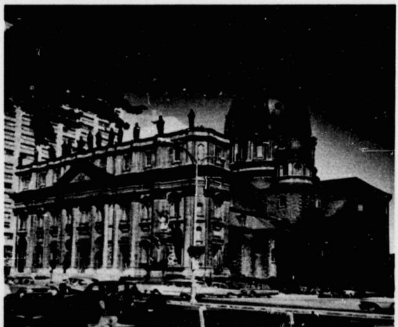
Cathédrale Marie Reine du Monde, boulevard Dorchester ouest Basilique Cathédrale Marie Reine du Monde, Dorchester Blvd West

L'autoroute panoramique des Laurentides, commencée en 1956 et terminée en 1960 jusqu'à Saint-Jérôme, part de Montréal à la sortie 17 du boulevard métropolitain, relie Montréal