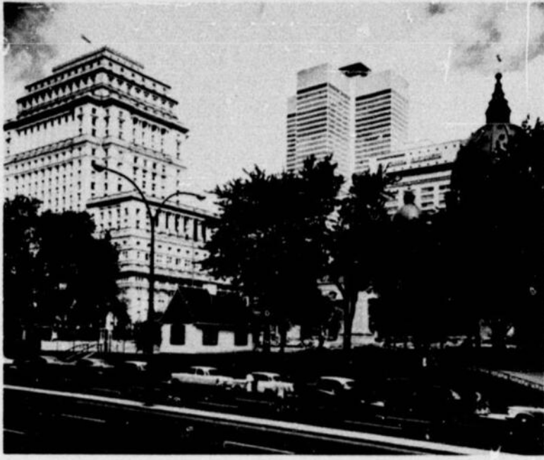
Place du Canada