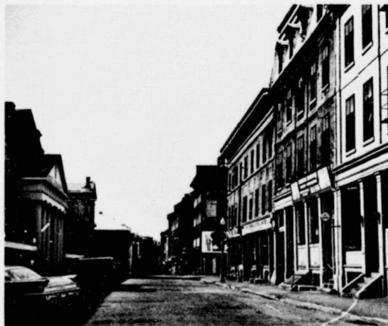
Rue St-Paul dans le Vieux Montréal St. Paul Street in Old Montreal

Montréal tire son nom de Mont-Royal ou Mont-Réal, le nom donné à cette élévation par Jacques Cartier, qui a découvert Hochelaga en 1535, l'année de son exploration du fleuve Saint-Laurent, probablement jusqu'au rapide qu'on appelle aujourd'hui Lachine. La montagne, de 769 pieds de hauteur, s'élève majestueusement au milieu de l'île qui est la plus grande du groupe d'îles formées par la rencontre de la rivière Ottawa et du fleuve Saint-Laurent. Cette île a 30 milles de longueur, 7 à 10 milles de largeur et une superficie de 194 milles carrés. La ville actuelle couvre plus de 43,734 acres ayant, par annexion, surtout en 1883, grandi de 5,000 acres qu'elle était en 1860. Sa superficie de 68 milles carrés occupe un quart de l'île.