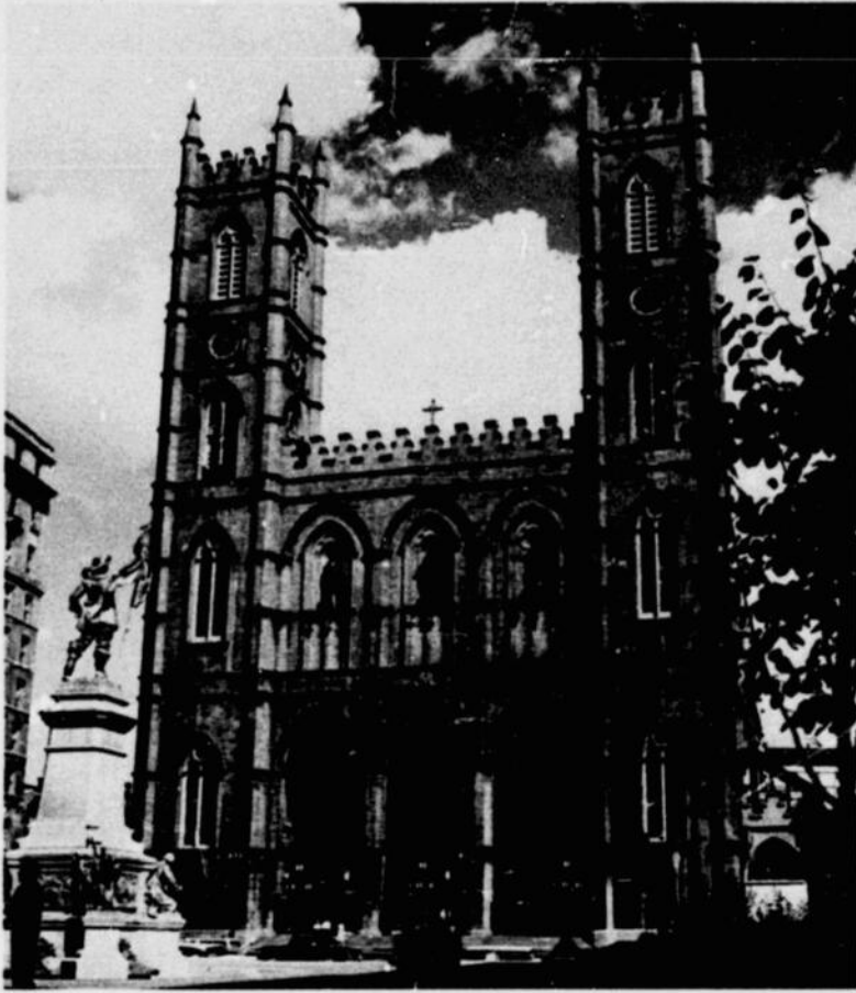
Notre Dame Church, Place d'Armes