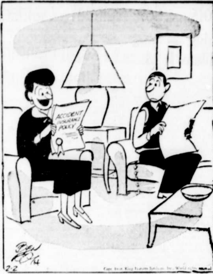
Si tu te casses la jambe tu recevras $3,000, soit le prix du manteau de fourrure que je désire avoir.

Le ministère est d'avis que la situation actuelle fait ressortir le besoin d'utiliser davantage les peuplements de bois franc, tout en adoptant des méthodes d'exploitation sylvoicole susceptibles de maintenir la vigueur de ces peuplements. Les vastes peuplements qu'on aurait dû exploiter avant aujourd'hui non seulement indiquent qu'on n'a pas assez profité des possibilités productives de nos forêts mais que ces réserves forestières accumulées sont particulièrement exposées aux attaques des insectes et d'autres organismes. Plus les étendues sont vastes, plus les dangers de pertes sont grands et plus il est difficile de réparer le bois. On devrait couper les bouleaux et merisiers dès qu'ils ont atteint leur pleine croissance; on doit éviter l'éclaircie à outrance et lorsqu'on effectue des abatages partiels on ne devrait pas tarder à couper les arbres qui restent car les arbres exposés subissent de graves dommages. Dans les peuplements mixtes, la coupe du bois à pâte de-