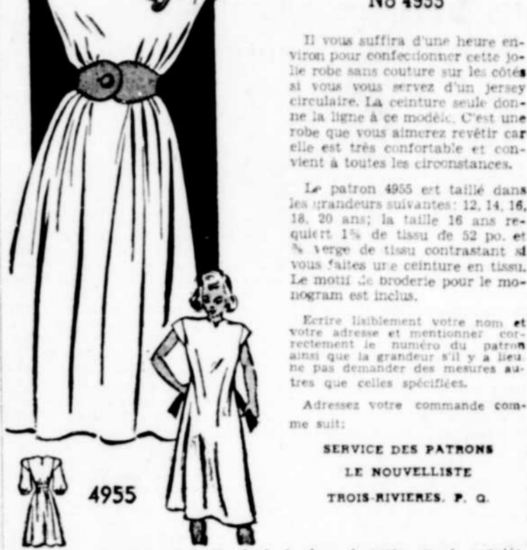
Le prix de ce patron est de 30c. Seuls les bons de poste seront acceptés, ainsi que la monnaie. Ne pas envoyer de timbres-poste. Les patrons offerts par notre journal ne sont pas échangeables et ne sont pas en vente à nos bureaux. Ils sont habituellement livrés dans un intervalle de 15 à 20 jours. N. B. — Les instructions servies avec ces patrons fabriqués par une maison anglaise ne sont fournies qu'en anglais.