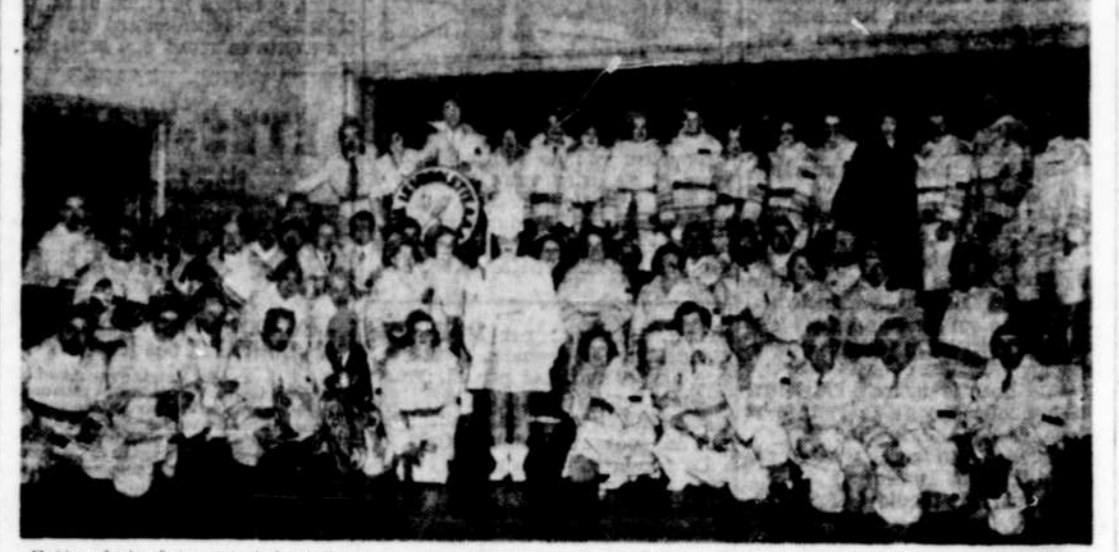
Cette photo fut prise à la gare en fin de semaine lors du départ des membres du club "Le Laviolette" pour la convention internationale tenue à Ottawa. Cette photo démontre l'imposante délégation locale à cette convention.