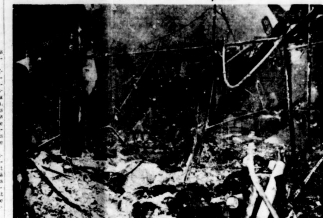
Un incendie de cause inconnue a détruit l'hôpital Lincoln Memorial à Grimsby, Ontario, causant des dommages évalués à plus de $150,000. Trois patients, deux adultes et six bébés, furent sauvés en moins d'une demi-heure. Cette photo montre ce qui reste de l'hôpital. On attribue au manque d'eau les proportions considérables que prit l'incendie en l'espace de quelques minutes.