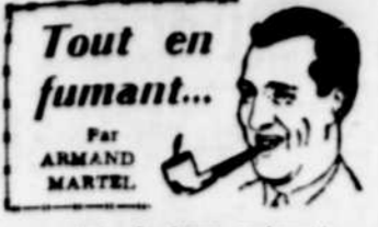
Tout en fumant... Par ARMAND MARTEL.

La soirée de boxe présentée samedi soir au Colisée a été un succès complet. Tous les boxeurs qui devaient participer aux batailles étaient présents. Près de 3.000 personnes, soit une assistance-record, applaudissent aux efforts des pugilistes.