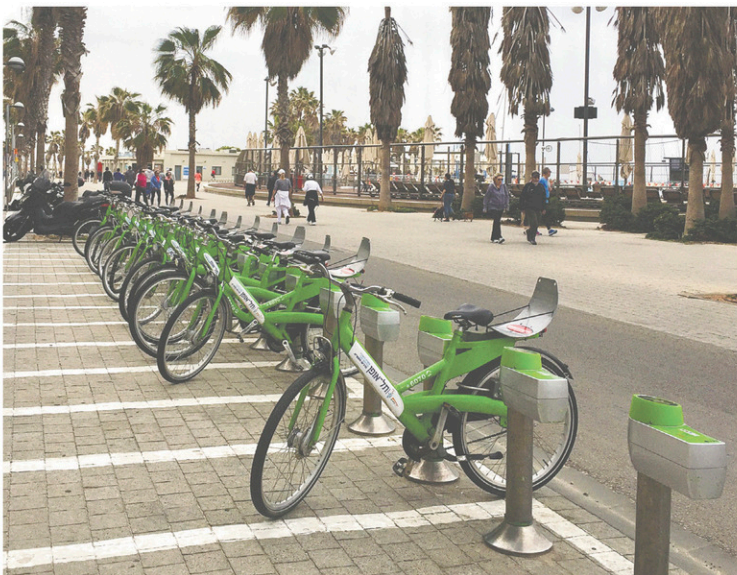
On compte plus de 120 kilomètres de voies cyclables à Tel-Aviv. Un système de location semblable au Bixi de Montréal permet d'enfourcher une bicyclette dans plus de 75 stations. À droite: un bar à salade au marché Sarona.