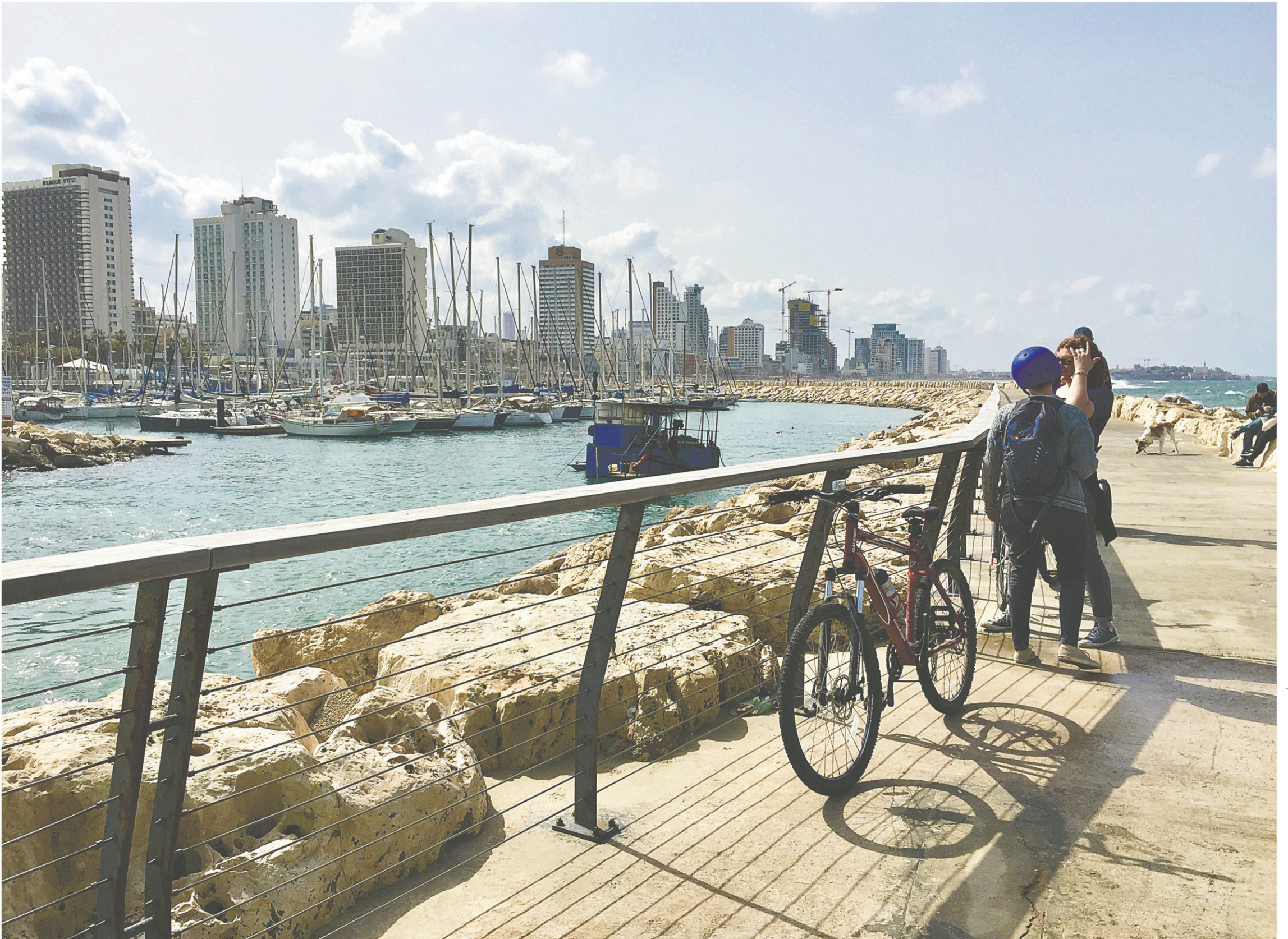
On roule sur la jetée de la marina de Tel-Aviv

CAHIER D > LE DEVOIR, LES SAMEDI 1 ER ET DIMANCHE 2 JUILLET 2017