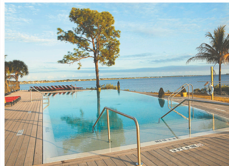
CLUB MED SANDPIPER

Des piscines rectangulaires, petites selon les critères actuels des resorts tout compris, constituent l'offre baignade-bronzage. Une piscine pour les familles, une autre constituée de couloirs et une autre, la Calm Pool, devant la rivière, possède un grand bain à remous.