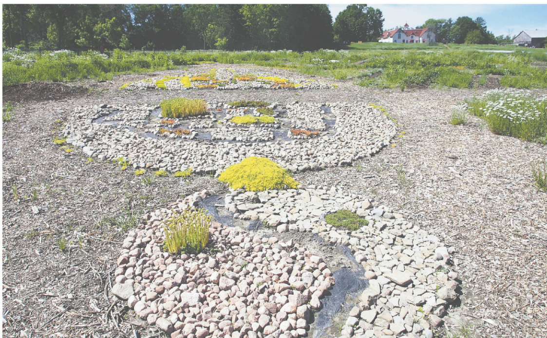
Au jardin ethnobotanique sont mises en vedette des plantes destinées à la fabrication de tissus et de teintures et pour l'aménagement paysager.

nada ; Paysage euphonique , de MANI du Canada ; Soundcloud , de l'architecte-paysagiste Johanna Ballhaus et de l'architecte Helen Wyss du Canada et de la Suisse ; et Haiku , des architectes Francisco A. García Pérez et Alesandra Vignotto d'Espagne.