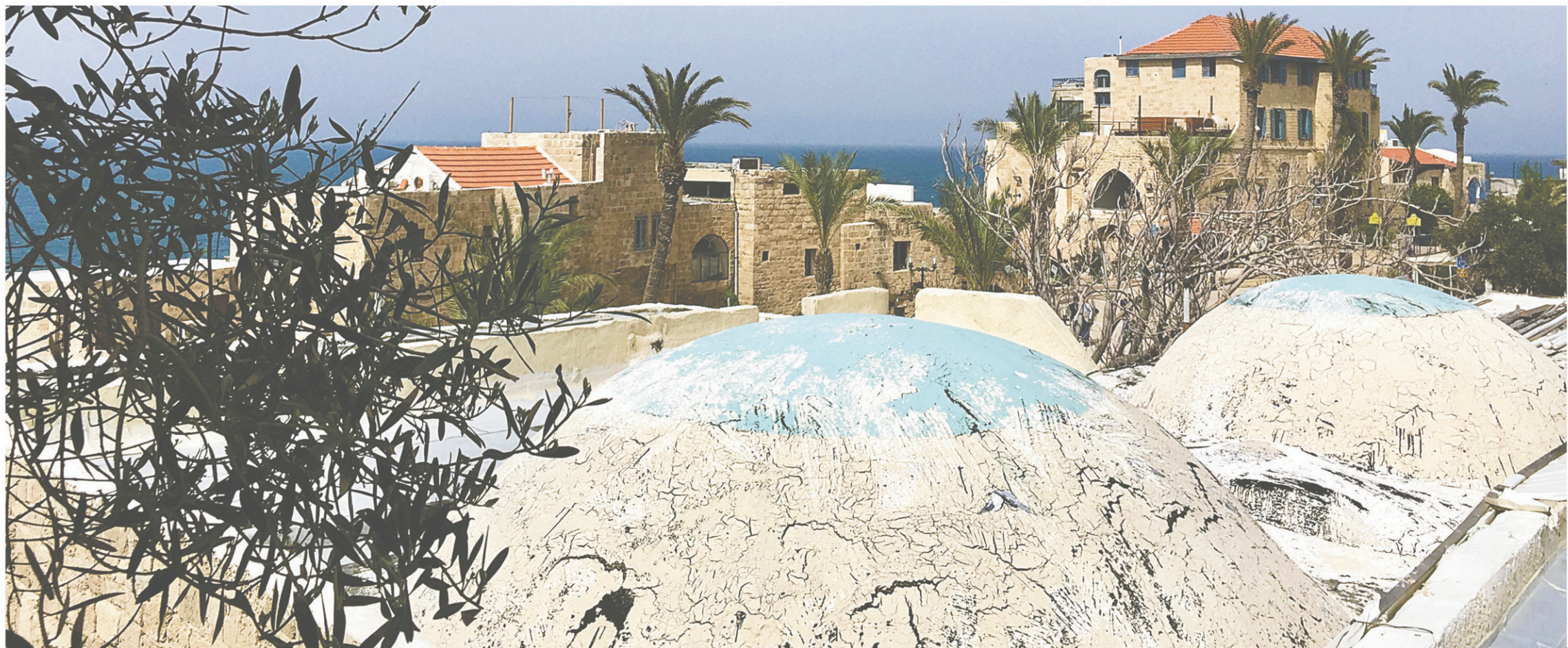
Vue sur le Vieux-Jaffa de la terrasse panoramique du musée Ilana Goor.

Tel-Aviv-Jaffa a des airs de vacances et de liberté. Avec une histoire de 3500 ans. Inutile de dire que seuls quelques jours, c'est bien peu pour l'explorer. D'accord avec le guide Lonely Planet Israël et les territoires palestiniens : «Seule une immersion d'au moins une semaine à Tel-Aviv permet d'en saisir l'essence.»