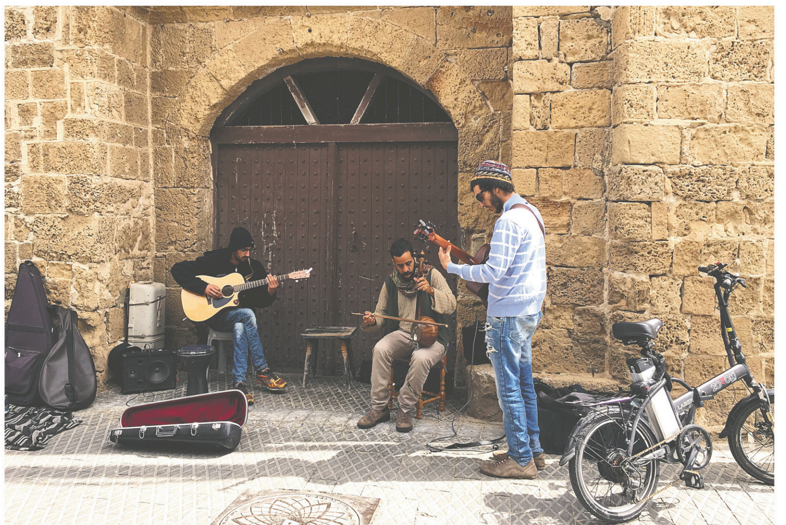
Le vélo est le mode de transport de bien des Tel-Aviens.

On se divertit ici comme s'il y avait urgence de vivre. Peut-être est-ce le cas dans cette ville de quelque 400 000 habi-