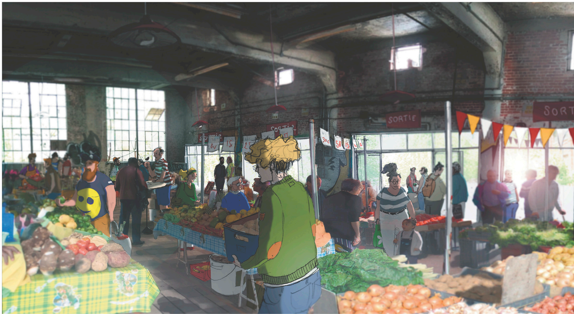
L'Oil Store, un édifice détaché du reste, au bout du bâtiment, accueillera une serre intérieure, un espace collaboratif culinaire et une aire polyvalente, où se tiendront des événements et des marchés fermiers (maquette ci-dessus).

Après des années de batailles, les citoyens mobilisés ont remporté la victoire et fixé les nouvelles règles du jeu. Un jeu où le social prime: des logements abordables, des structures de soins et d'accueil, un volet de diffusion culturelle, des infrastructures et des services liés à l'alimentation.