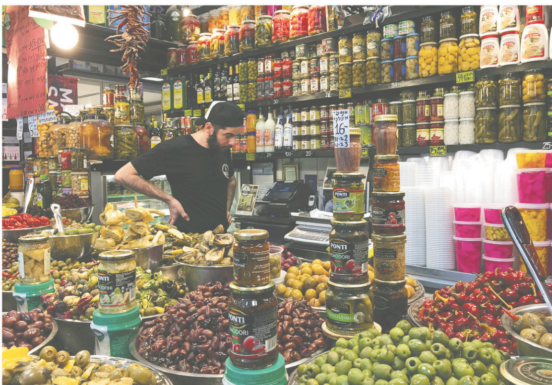
Le marché Sarona propose le meilleur de la gastronomie des quatre coins du monde, dans le quartier historique, une ancienne colonie de templiers allemands des années 1870. À droite: les vieilles ruelles de Jaffa, où il fait bon flâner. Les archéologues ont établi que c'était déjà un port fortifié au XVIII e siècle avant Jésus-Christ.

Tel-Aviv se visite bien à vélo. La ville est petite et plate — géographiquement —, avec des pistes cyclables un peu