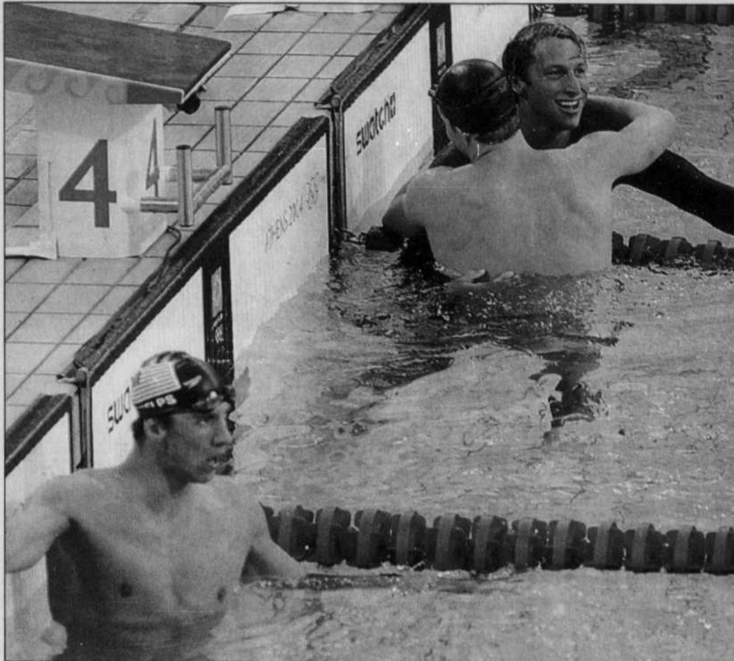
Pendant que Ian Thorpe et Peter van den Hoogenband célébraient, hier à Athènes, Michael Phelps était surpris de sa troisième place.

Entre les deux hommes, la course a été passionnante. Le Batave est parti en bolide, passant à mi-course avec plus d'une seconde d'avance sur le record du monde, mais, dans les derniers 50 mètres, il a faibli et Thorpe l'a passé sans faillir. Même s'il a été dominé, Phelps a tenu son rang, battu seulement de 9/100 pour la médaille d'ar-