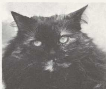
UNE AMIE DE L'AUTEURE