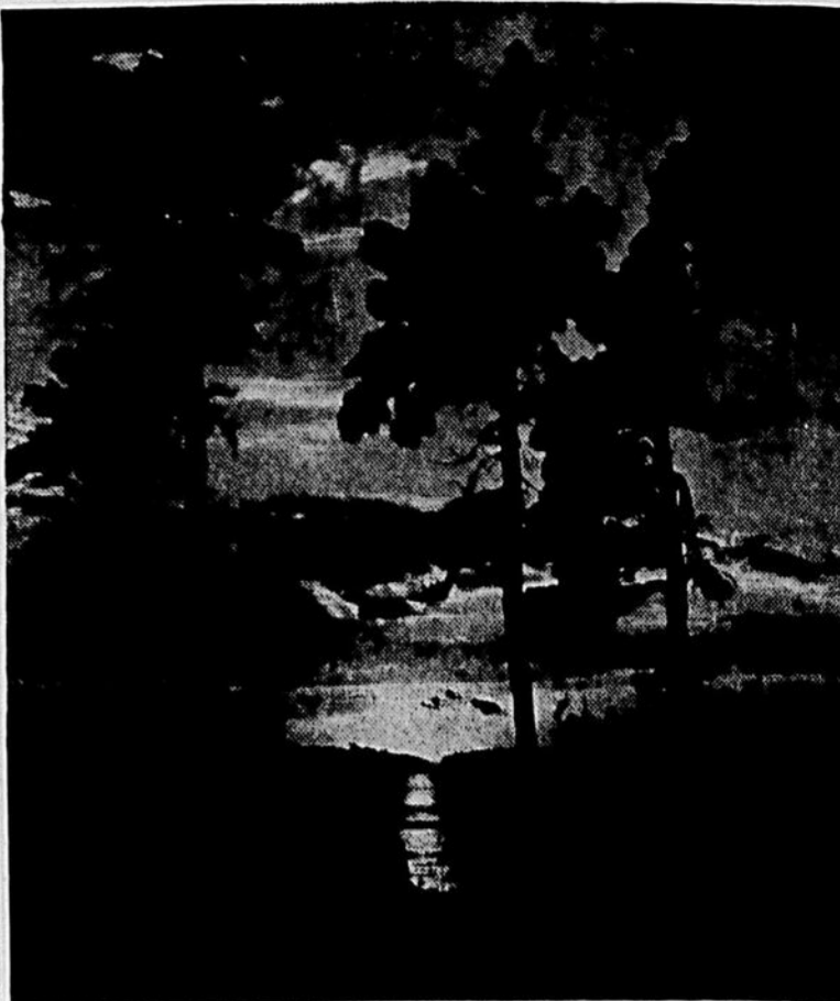
Les couchers de soleil sont une source inépuisable de bonnes photos.