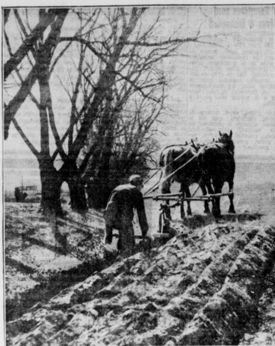
Tirez droit la charrue — Le spectacle des la- l'eau produite par la fonte des neiges et les pluies extrêmement rare, mais le photographe de la Tribune puisse labourer.

Il suffit ensuite de choisir un groupe de bûcherons par paroisse qui participent aux opérations de Chantier-Ecole où tout l'hiver durant, sous la direction des propagandistes du service forestier de l'U.C.C. et de la fédération des chantiers-coopératifs, des cercles d'études seront tenus à chaque semaine où l'on étudiera en détails les règlements et l'administration des chantiers et après avoir passé un hiver d'études intensives où on aura vu la théorie et la pratique, de retour dans leurs paroisses respectives ces membres du chantier-école feront