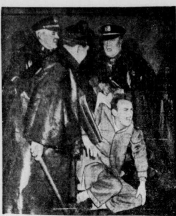
Tumulte à Wall Street — Au cours de la grève des employés de la Bourse de New-York, il y eut de fréquentes altercations entre les piqueteurs et les grévistes. La scène ci-dessus fut photographiée par une pluie battante qui ne parvint pas à apaiser le feu des grévistes. Certaines manifestations alignèrent jusqu'à 2,000 personnes.