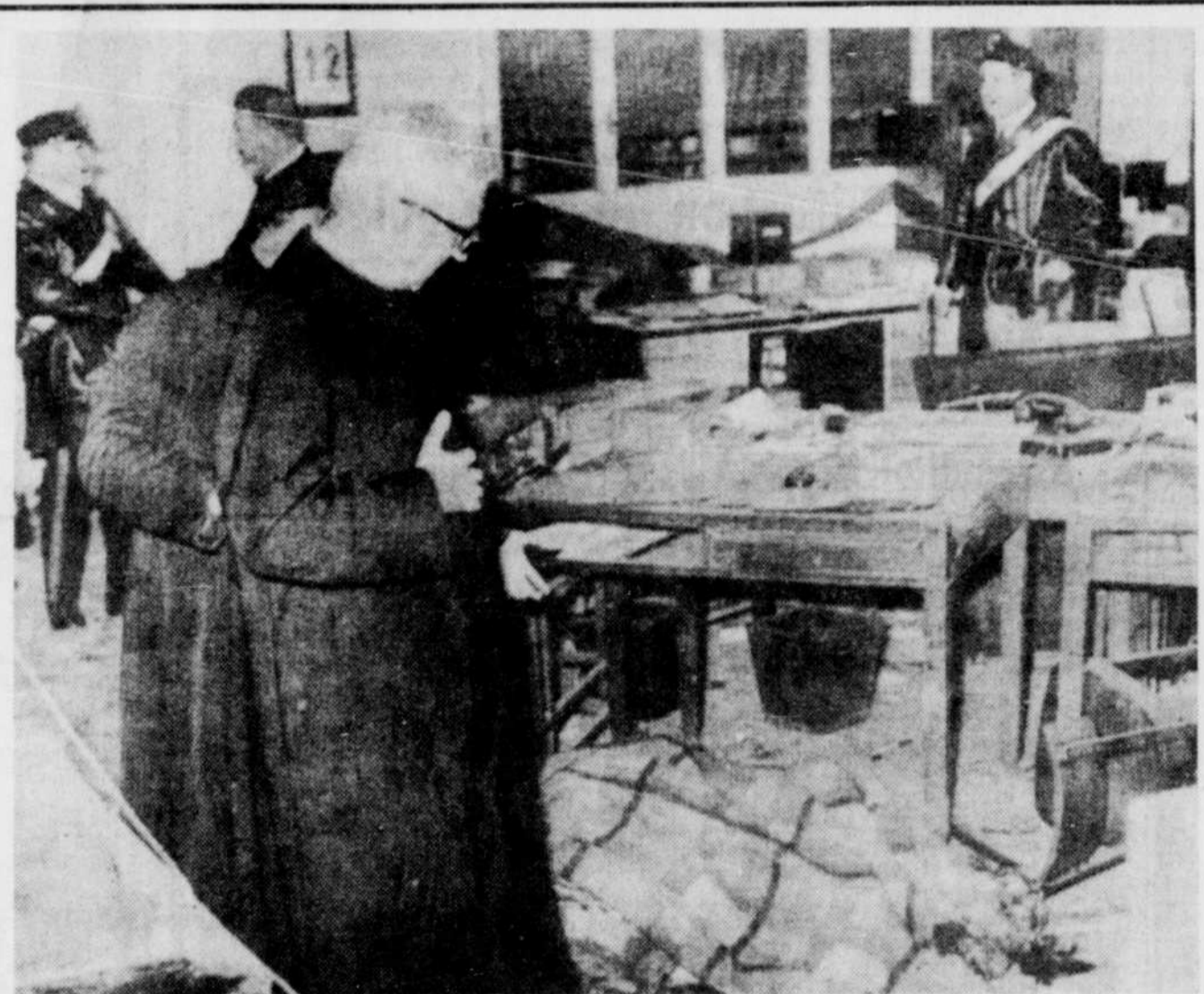
VENT DE VIOLENCE A ROME ET MILAN — Un prêtre administre les derniers sacrements aux victimes de l'explosion d'une bombe à la Banque Nationale d'Agriculture de Milan en Italie. D'autres explosions ont ravagé des quartiers de Rome et Milan, à la suite d'une explosion de violence qui secoue l'Italie entière. On compte jusqu'à maintenant 14 morts et plus de 90 blessés.

M. Chabot a déclaré que le projet de loi déposé à l'Assemblée nationale vendredi par le premier ministre Bertrand en vue de créer une loterie provinciale n'affectera pas ce projet des mouvements indépendantistes.