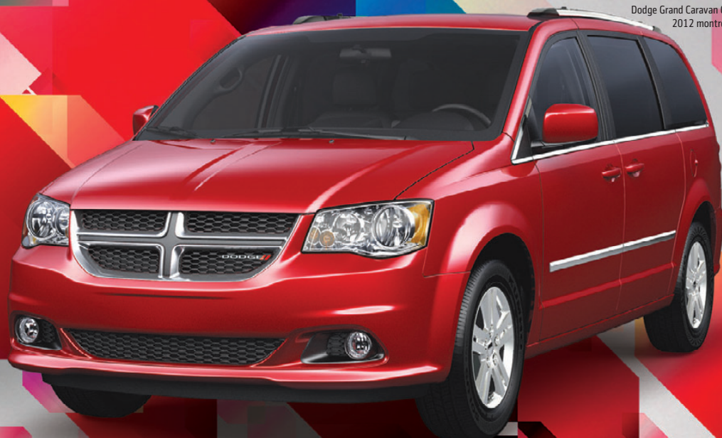
Dodge Grand Caravan Crew 2012 montrée**

C'EST LE MOMENT D'EMBARQUER DANS LA MINI-FOURGONNETTE LA PLUS VENDUE AU PAYS.