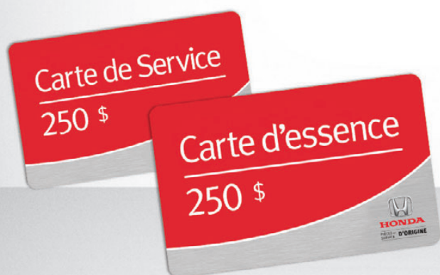
HONDA CARTES D'ESSENCE ET CARTES DE SERVICE

LES PIÈCES ET LE SERVICE HONDA D'ORIGINE DONNENT À UN PROPRIÉTAIRE ACTUEL LA CHANCE DE GAGNER* LA LOCATION-BAIL D'UNE NOUVELLE HONDA CIVIC AINSI QUE DE NOMBREUX AUTRES PRIX FANTASTIQUES.