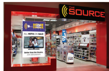
La façade varie d'un magasin à l'autre