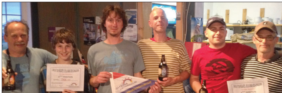
Les gagnants de la toute première étape du Circuit de régates de la Baie-des-Chaleurs, qui s'est tenu le 23 juin dernier.