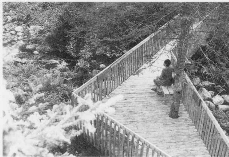
Les sentiers de Bégin.

À partir de 1949, les membres du Club de montagne le Canadien (CMC) parcouraient les premiers sentiers récréatifs pour aller au pied des parois. Quelques pistes de ski de fond tracées par le célèbre skieur Jackrabbit servaient aussi l'été pour les premiers randonneurs. Dans les années 1970, la marche, comme activité de loisirs, commence à inté-